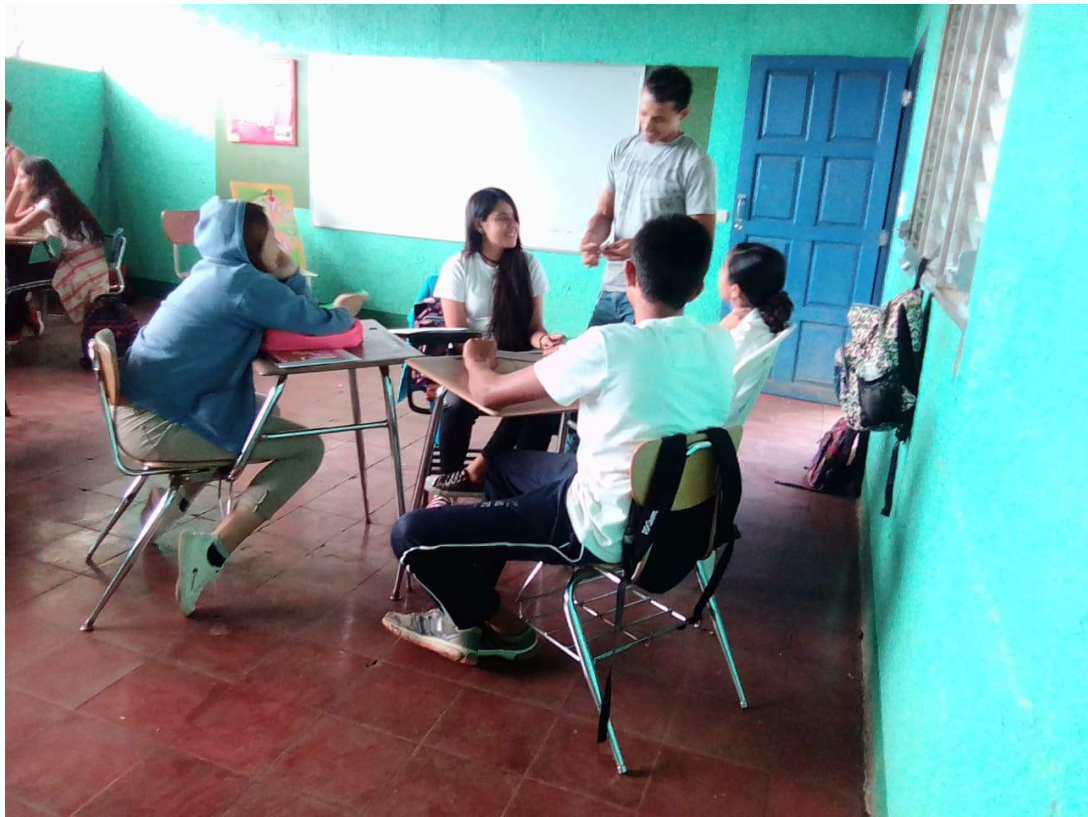
Ilustración 3 Demostración del uso de metales en los lapiceros.