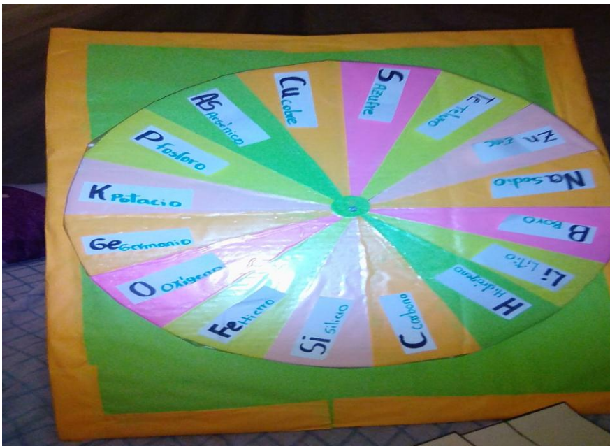
Ilustración 7 Ruleta utilizada en la estrategia metodológica el "Bingo".