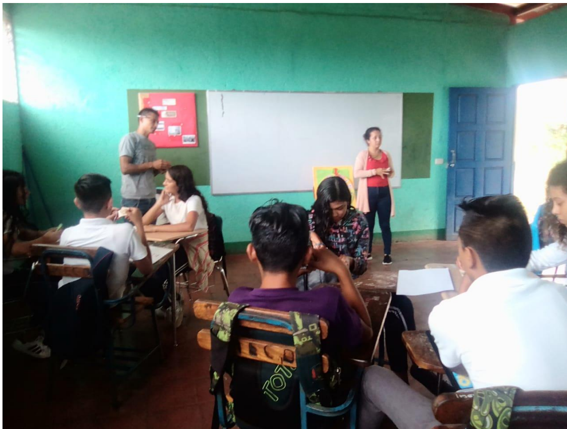
Ilustración 1 Orientaciones preliminares para la aplicación de la estrategia metodológica el "Bingo".