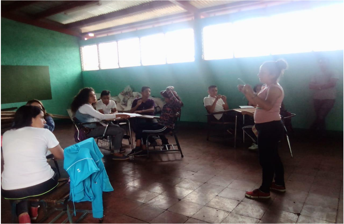
Ilustración 6 Demostración de las características de los metales