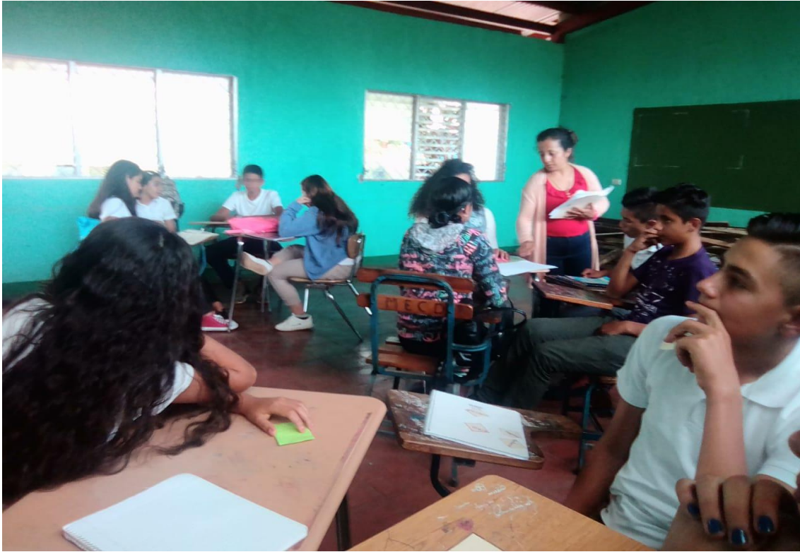
Ilustración 4 Entrega de cuadros comparativos, donde se identificarán las diferencias entre metales, no metales y metaloides.