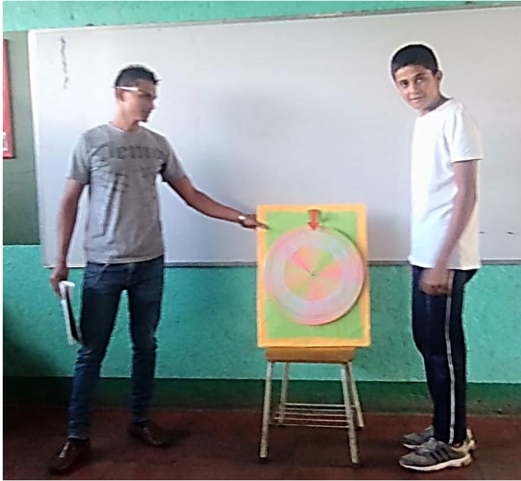
Ilustración 8 Uso de la ruleta para la estrategia metodológica el "Bingo".