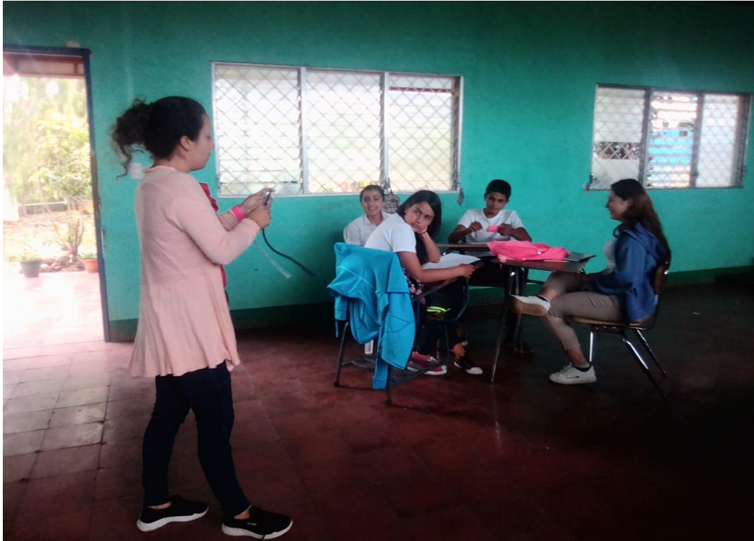
Ilustración 2 Demostración del uso de metaloides en la industria.