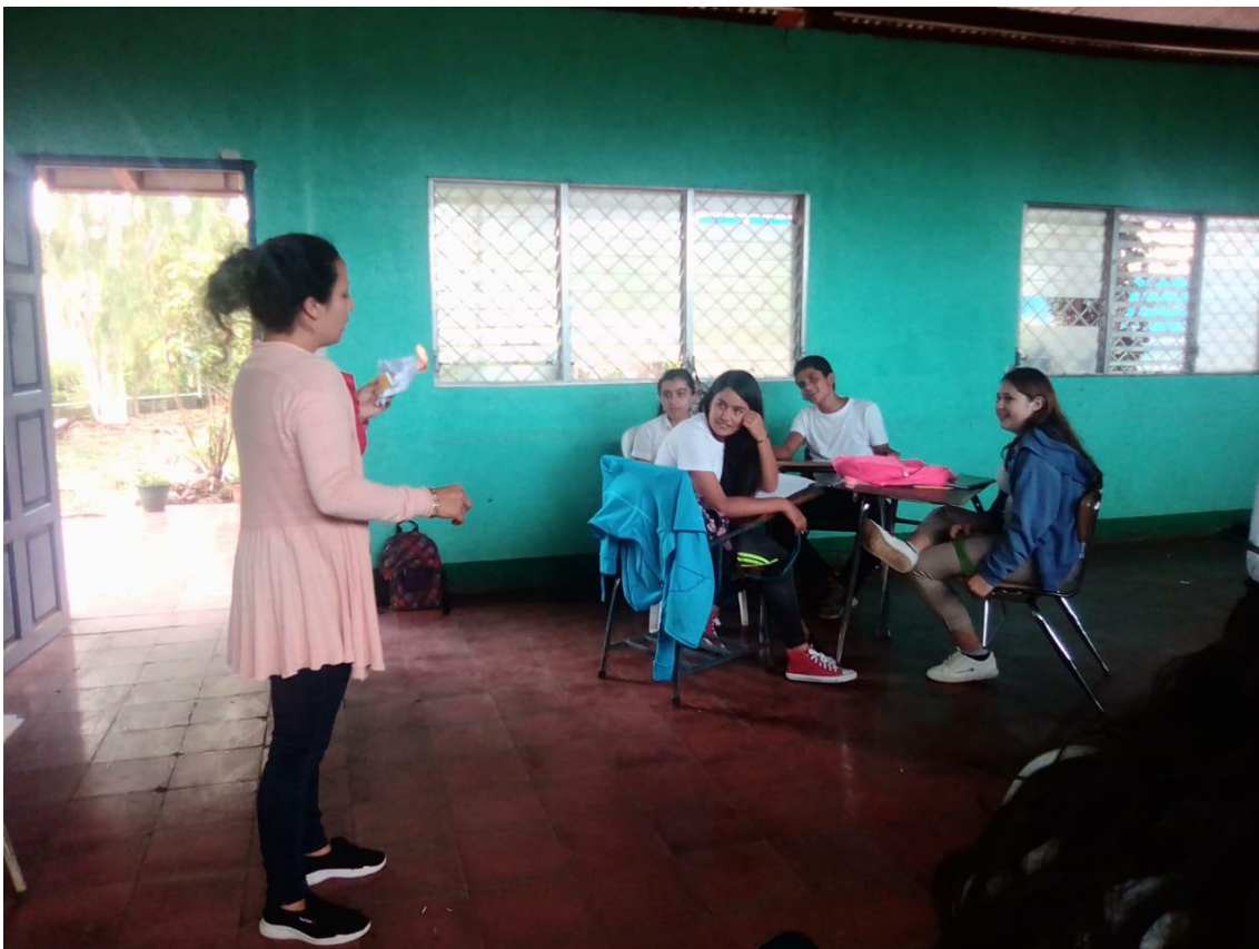
Ilustración 5 Demostración como el papel se convierte en un no metal (Carbón).