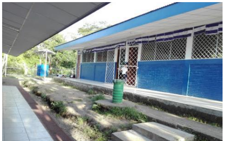
Imagen 6: Remodelación de los pabellones donde se imparte secundaria.