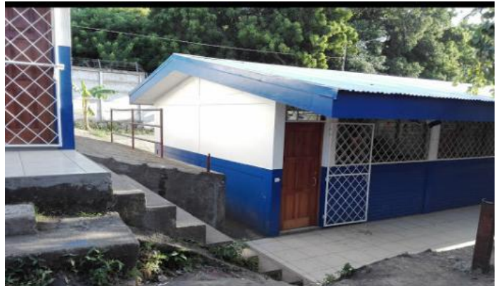
Imagen 4: Pabellón de 2do y 3er grado de primaria