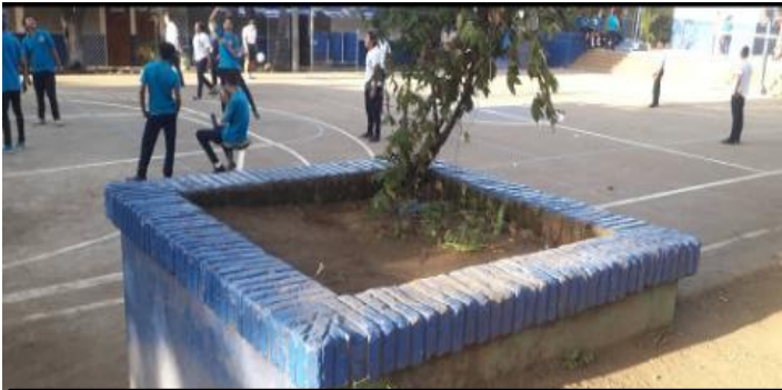
Imagen 9: Estudiantes de secundaria en horario de receso.