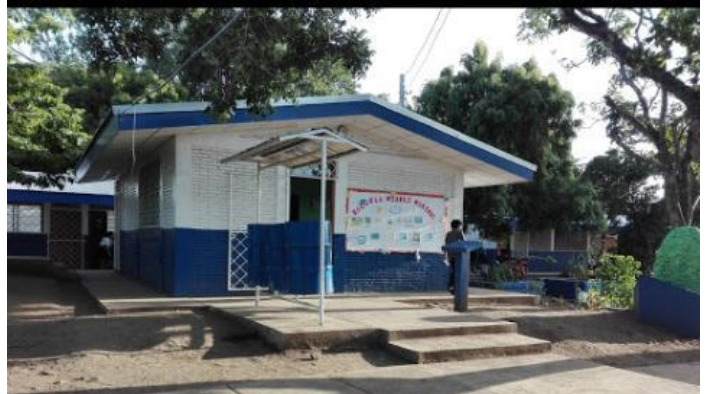
Imagen 2: Dirección del centro escolar Publico Modelo Monimbó.