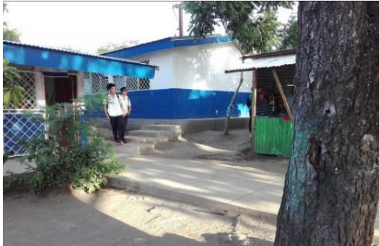
Imagen 10: Área de consumo de alimentos en tiempo de receso.