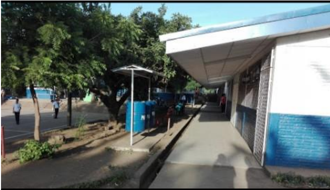
Imagen 3: Pabellón de 4to y 5to de primaria