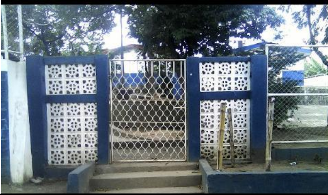
Imagen 1: Portón principal del colegio Público Modelo Monimbó rehabilitado actualmente.