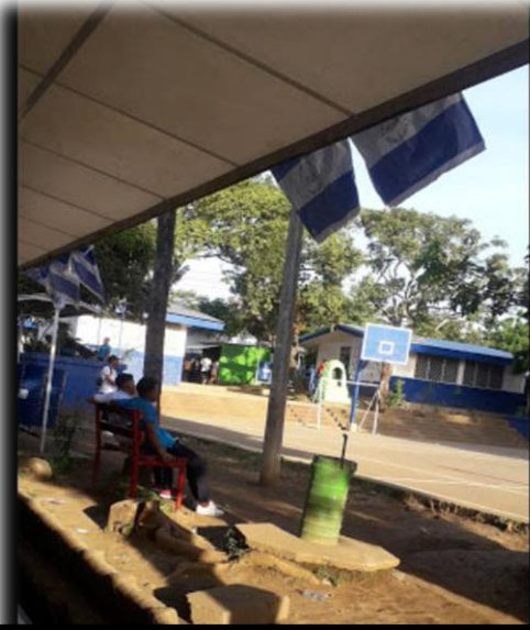
Imagen 7: Parte principal de la cancha del Colegio Modelo Monimbó.