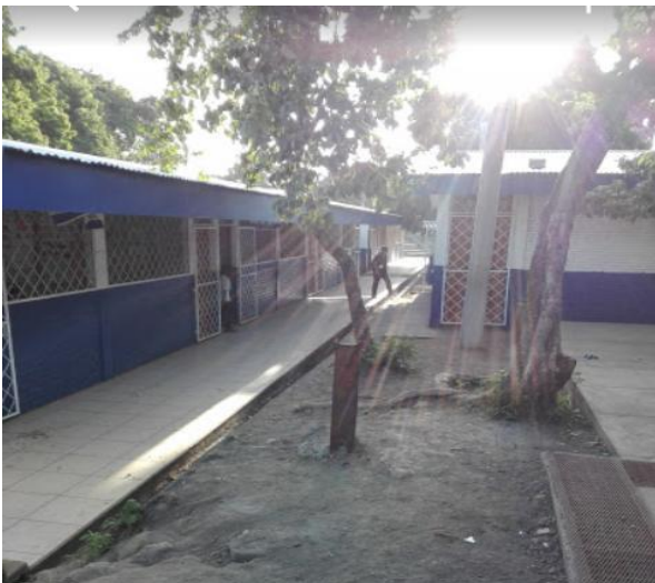
Imagen 5: Pabellón de 6to grado de primaria.