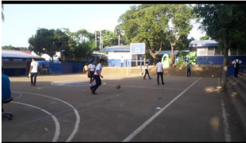
Imagen 11: Cancha y área de recreación de los estudiantes.