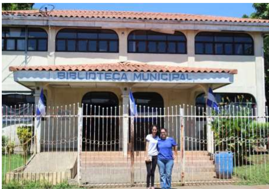
Fotografía 4: Biblioteca Municipal Rubén Darío (Chichigalpa)