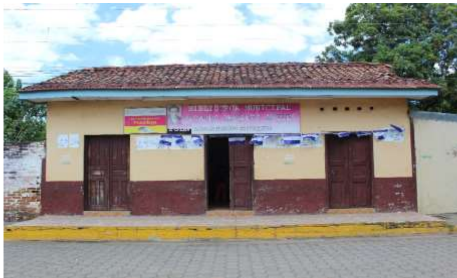
Fotografía 3: Biblioteca Municipal Ricardo Morales Avilés (Posoltega) Fuente: Mojica, O. (2019) Corinto – Chinandega