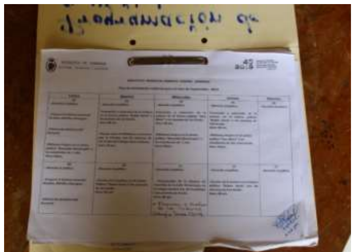
Fotografía N° 6 Mojica, O. (2019). Plan de Actividades del mes de Septiembre 2019, Biblioteca Municipal Manolo Cuadra.

Los Gestores de Información de la Biblioteca Municipal de Granada presentan una agenda de Gestión Cultural diversa para su comunidad entre las mejores experiencias se destacan Charlas escolares, Circulo de lectura, Recorrido cultural en sitios representativos de Granada, siendo sus mejores cómplices los centros escolares del municipio que al igual que las bibliotecas buscan incluir a sus estudiantes en el mundo de la lectura.