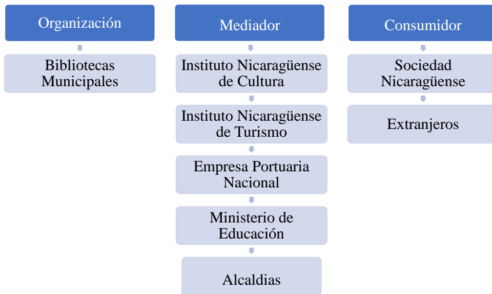
Gráfico 1: Elaboración propia- Christel Suárez