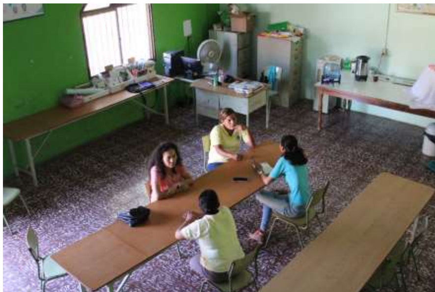
Fotografía 1: Entrevista a personal de Biblioteca Municipal Rubén Darío (San Jorge, Rivas)