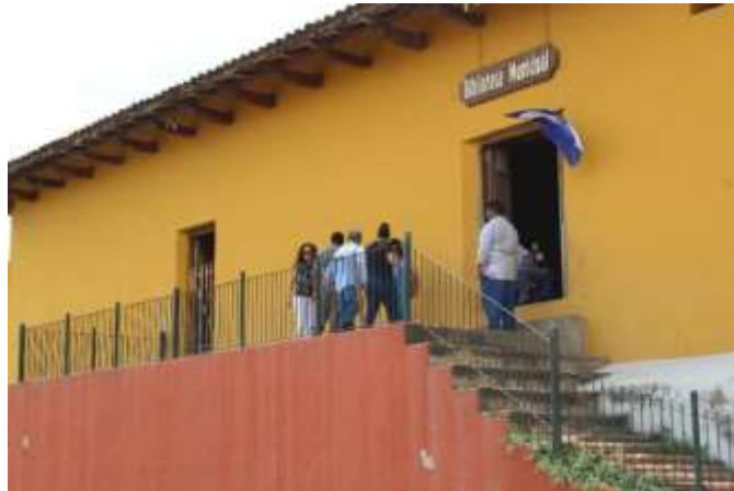
Fotografía N° 5 Mojica, O. (2019). Biblioteca Municipal Manolo Cuadra, Granada.

La biblioteca en su infraestructura cuenta con las condiciones para desarrollar actividades, pero no tiene accesibilidad para las personas con alguna discapacidad física o sensorial al no contar con una rampla se les dificulta subir gradas. La biblioteca debe garantizar un acceso fácil a todos sus usuarios.