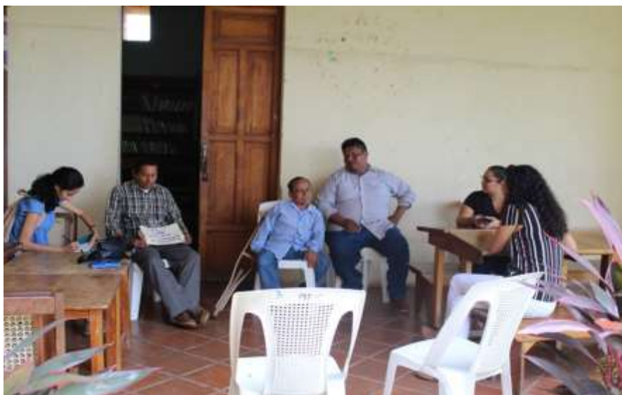
Fotografía 2: Colaboradores de la Biblioteca Municipal Manolo Cuadra (Granada) Fuente: Mojica, O. (2019) Granada