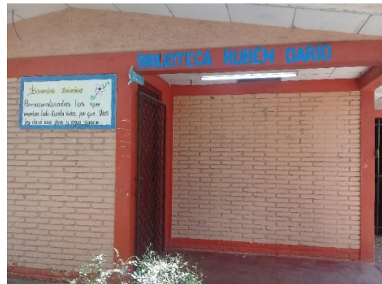
Sala de informática y biblioteca escolar. La sala de informática que utilizada por algunos docentes para el desarrollo de las clases y la biblioteca escolar que no es muy aprovechada por los estudiantes para realizar las investigaciones