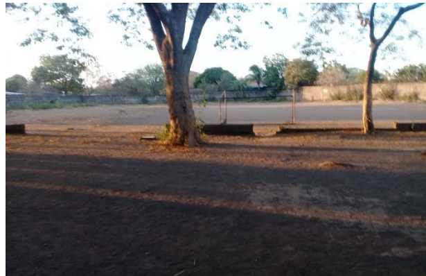
Espacios de recreación y prácticas deportivas. La cancha multiusos y el campo deportivo en donde los estudiantes se concentran a la hora del recreo, en las horas de educación física y que algunas veces son ocupados de escondites cuando los alumnos se retiran del aula de clases para no recibir alguna determinada disciplina.