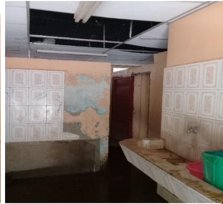
Servicios higiénicos de los varones, en donde se aprecia que hace falta higiene y remodelación de ese espacio