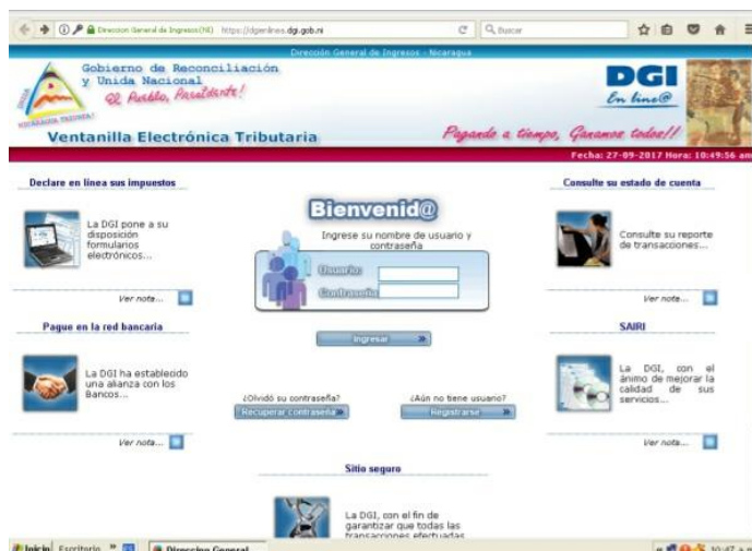
Figura 4: Pantalla de Inicio de la VET