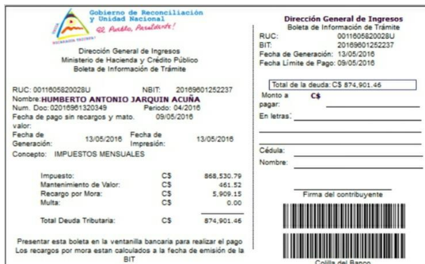
Figura 8: Ejemplo de BIT