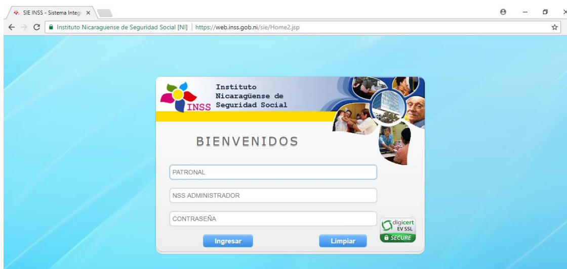
Figura 9: Pantalla de inicio del SIE

En el caso de las contribuciones especiales que comprende el Seguro Social y el aporte al INATEC se deberán de pagar al INSS al mismo tiempo sobre los salarios de cada uno de los trabajadores que laboran en la empresa; a través del Sistema Integrado de Aplicaciones Específicas (SIE), el cual fue diseñado específicamente para el proceso de inscribir y/o dar de baja a los trabajadores, declaración e imprimir facturas del INSS.