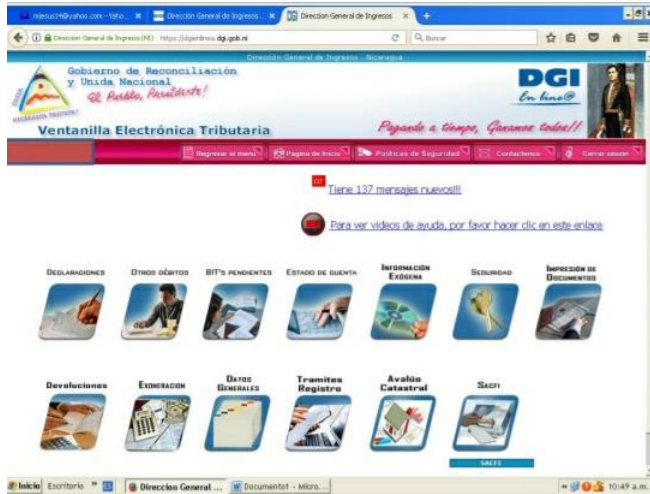
Figura 5: Menú de Inicio de la VET