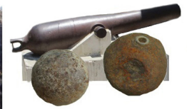
Fortaleza El Vigía con su cañón y balas.

marzo de 1928 se inauguró la Red Ferroviaria entre San Jorge y San Juan del Sur, que establecía el contacto con el interior del país por medio del Vapor Victoria que hacia la travesía entre San Jorge y Granada; la población conserva fotografías del tren y del tanque donde cargaba combustible y pitaba para despues entrar a la calle principal hasta llegar al puerto donde descargaba los productos que traían del interior del país para exportarlos y cargaba los productos importados para llevarlos hasta donde serían comercializados. A partir de 1940 San Juan del Sur pasa a ser el Puerto del Cabotaje, por donde se realizaban toda clase de exportaciones e importaciones, uno de los vestigios más interesantes de esta época es El Faro de Cabotaje.