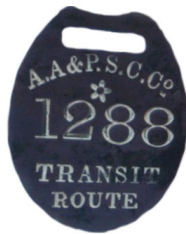
Vestigios de la ruta del oro o del tránsito. Puente de arco y placa de bronce.

La guerra nacional dejó un inmueble conocido como La Fortaleza El Vigía, fue mandada a construir por el invasor William Walker en 1856, cuando se posicionó de San Juan del Sur y decretó un estado de guerra. Citando a Frank Leslie's, el esclavista Walker obligó a ciertos pobladores de San Juan del Sur a triturar rocas y subirlas hasta la colina donde se estaba haciendo la construcción. También mando a instalar dos cañones para la defensa y el control de los buques de guerra. (Leslies, 1976) .La fortaleza se conserva In Situ, pero los cañones y bolas están en manos de personas de la comunidad.