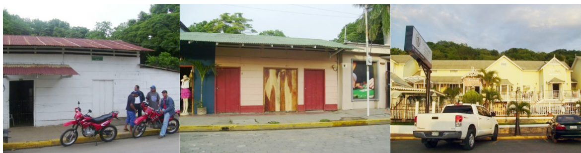
Casas con mas de 100 años en San Juan del Sur.

Según el concepto de Miguel Argibay la multiculturalidad desde la antropología cultural. Significa que se constata la existencia de diferentes culturas en un mismo espacio geográfico y social. Sin embargo estas culturas cohabitan, pero influyen poco las unas sobre las otras y no suelen ser permeables a las demás. Se mantienen en guetos y viven vidas paralelas. La sociedad de acogida suele ser hegemónica y establecer jerarquías legales y sociales que colocan a los otros grupos en inferioridad de condiciones, lo que lleva al conflicto, al menosprecio, a la creación de estereotipos y prejuicios dificultando la convivencia social, siempre en detrimento de los grupos más débiles. En los casos en que exista equidad y respeto mutuo se puede pasar de la multiculturalidad al multiculturalismo. (Argibay, 2009). En base a esto podemos afirmar que en San