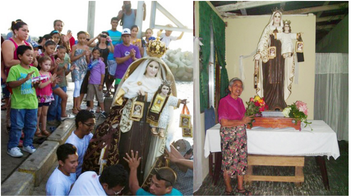
Comunidad de San Juan del Sur celebrando a la Virgen del Carmen.