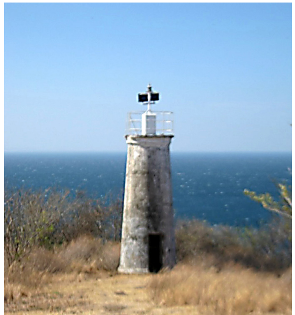
Faro del cabotaje de 1940.

marzo de 1928 se inauguró la Red Ferroviaria entre San Jorge y San Juan del Sur, que establecía el contacto con el interior del país por medio del Vapor Victoria que hacia la travesía entre San Jorge y Granada; la población conserva fotografías del tren y del tanque donde cargaba combustible y pitaba para despues entrar a la calle principal hasta llegar al puerto donde descargaba los productos que traían del interior del país para exportarlos y cargaba los productos importados para llevarlos hasta donde serían comercializados. A partir de 1940 San Juan del Sur pasa a ser el Puerto del Cabotaje, por donde se realizaban toda clase de exportaciones e importaciones, uno de los vestigios más interesantes de esta época es El Faro de Cabotaje.