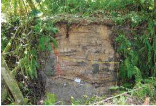
Limpieza de perfil del conchero Angie, en Monkey Point. 2013. Nótese parcialmente la cata de sondeo realizada por J Espinoza en los años 70 del siglo pasado.

esa ocasión corroboraron la presencia, no solo de uno, sino de tres concheros más.