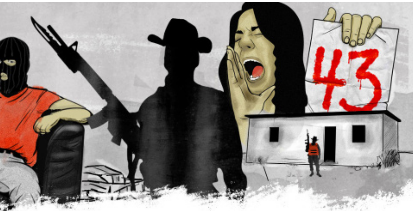
Ilustración tomada de http://interactive.fusion.net/mexico-history-violence/