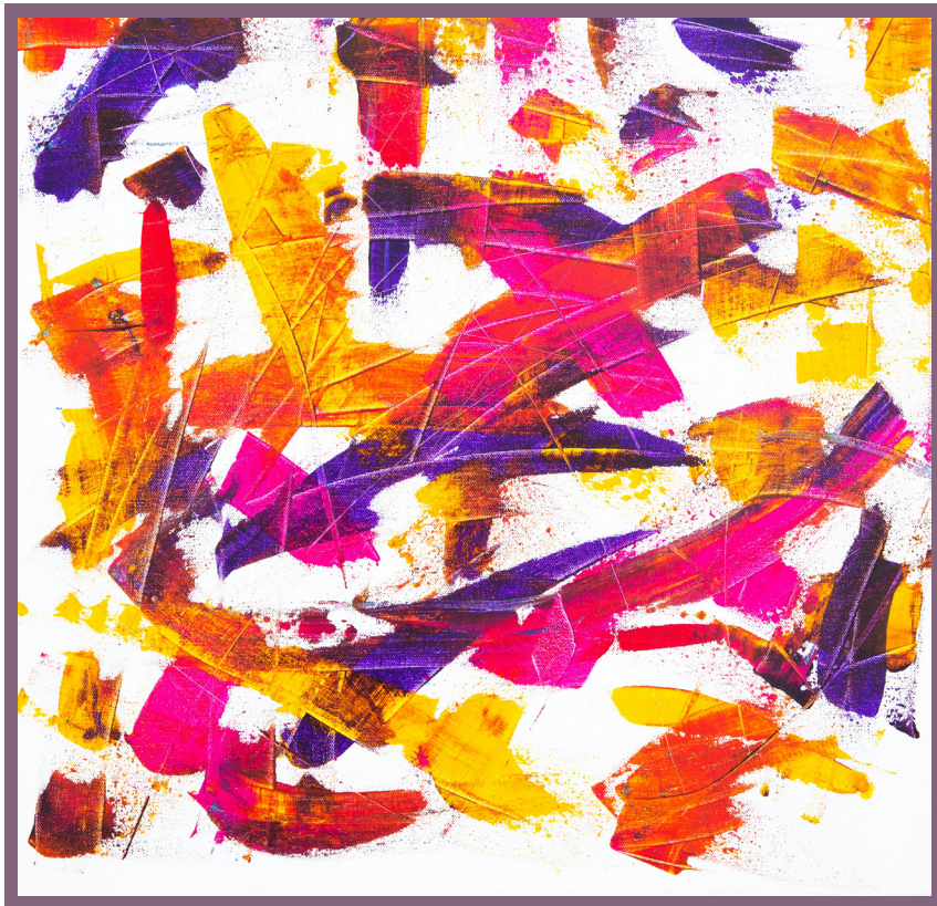
Arte de Markus Spike