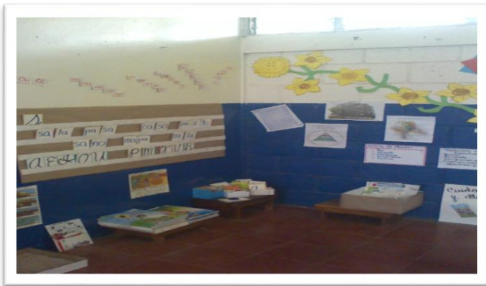
Rincones de aprendizaje.