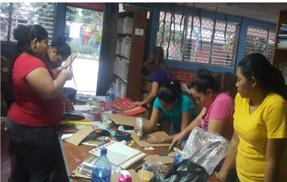
Ilustración 2 Elaboración de estrategias metodológicas