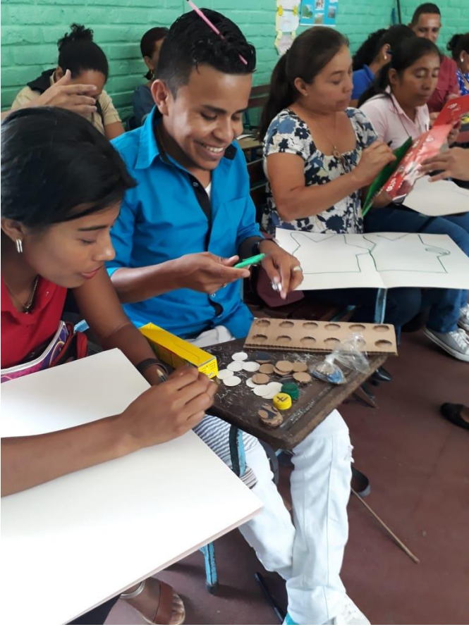
Ilustración 3 Capacitaciones a docentes de primaria multigrado y preescolar