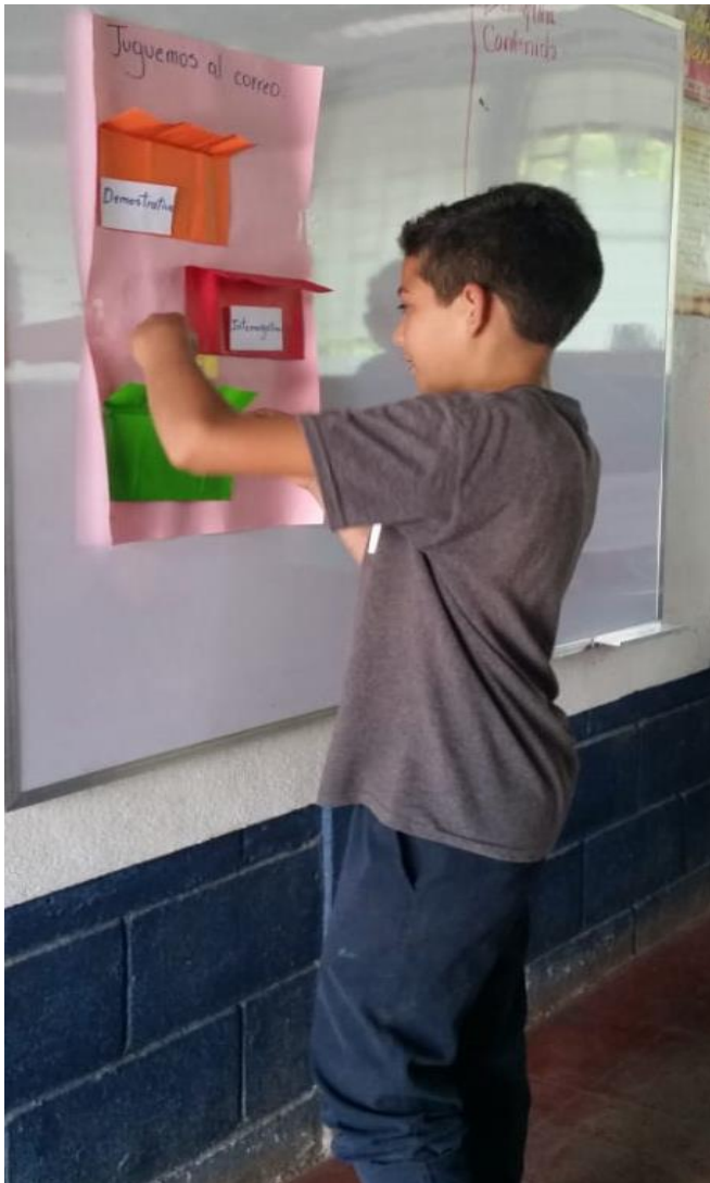
Ilustración 4 Aplicación de estrategias a niños y niñas en la escuela San Francisco de Asís