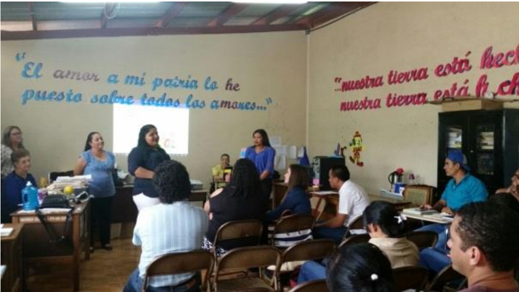
Ilustración 6 Presentación de adecuación curricular al MINED