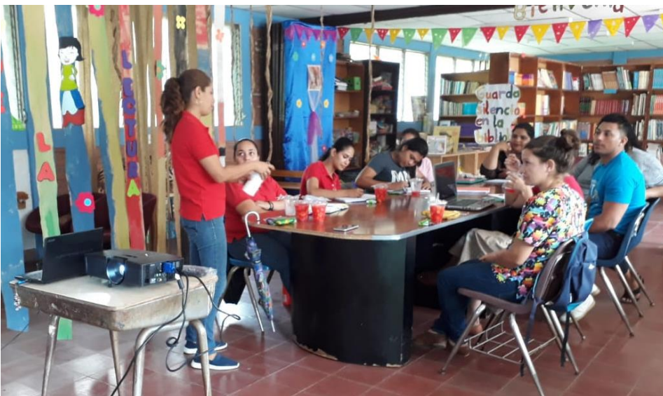
Ilustración 1 Capacitaciones sobre la metodología de enseñanza abierta