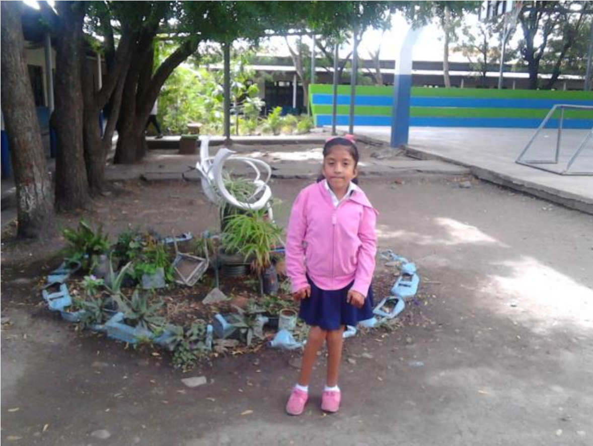
Niña con Deficiencia Motriz Leve incluida en la clase de Educación Física.