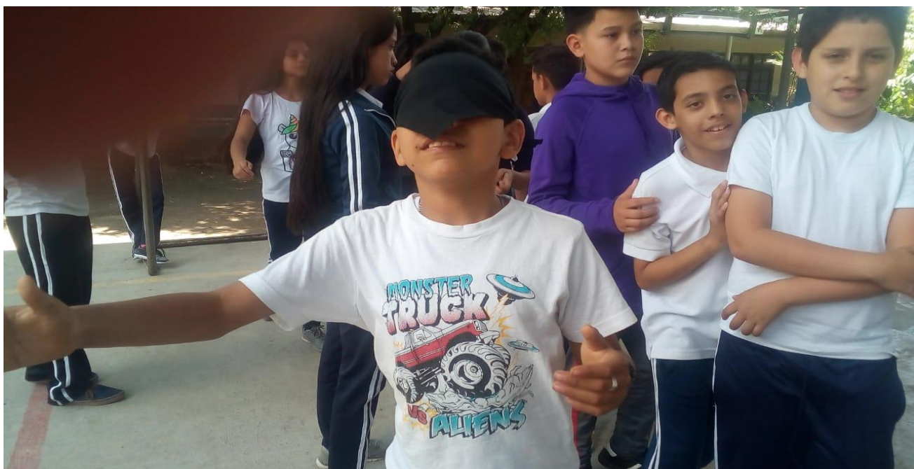
Niños integrados a Educación física.