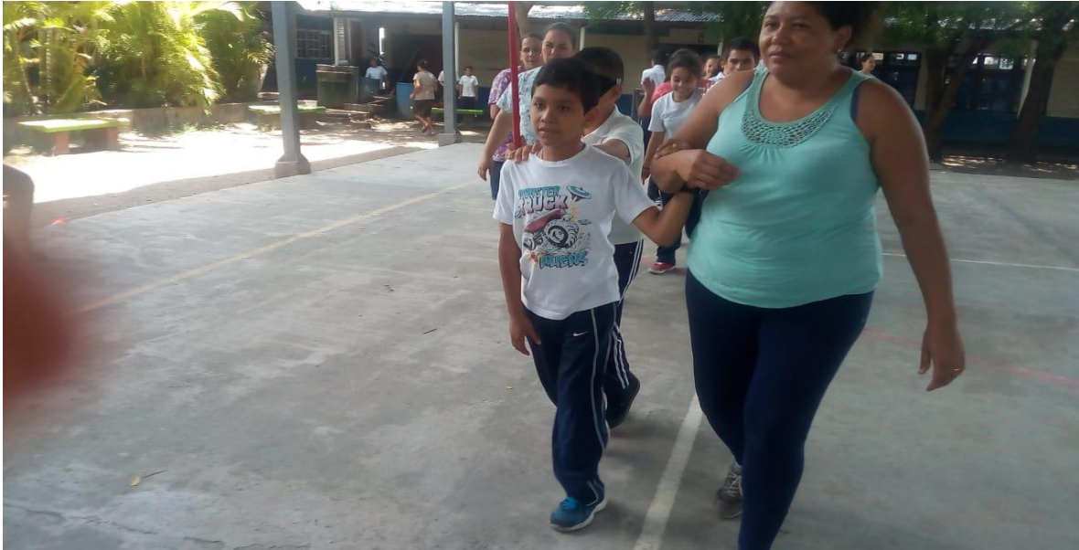
Apoyo brindado a los niños, niñas durante la clase.