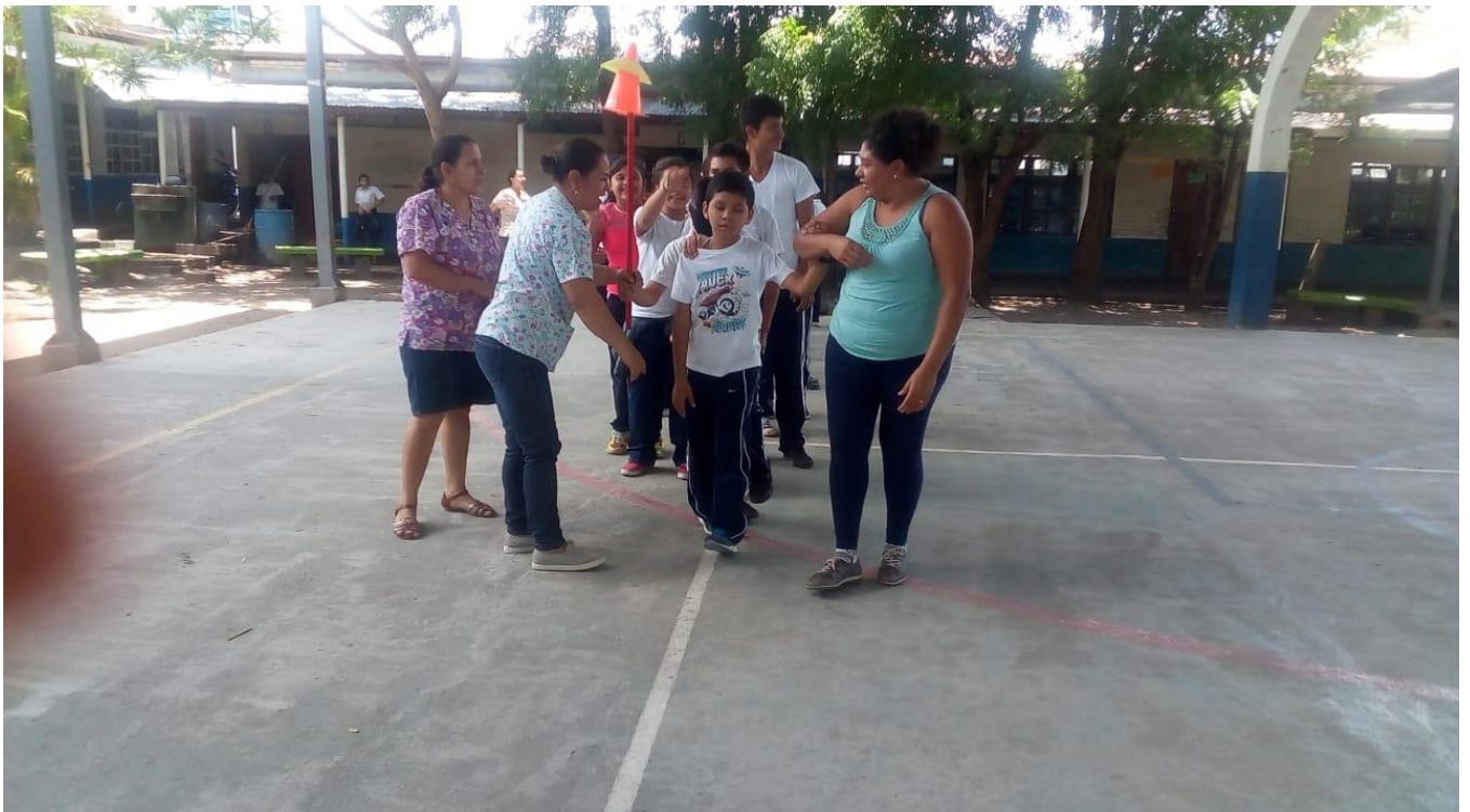
Apoyo brindado por todos los docentes durante la clase de Educación Física.