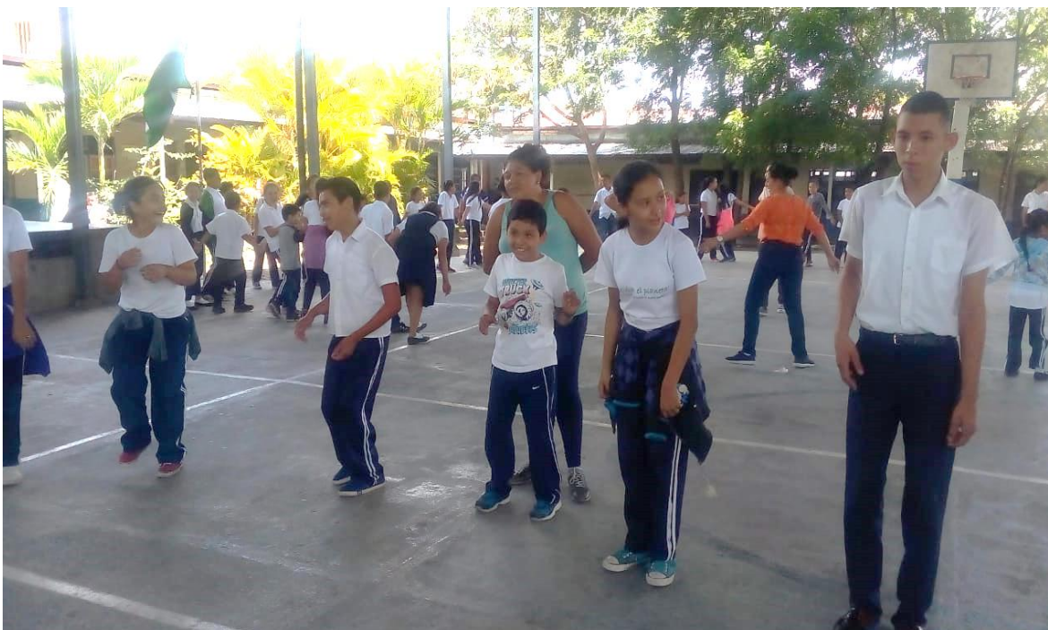
Niños, niñas realizando ejercicios de calentamiento.