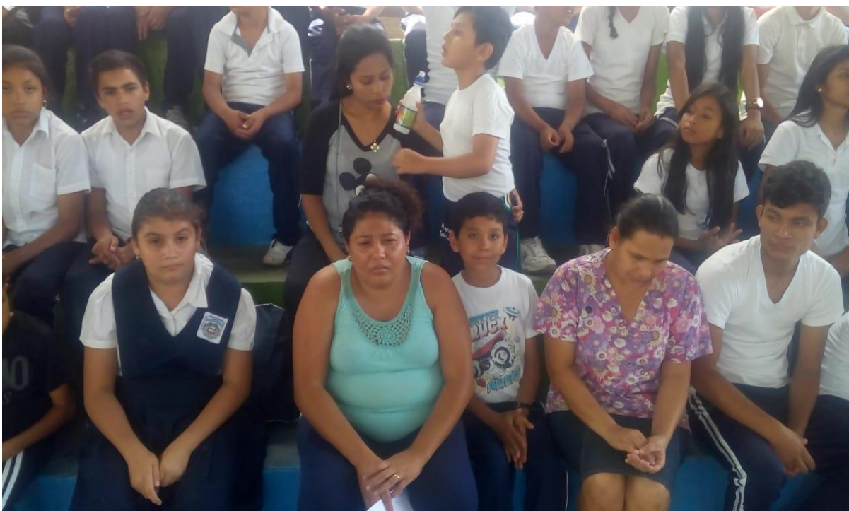
Madres de Familia acompañando a los niños, niñas en la clase de Educación Física.