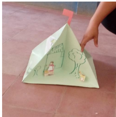
Estrategias para el afianzamiento de la lectoescritura con el Cuentorama.