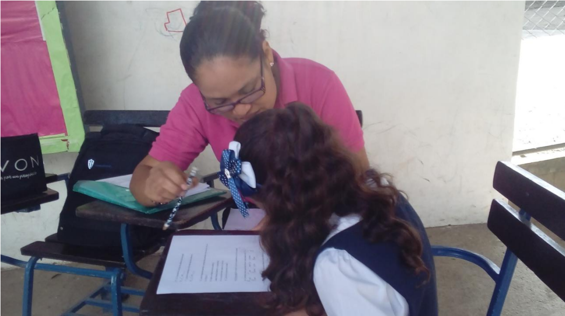
Observación a estudiantes de segundo grado