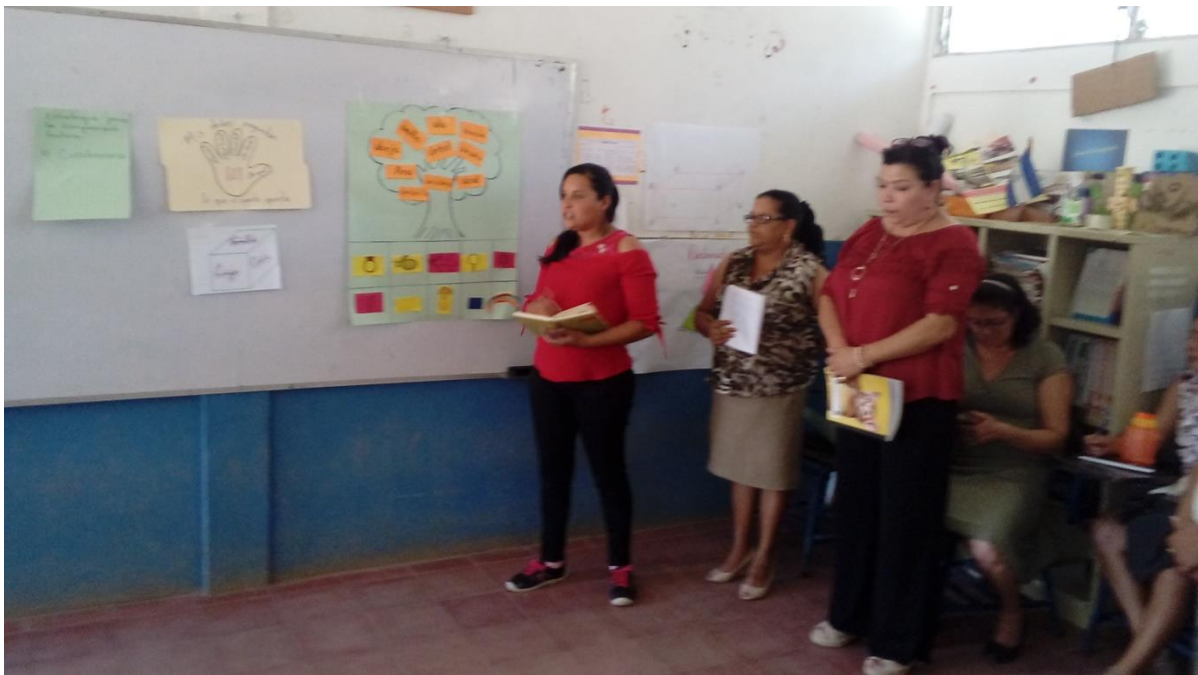
Maestras del centro escolar Enmanuel Mongalo participando en Círculo Pedagógico