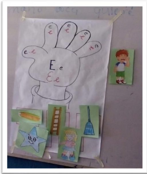
Estrategias para el afianzamiento de las vocales