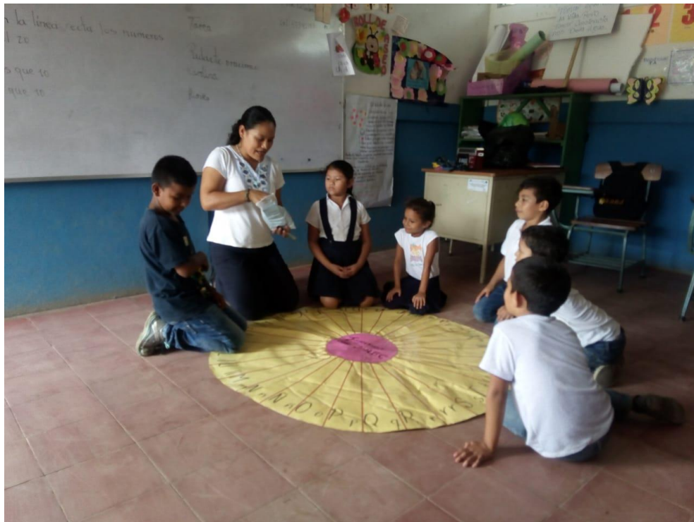
Aplicación de la estrategia Juego del ABC a estudiantes de segundo grado