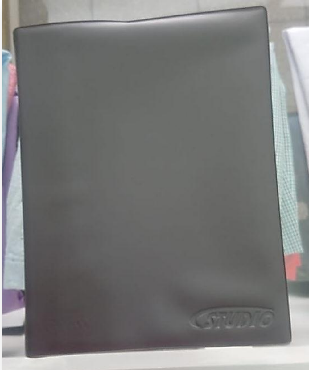
Imagen No 1. Cuaderno en el que lleva el registro de la tienda.