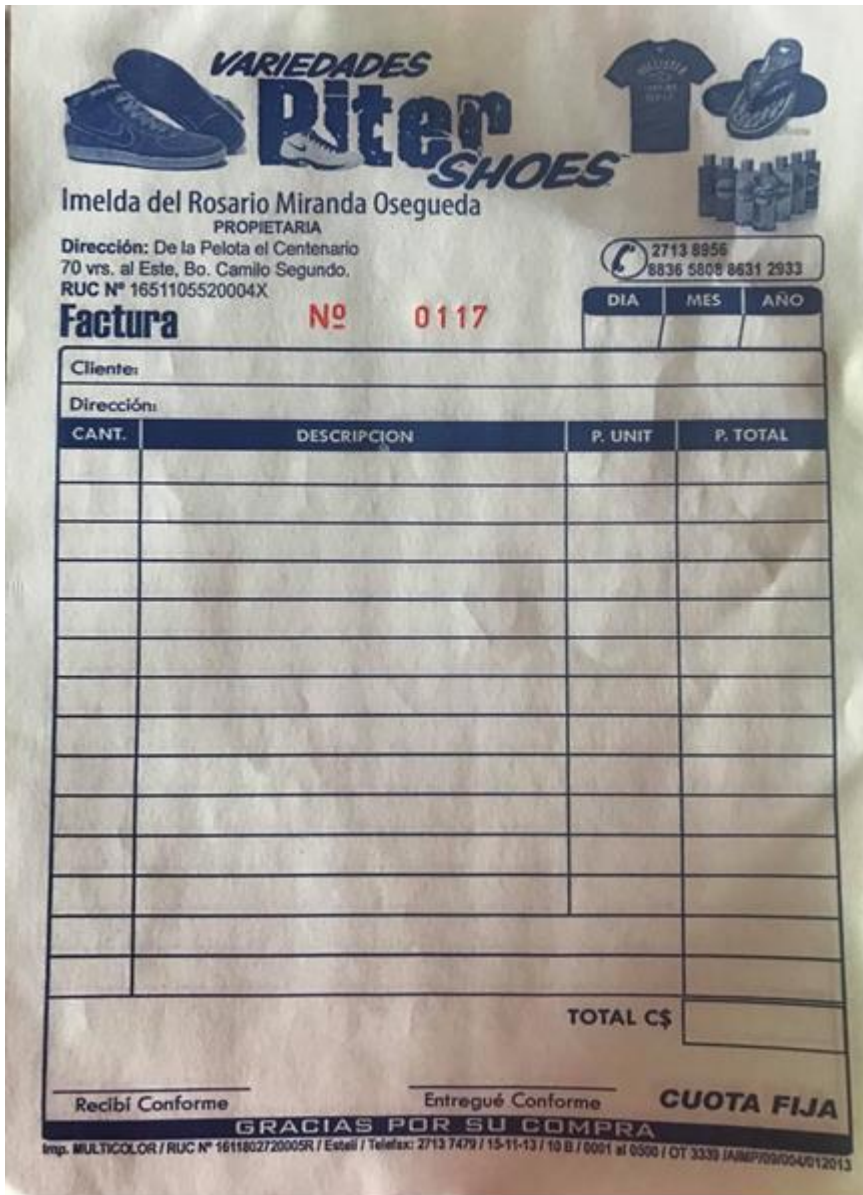
Factura, Anexo 1