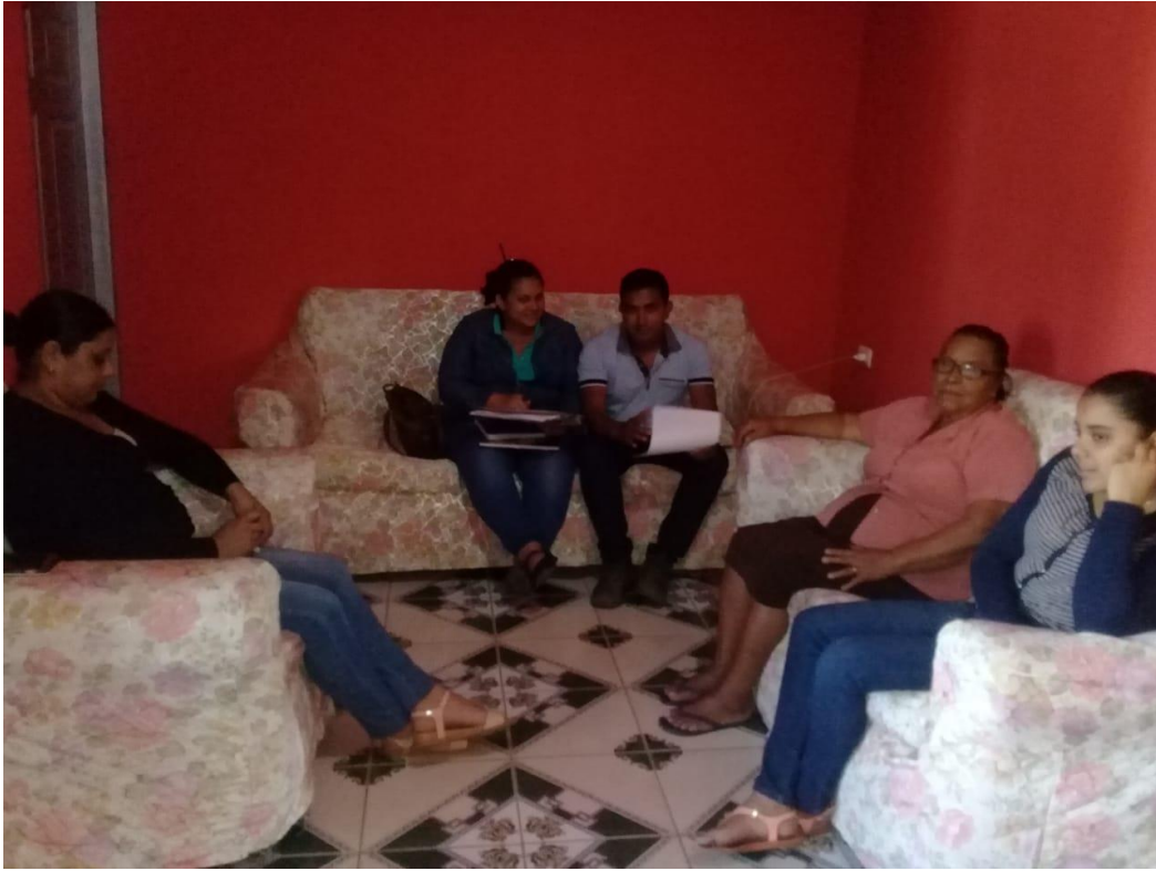
Aplicando grupo focal