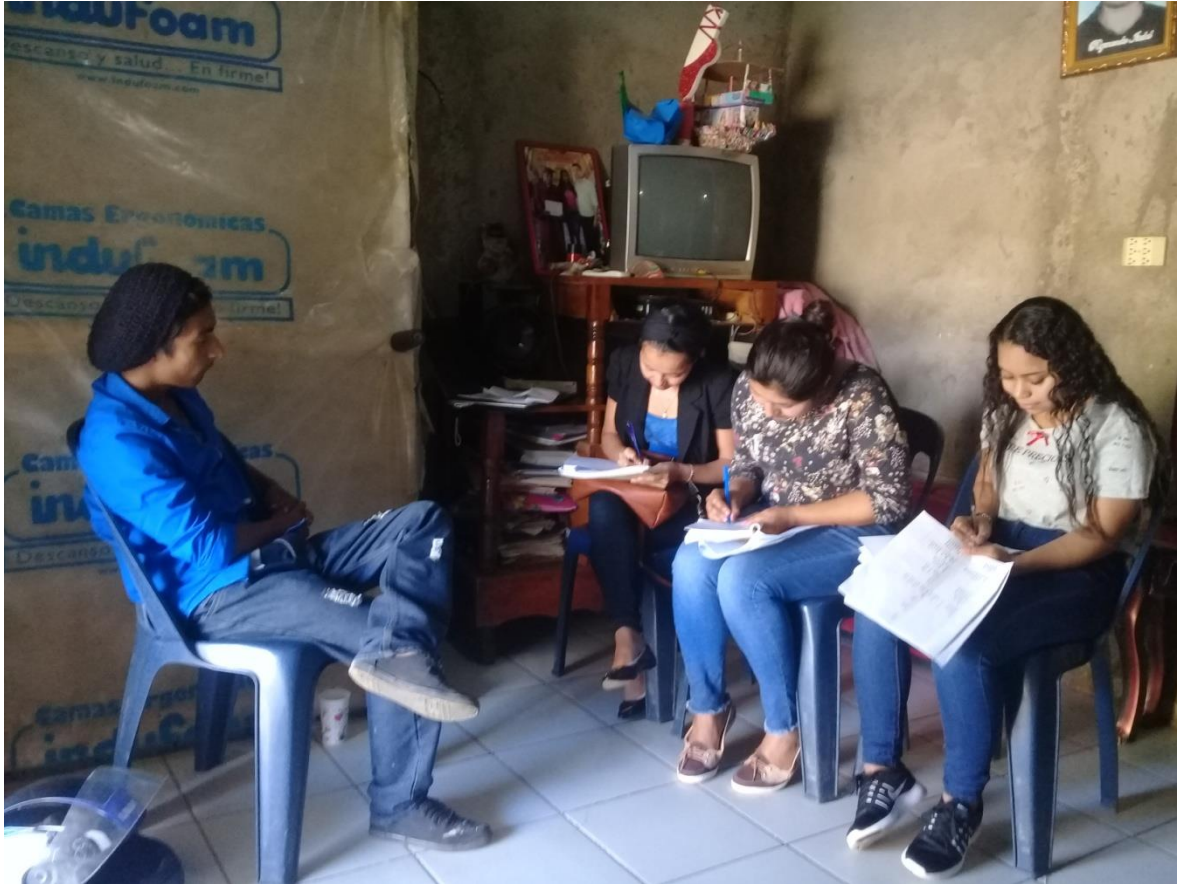
Fotografía 1, Barrio las Grietas, Estudiantes de Ciencias Sociales entrevistando a Joven rehabilitado.