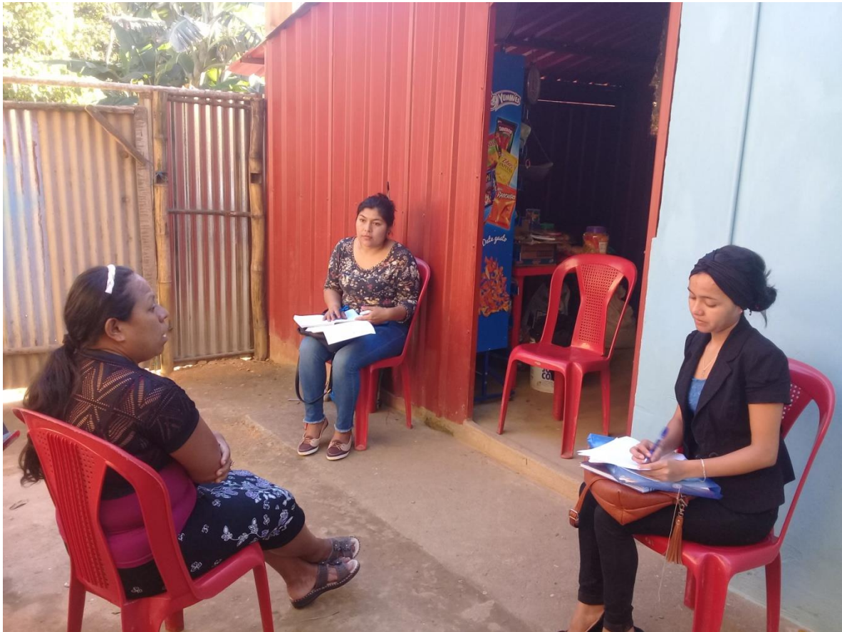
Fotografía 5, Barrio las Grietas, Estudiantes de Ciencias Sociales aplicando cuestionario a familiares de joven rehabilitado.