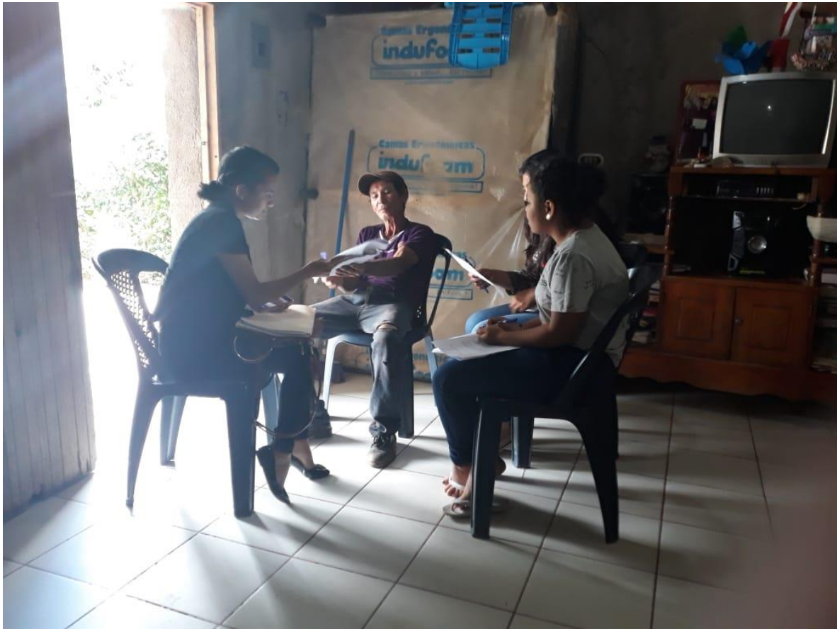
Fotografía 4, Barrio las Grietas, Estudiantes de Ciencias Sociales aplicando cuestionario a padre de joven rehabilitado.