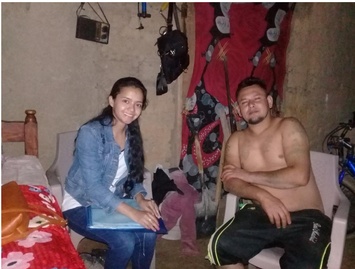
Fotografía 3, Barrio las Grietas, Estudiante de Ciencias sociales entrevistando a Joven rehabilitado.