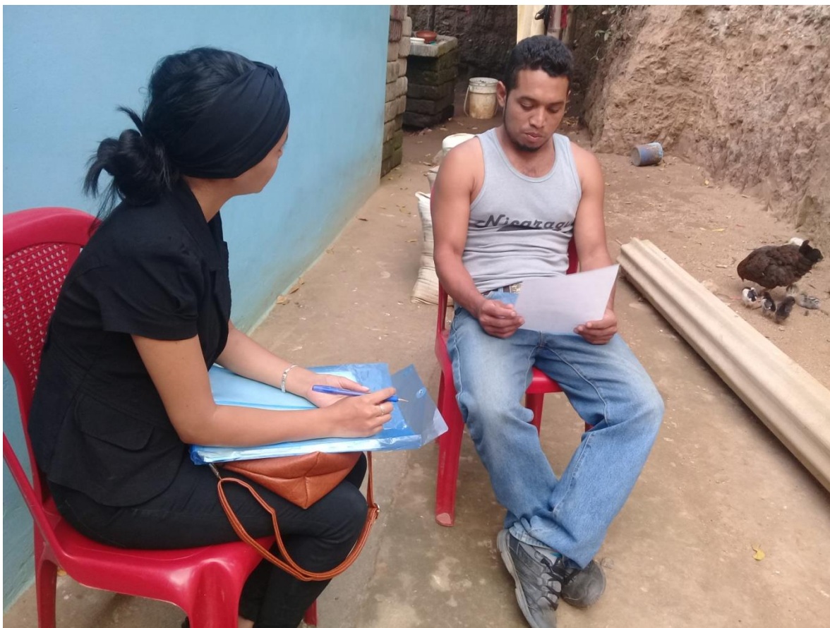
Fotografía 2, Barrio las Grietas, Estudiante de Ciencias Sociales entrevistando a Joven rehabilitado.