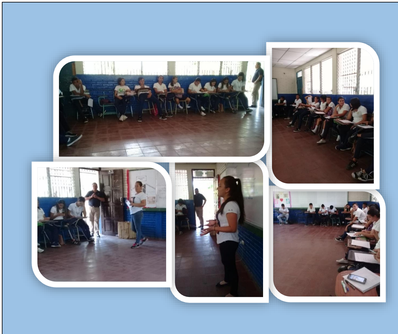
Collage 1: muestra la primera aproximación a la temática al grupo en estudio.