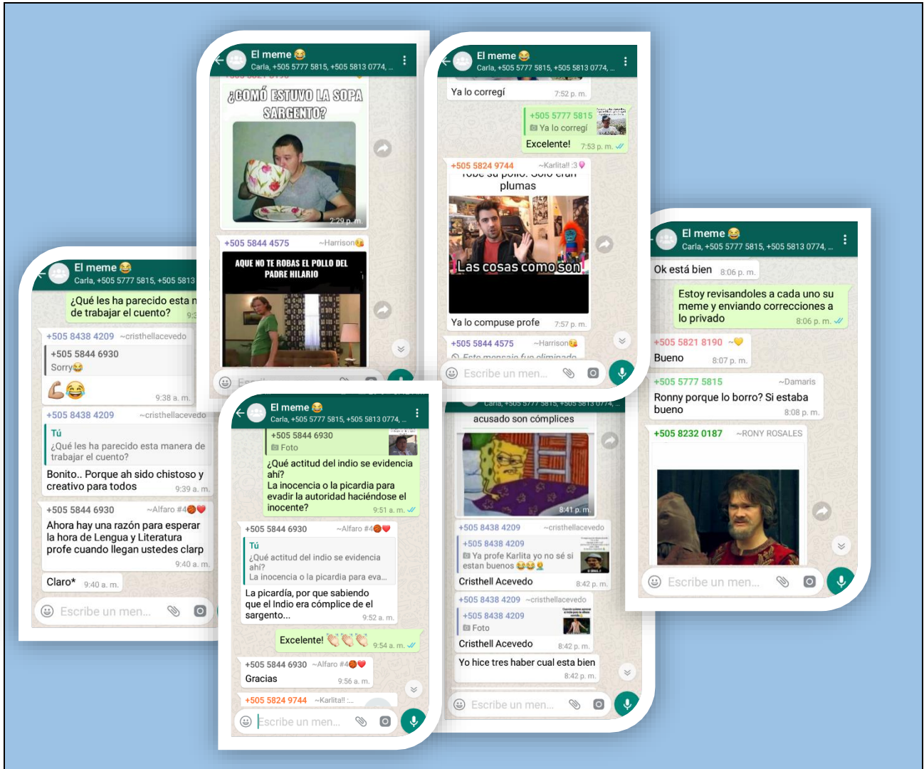
Collage 5: reúne las evidencias de la interacción mediante WhatsApp, los estudiantes compartieron sus memes para realizar correcciones ortográficas.