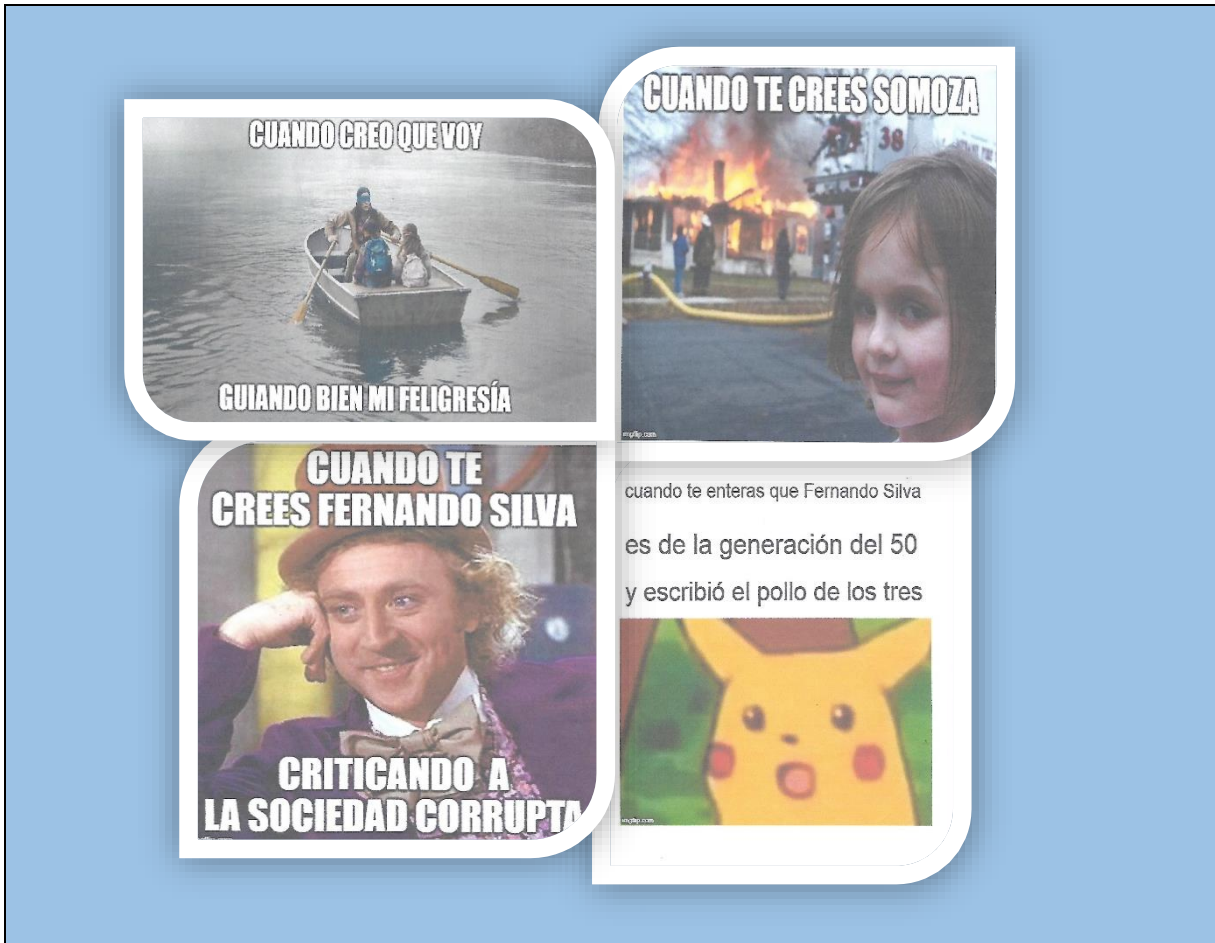
Collage 7: evidencias de los materiales didácticos presentados a los estudiantes en la clase.