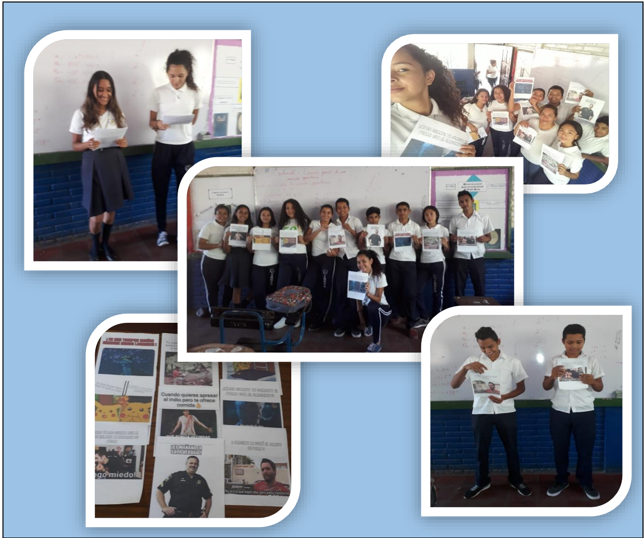
Collage 6: evidencia la exposición de producciones y posterior validación de la estrategia con grupos focales.