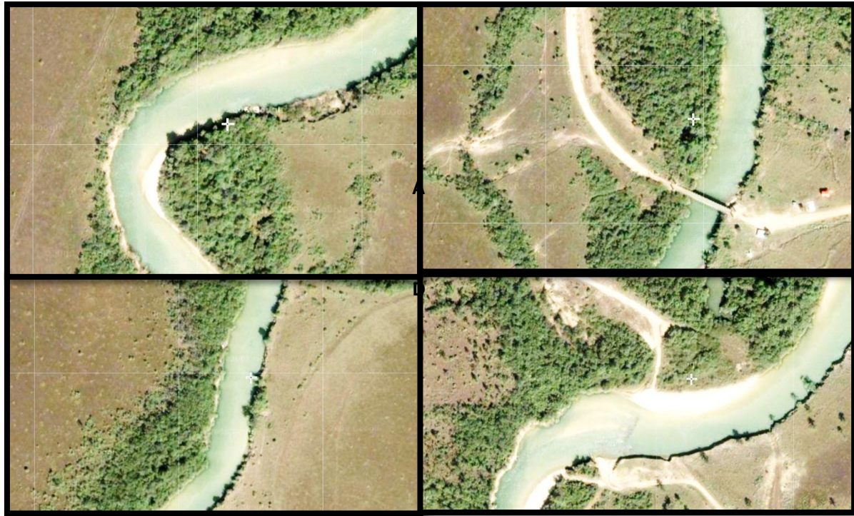
Figura 4. Elementos de la hidrogeomorfología y cobertura vegetal afectada en el Río Likus, Fuente: imagen modificada de Hansen / UMD / Google/ USGS / NASA.

Las proximidades al poblado de Sisin (cercano a las obras de captación de agua del proyecto) fueron identificadas como las partes críticas del sistema fluvial en donde se observaron las mayores amenazas, tales como la ausencia de vegetación ribereña, incremento de escorrentía debido a la urbanización de zonas aledañas, movilidad y transporte de sedimentos alterados por los puentes, estructuras de captación de agua y vados para el cruce de vehículos durante la época seca. La falta de alcantarillado sanitario también representa un riesgo de contaminación bacteriológica en las proximidades de las obras de captación, sobre todo tomando en cuenta que los volúmenes de aguas residuales irán aumentando con el crecimiento poblacional.