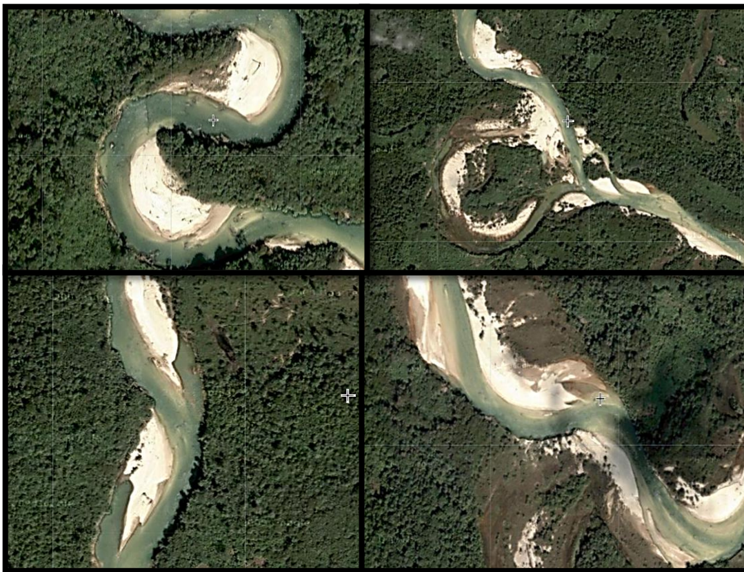
Figura 3. Elementos de la hidrogeomorfología y cobertura vegetal natural en el Río Likus, Fuente: modified Hansen / UMD / Google/ USGS / NASA image.