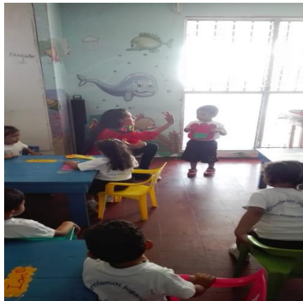
La maestra pasándolos a exponer sus materiales y felicitándoles con el chócala.