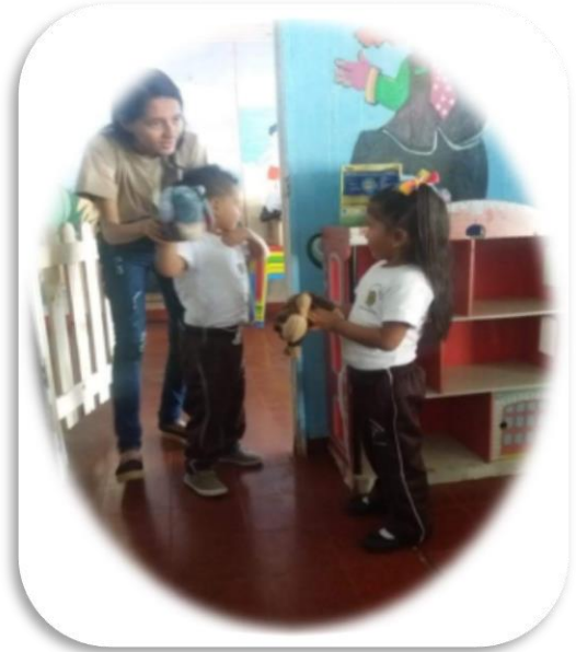
Otros se percibían un tanto tímidos, sin ánimos de realizar la actividad.