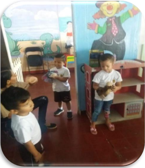
Los niños usando los títeres para presentarse y saludar. Algunos se mostraron motivados.