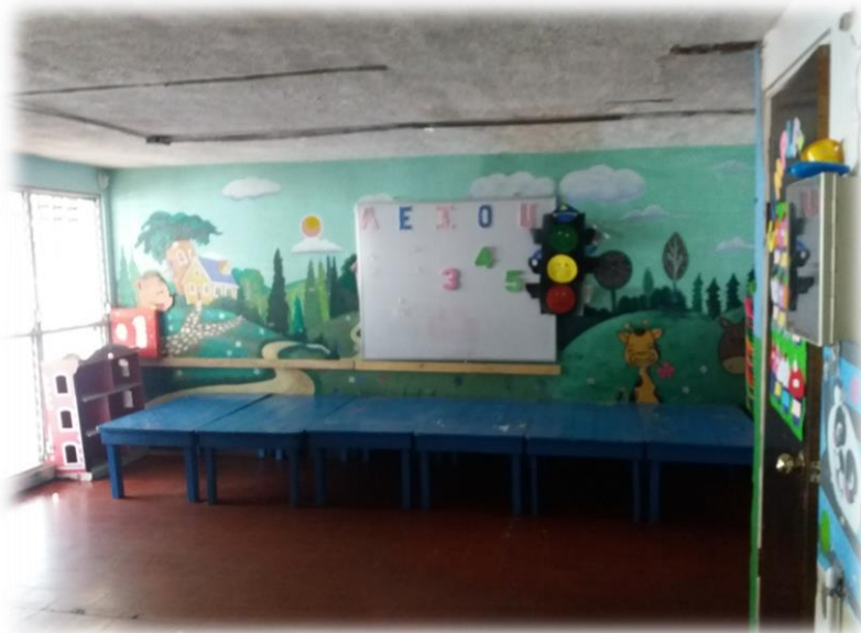
Aula de I nivel