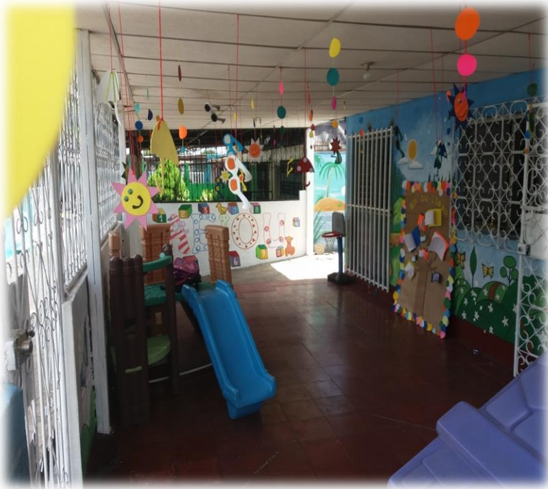
Área de juego