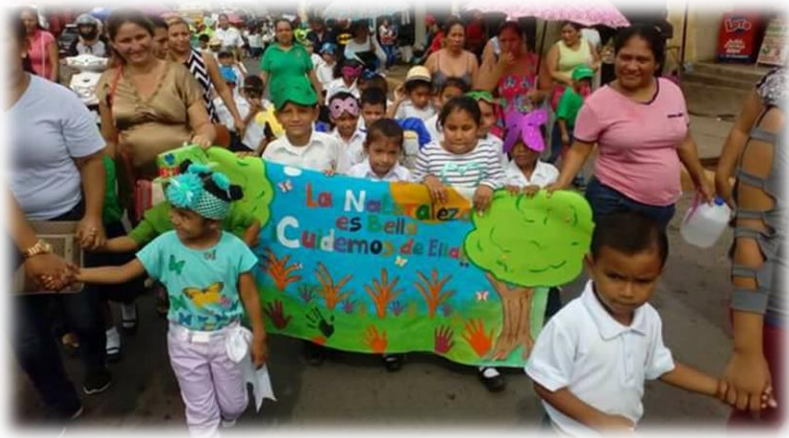
Día del medio ambiente