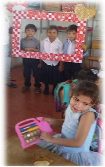
Día de la mujer