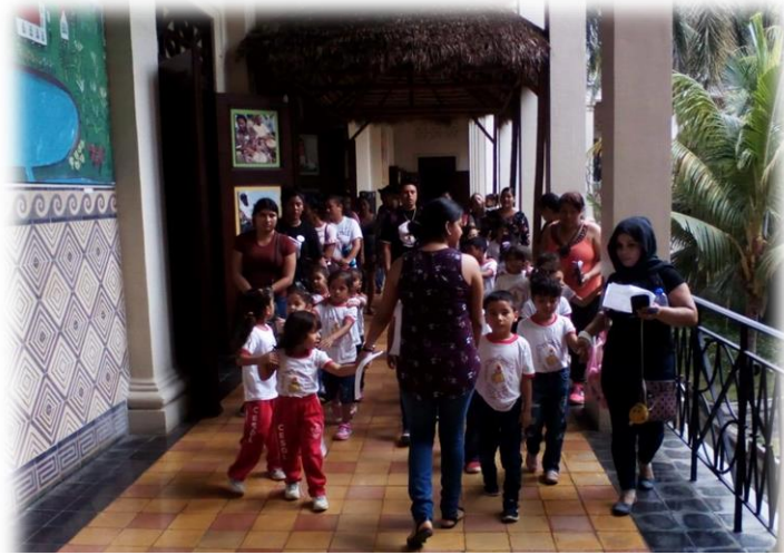
Paseo al palacio