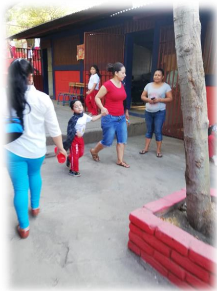
Entrada al colegio