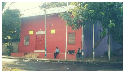
Figura 7. Casa comunal de Esquipulas en donde inició el CEDA

niños en el turno vespertino, y el ciclo básico en el turno nocturno exclusivamente para personas trabajadoras de la comunidad, para entonces las instalaciones se ubicaron provisionalmente en la que fue la casa comunal de la comunidad durante muchos años. Nohemí Herrera (2018), quien fue estudiante en el CEDA, recuerda que en la casa comunal