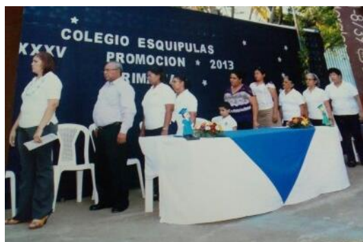
Figura 17. Promoción de Primaria 2013 dirigida por el Director “Tito”