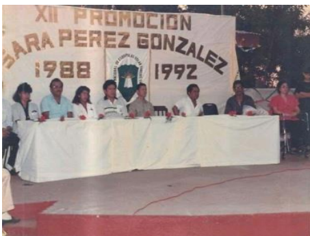
Figura 30. Promoción generación 1988-1992