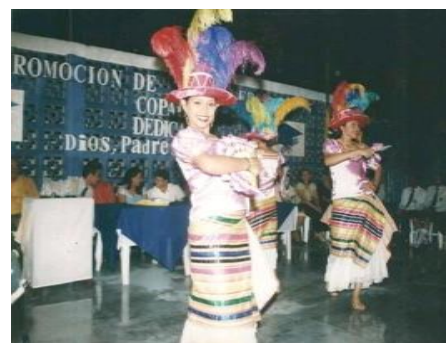
Figura 33. Promoción primaria COPADE