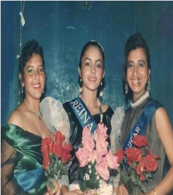
Figura 52. Reinas del colegio.