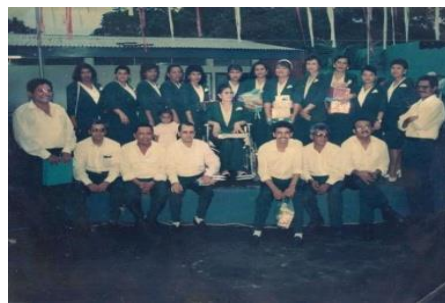
Figura 31. Docentes del colegio Esquipulas.