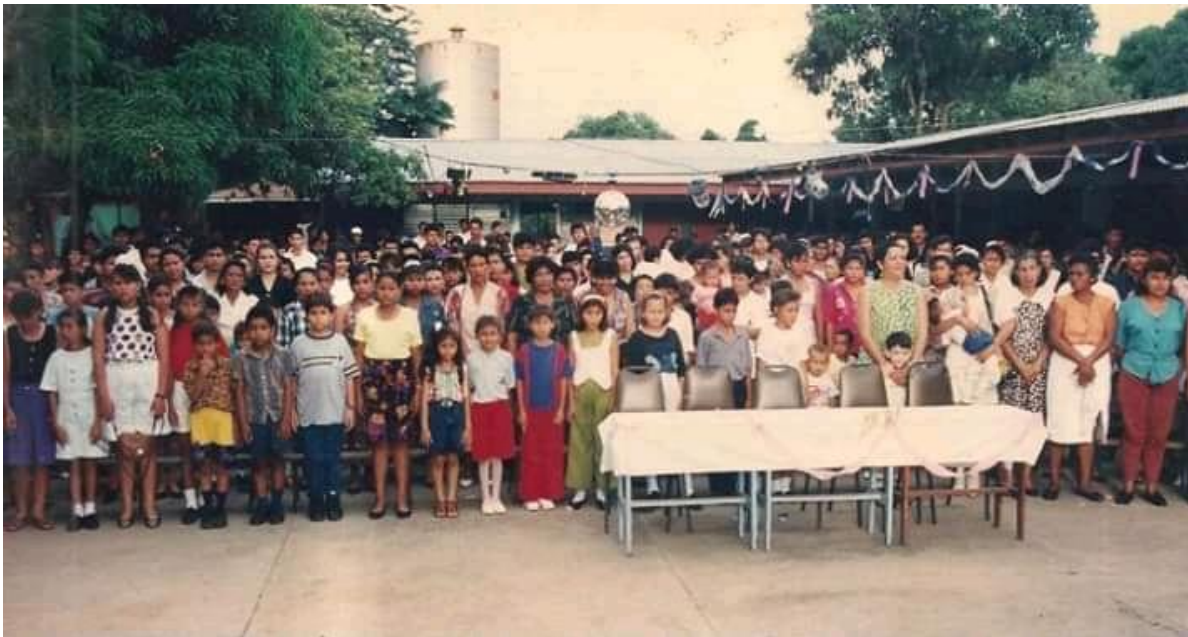
Figura 47. Himno nacional en día de las madres.