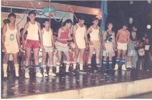
Figura 54. Candidatas a reyes