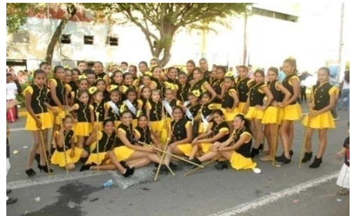
Figura 40. Gimnastas rítmicas