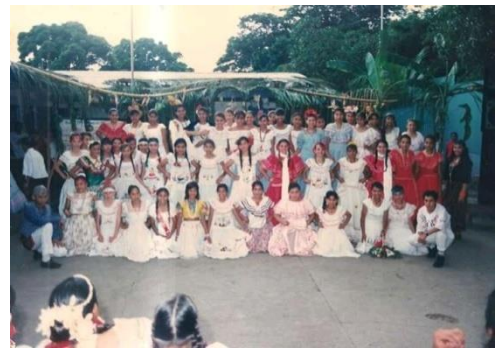
Figura 59. Claustro artistico