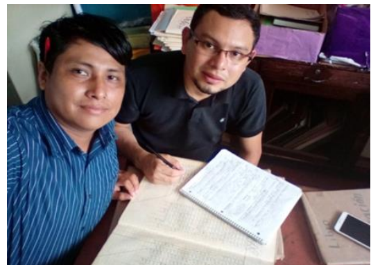
Figura No. 1. Revisión documental a libros de actas del Colegio

La investigación documental es una de principales forma de técnicas de investigación que se usa en este trabajo, ya que para fundamentar teóricamente todos los elementos que compone dicho trabajo, tuvieron que ser en su momento objeto de estudio científico por otros autores que publicaron sus conclusiones y hallazgos científicos.