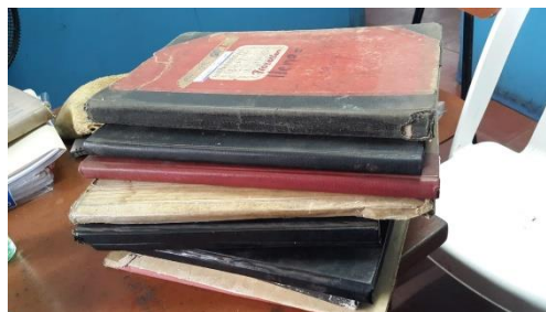
Figura No. 3. Realización de anotaciones de los libros de notas del Colegio

El Diario de Campo es uno de los instrumentos que día a día nos permite sistematizar las prácticas investigativas; además, permite mejorarlas, enriquecerlas y transformarlas.