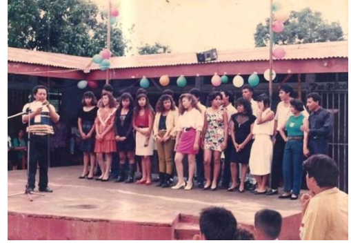
Figura 55. Candidatas a reinas