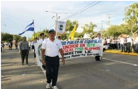
Figura 39. Desfile patrio