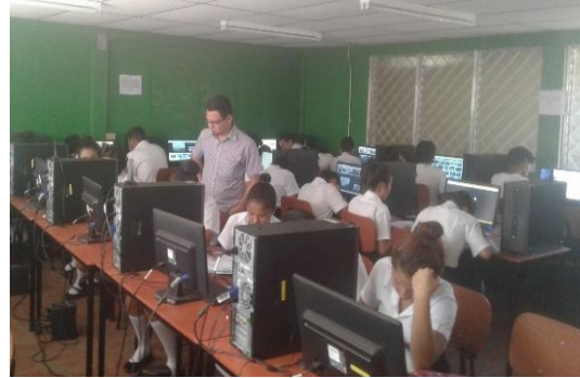
Figura 11. Aula TIC del Colegio Público de Esquipulas.