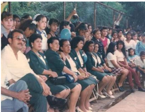
Figura 35. Grupo maestros años 90.