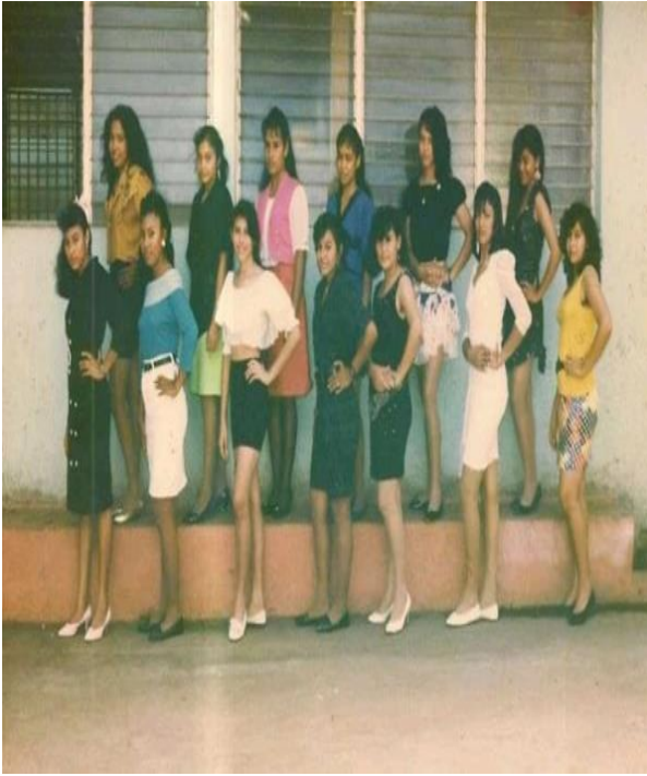
Figura 50. Candidatas a reinas.