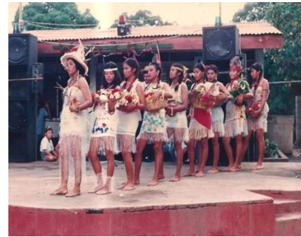
Figura 46. Presentación artística