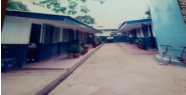
Figura 19. Perfil del Colegio Público de Esquipulas hacia inicio del 2000