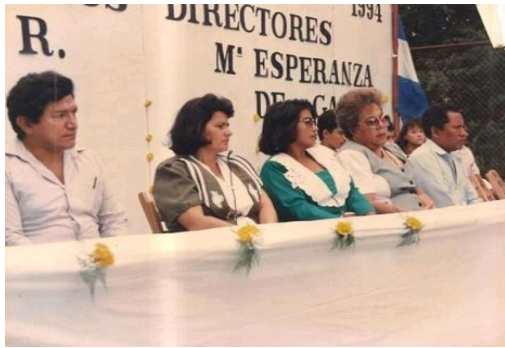
Figura 63. Promoción 1994.