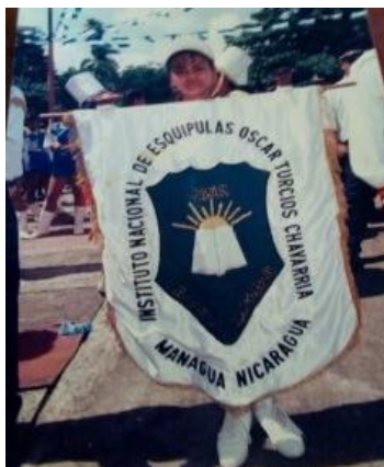
Figura 14. Estandarte del Colegio correspondiente al año de 1990

La construcción de este apartado iconográfico de la historia del Colegio Público de Esquipulas se llevó a cabo gracias a los aportes de estudiantes egresados, estudiantes activos, directores y docentes activos y jubilados, quienes proporcionaron fotografías de los momentos históricos más significativos que ha tenido este centro escolar en toda su historia. A continuación, se presentan los resultados.