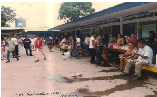
Figura 67. Kermis en la autonomía