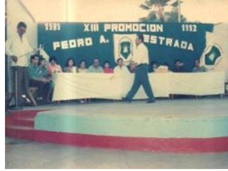
Figura 25. Promoción de 1992