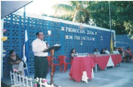
Figura 28. X promoción de preescolar