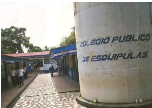
Figura 65. Tanque del colegio.