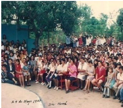
Figura 45. Día de las madres