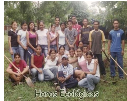
Figura 44. Obras ecológicas en la autonomía