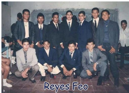
Figura 58. Reyes feos