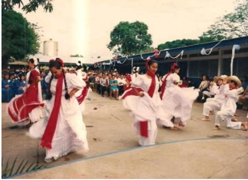
Figura 60. Presentaciones artísticas.