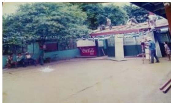
Figura 8. Pobladores colaboran en la construcción del colegio