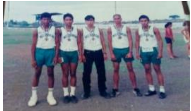
Figura 21. Estudiantes en actividades deportivas en los años 90.