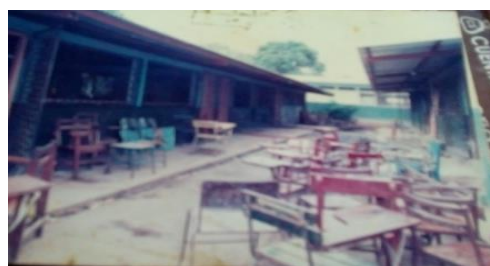
Figura 18. Perfil del Colegio Público de Esquipulas hacia la década del 90’