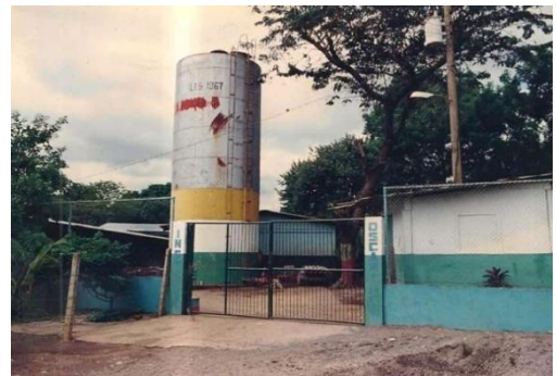
Figura 66. Entrada del colegio y tanque del colegio.