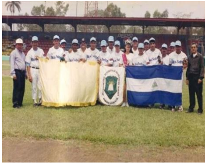
Figura 43. Equipo de beisbol