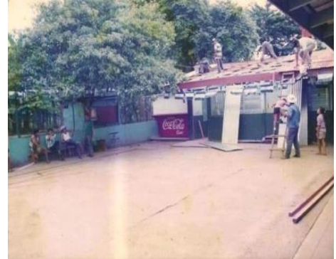
Figura 61. Reparación colegio Esquipulas