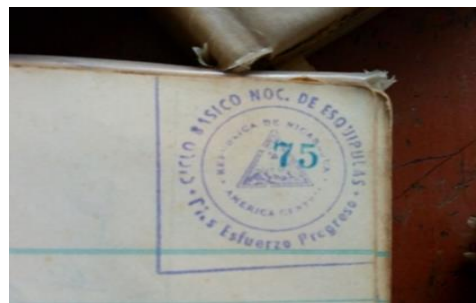
Figura No. 4. Fotografía del primer sello del Colegio

Las cámaras digitales permitían capturar fotografías de las entrevistas y a los entrevistados, así mismo permiten fotografiar infraestructura y documentación y documentalista. Las fotografías tienen como fin atestiguar la veracidad de las entrevistas, ya que son una parte fundamental de los anexos y de la recopilación de la información. Según Martínez (2007)