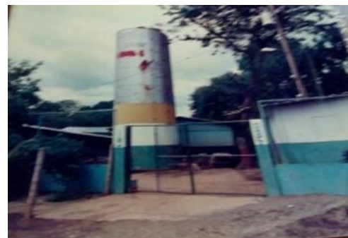
Figura 23. El tanque del Colegio que abastecía de agua potable a la comunidad de Esquipulas