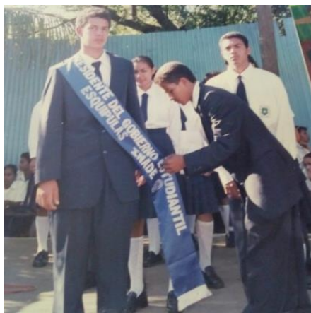
Figura 15. de fiestas patrias, haciendo gala el presidente del gobierno estudiantil