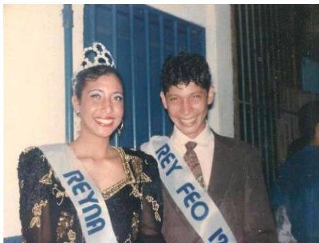
Figura 56. Rey y Reyna del colegio