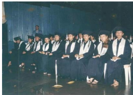
Figura 29. Promoción en horas de la tarde