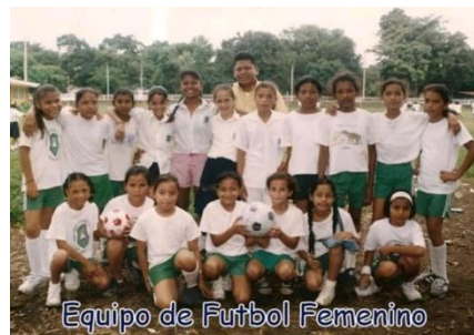
Figura 42. Equipo deportivo