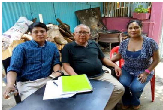
Figura No. 2. Entrevista a ex director del Colegio

La entrevista en profundidad se centra en lo particular del individuo y en lo específico de una investigación. Por lo tanto, a través de entrevistas semi-estructuradas se indaga en las percepciones y observaciones humanas que conformarían una gama de conocimientos recabados de los cuales se extraerán elementos informativos cruciales en la investigación del que busca conocer.