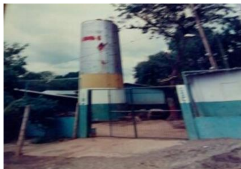
Figura No. 9. El tanque del Colegio que abastecía de agua potable a la comunidad de Esquipulas