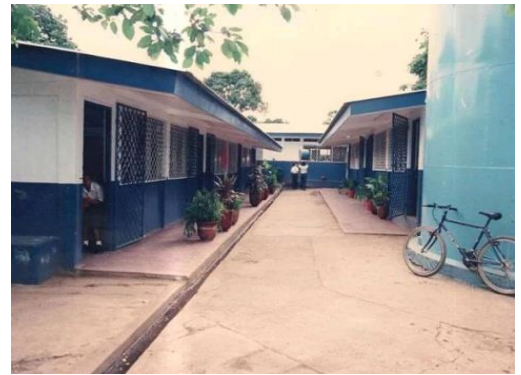
Figura 64. Entrada principal del colegio.