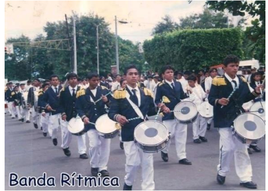
Figura 38. Banda rítmica.