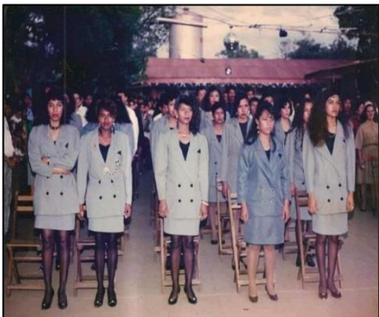
Figura 32. Bachillerato en los años 90