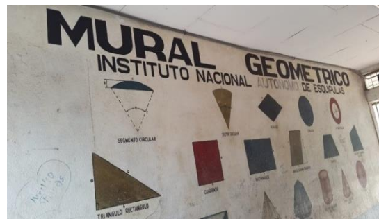
Figura 12. Mural del colegio correspondiente al año de 1997

Con el advenimiento de los gobiernos neoliberales en 1990, los colegios también asumen nuevos nombres con el objetivo de borrar la memoria histórica de la revolución, pasando el colegio a adoptar primeramente el nombre de Instituto Autónomo Óscar Turcios