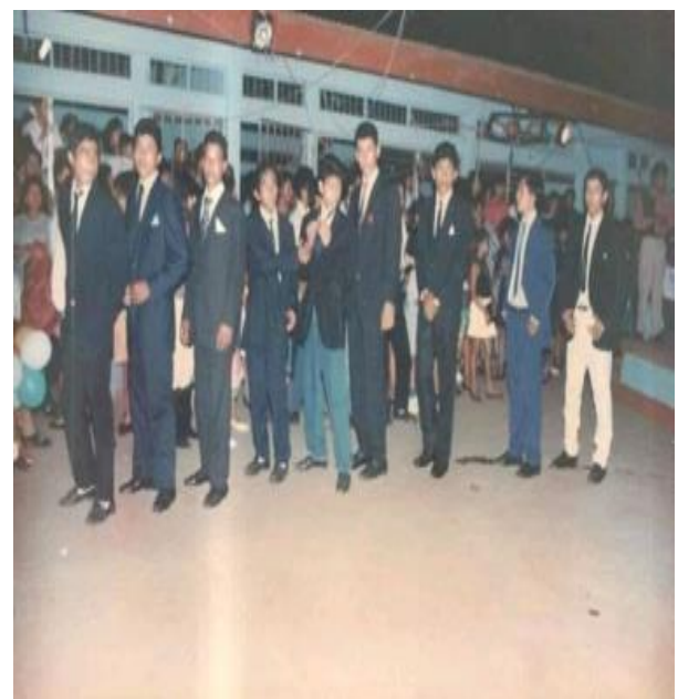
Figura 53. Candidatos a reyes