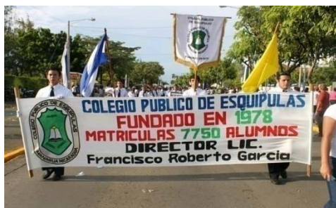
Figura 41. Desfile patrio