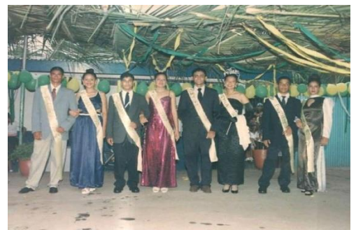
Figura 57. Reinados