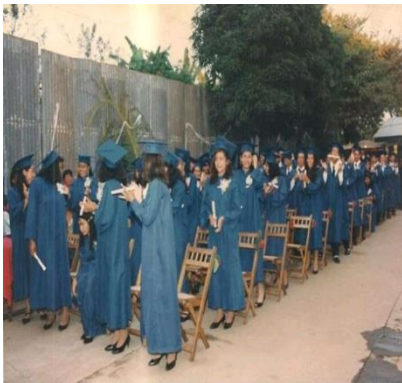
Figura 26. Bachillerato sin fecha exacta