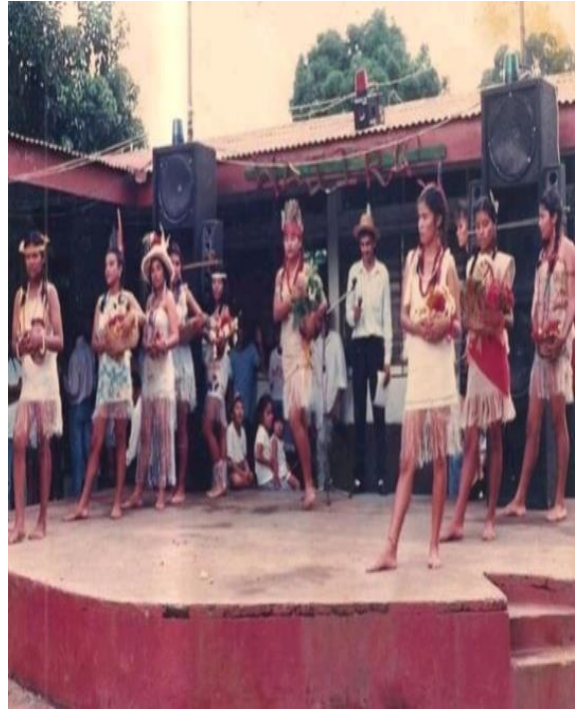
Figura 51. Reinado día de la raza.