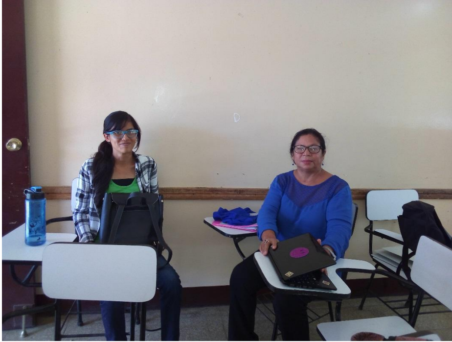
Estudiantes de la asignatura análisis musical.