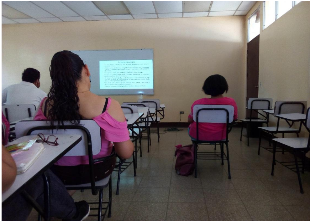
Estudiantes de la asignatura análisis musical.