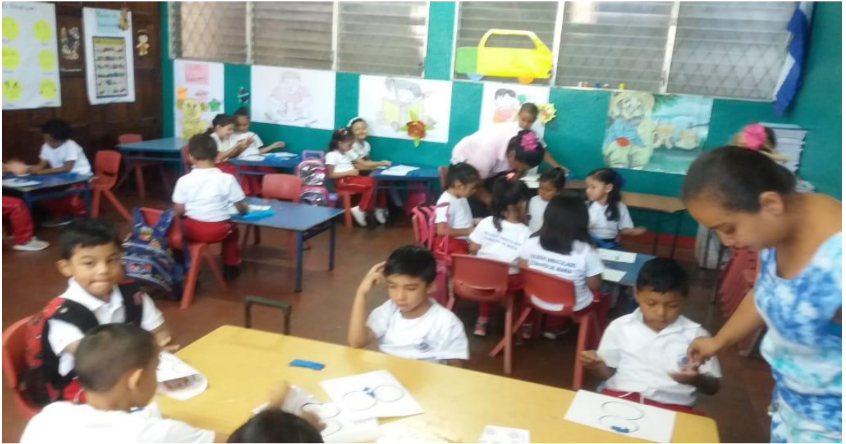
Ilustración 1 la maestra explica cómo realizar la hoja de aplicación