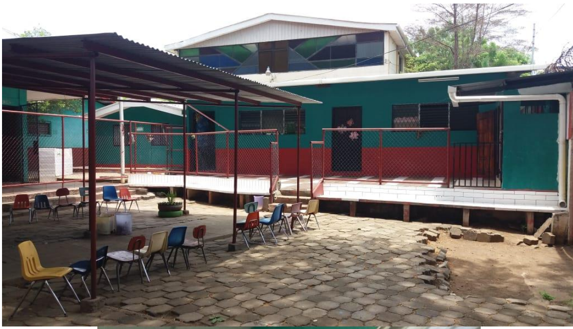
Ilustración 4 espacio de recreación