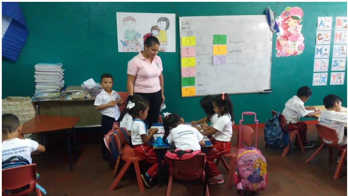
Ilustración 2 la investigadora observa el trabajo de los niños