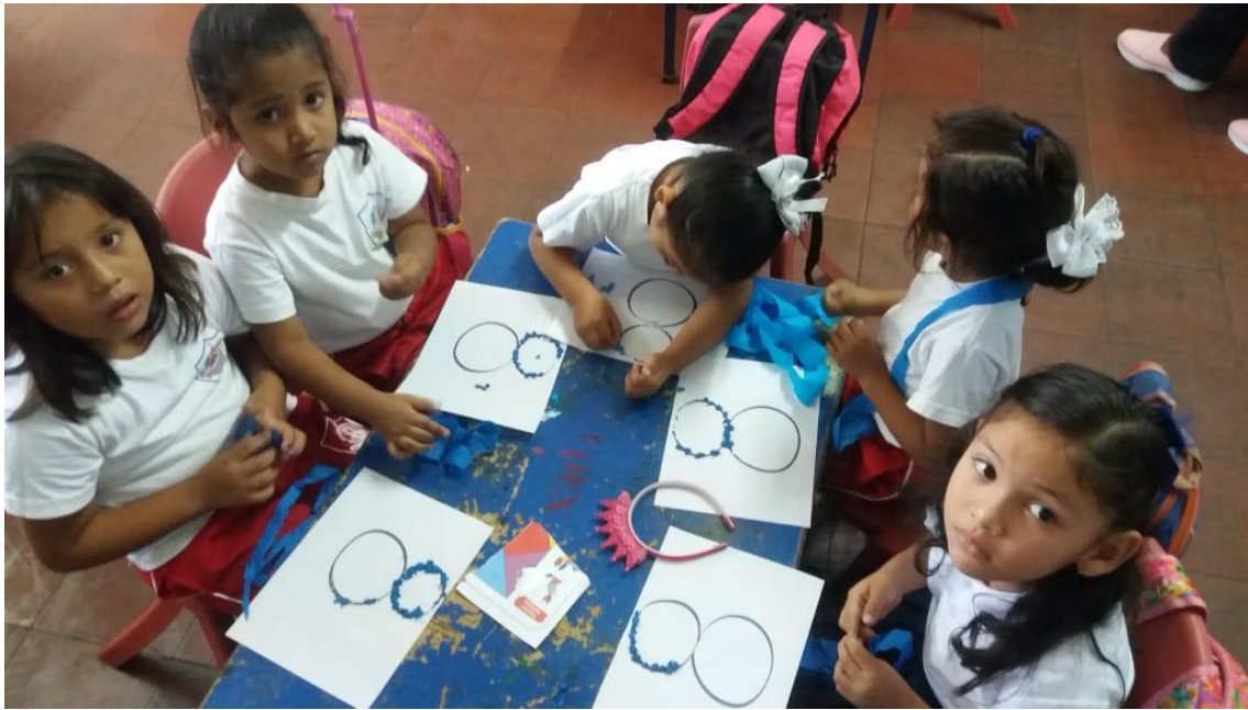
Ilustración 3 los niños realizando hojas de aplicación