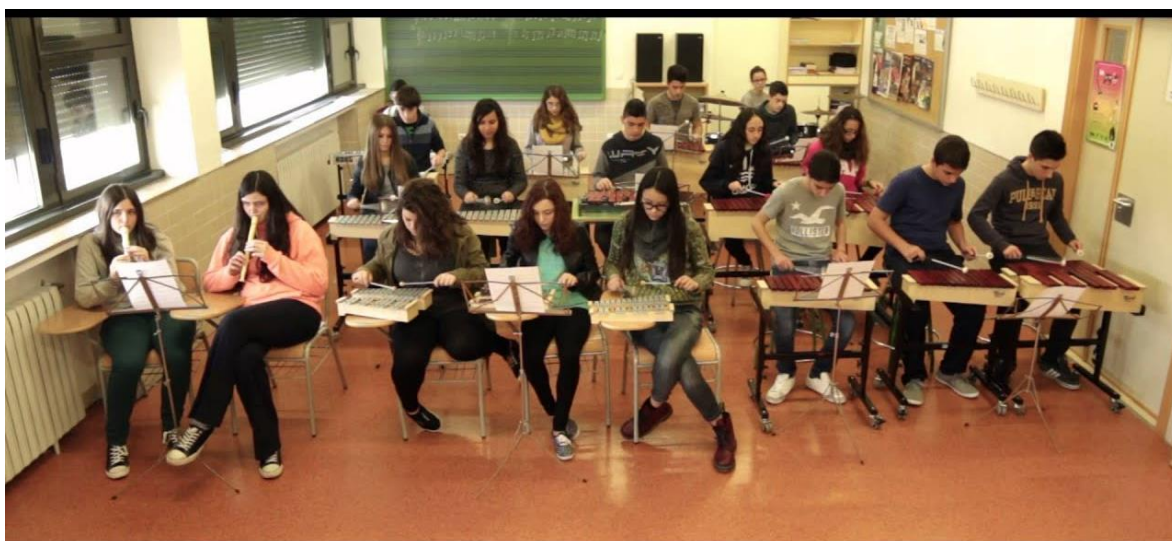
Educación Musical en Secundaria