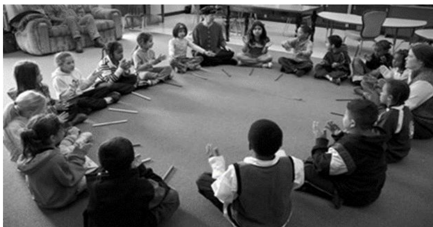
Alumnos, iniciación al Método Orrf