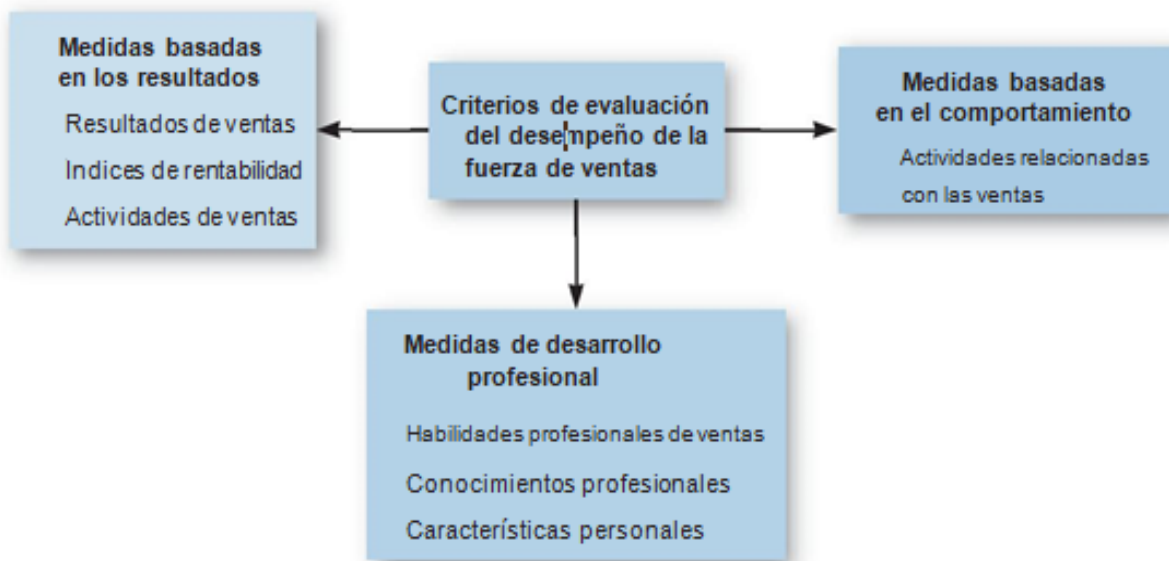
Figura 4.3. (Hair et al., 2010 p.429).