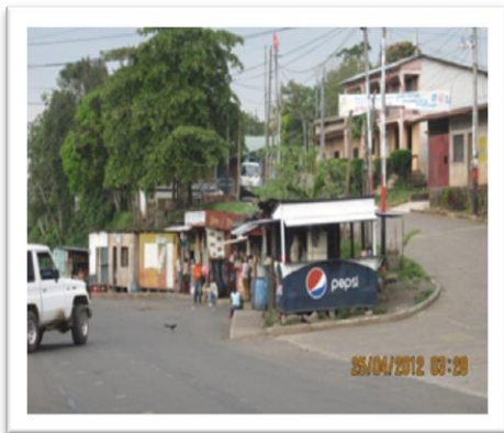
Bahía de La Gateada (25/02/2011)

A la comunidad se llega por transporte terrestre (bus o Vehículo particular). Una de las formas de llegar a la comunidad es ir al mercado Mayoreo ubicado en Managua y abordar el bus Managua-Rama, el cual hace una estación en la bahía de La Gateada que se ubica a 225Km de Managua o también se aborda el bus Managua-Nueva Guinea que lo deja en la bahía de La Gateada.