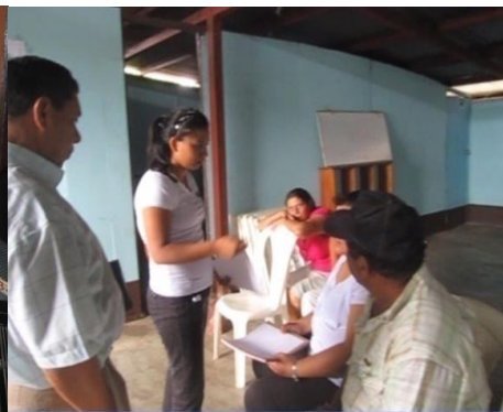
Taller de Validación 2012