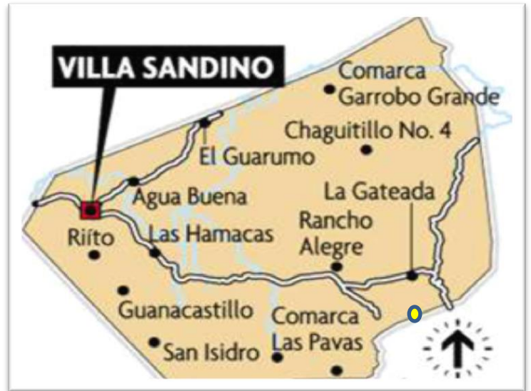
Mapa de la ubicación de la comunidad La Gateada (página web municipal de Villa Sandino) consultada el 20/02/2010)

Posee una extensión territorial de 4 kilómetros cuadrados; sus límites son al: Norte con la comarca La Chinela Sur con la comarca Las Pases Este con El Chilamate y al Oeste con la comarca de Rancho Alegre