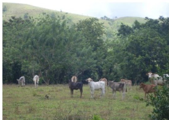
Ganado en encases de Pasto. (27/04/2011)

y estructurando el desarrollo de la comunidad, del municipio y del país mismo, basado fundamentalmente en el establecimiento de grandes haciendas en la zona. La actividad está sujeta a las políticas económicas del país y a las variaciones cíclicas de los precios en el mercado.