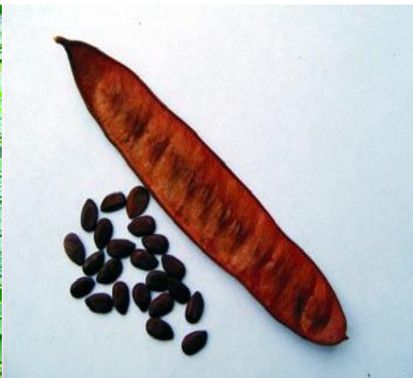
Vainilla y semilla