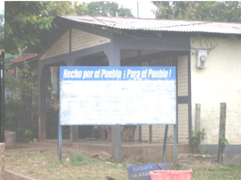
Ventanilla de la alcaldía