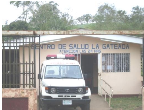
Centro de Salud