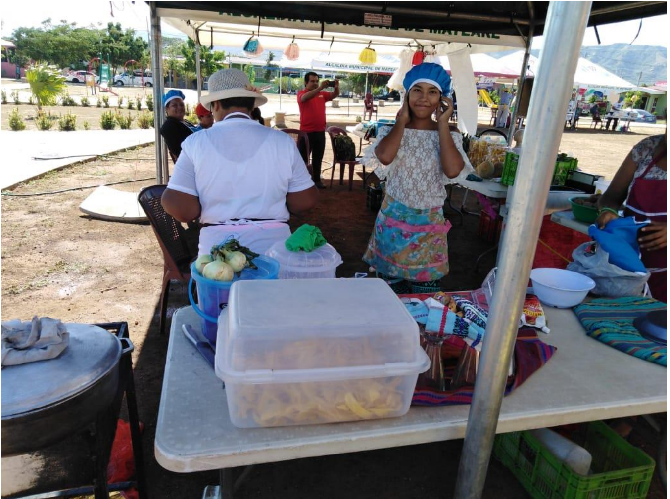
Fotografía. Cortesía del Ing. Romero / MEFCCA– Feria de Economía Familiar.