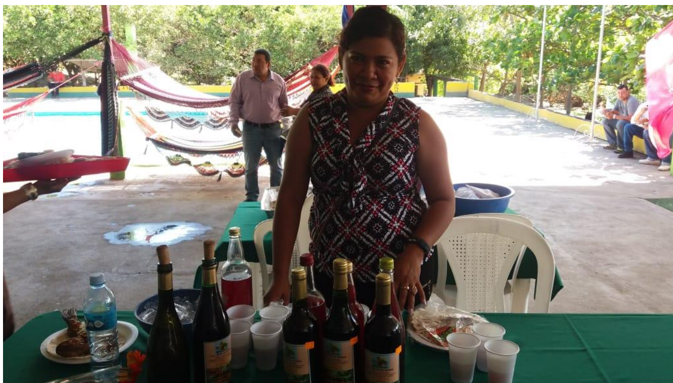
Lanzamiento Verano-Vino elaborado en Mateare.