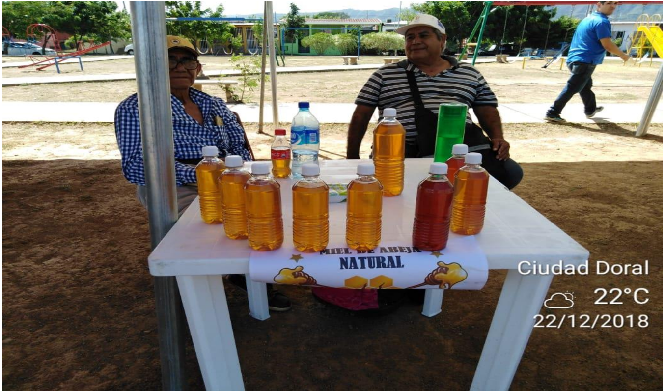
Fotografía. Cortesía del Ing. Romero/ MEFCCA – Feria de Economía Familiar.