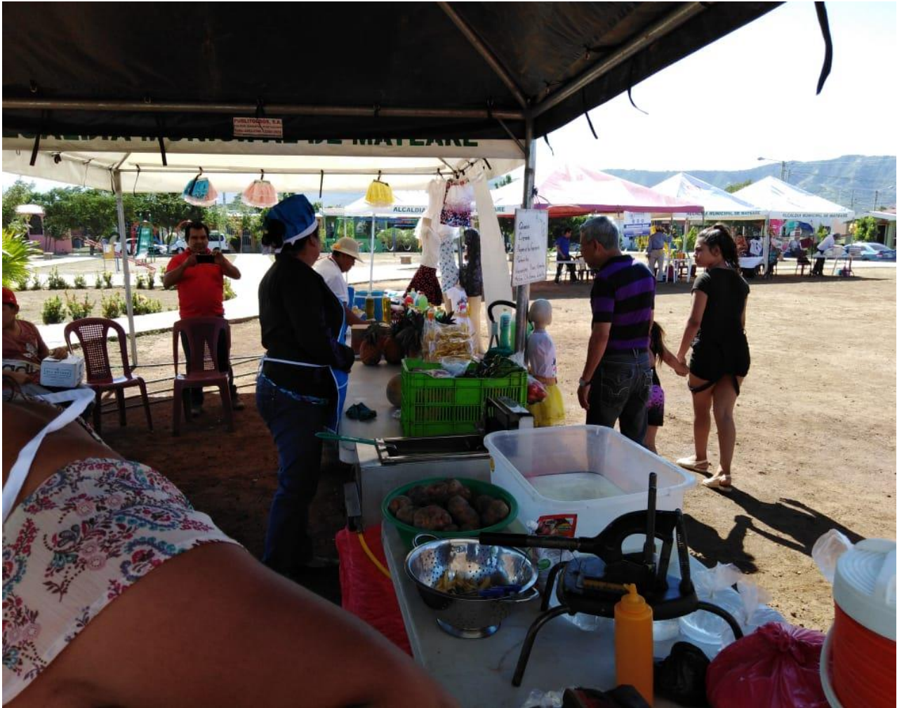
Fotografía. Cortesía del Ing. Romero / MEFCCA– Feria de Economía Familiar.