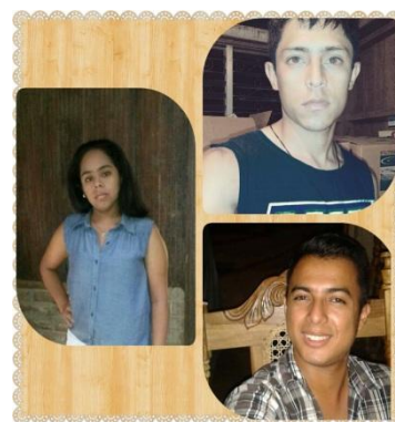
Jóvenes Representantes Voluntarios. 18/12/15

Se realizó una entrevista a la Coordinadora de niñez en emergencia de World Vision Nicaragua, la cual estaba encargada de movilización de la campaña Uso mi voz contra el maltrato infantil.