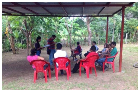
Grupo Focal con los Jóvenes Voluntarios. 22/12/15

Los docentes se ven envueltos en casos de maltrato infantil al momento de realizar las sesiones de clases en la escuela.