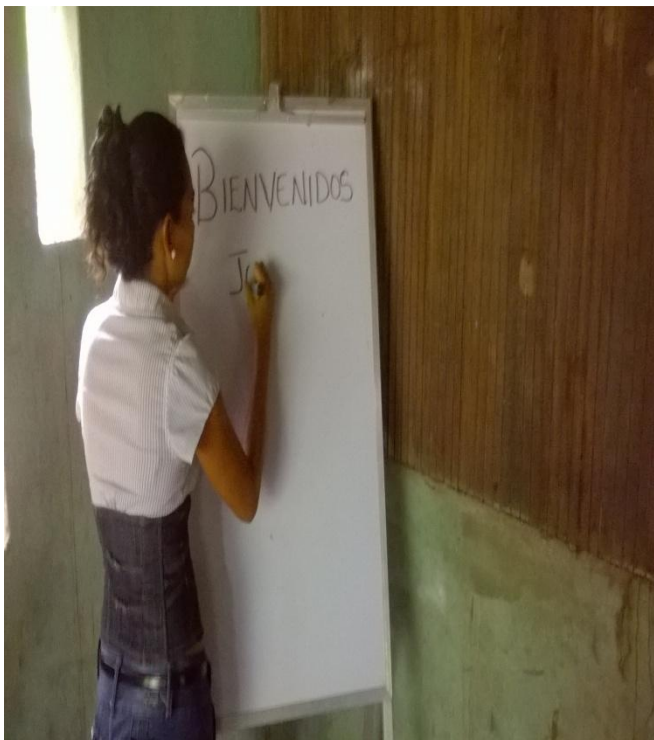
Proceso de Inducción de Grupo Focal. 18/12/15.