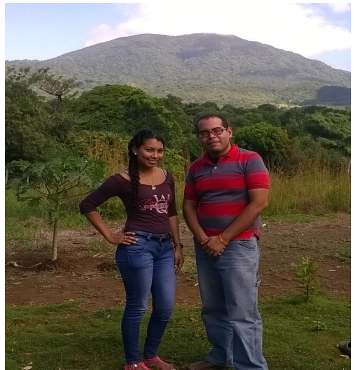
Investigadores en el terreno. 22/12/15.