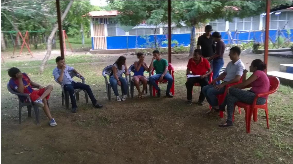
Grupo focal con jóvenes voluntarios. 22/12/15