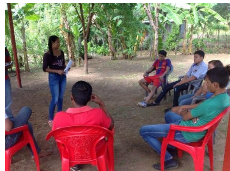
Grupo Focal con los Jóvenes Voluntarios. 22/12/15

World Vision Nicaragua tiene ciertos acuerdos con organizaciones del Estado las cuales hacen una labor más integra en coordinación con estas mismas.