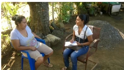
Entrevista con Madre de familia. 18/12/15.

- “Dar más seguimientos en esas familias que no han cambiado”. (Madre de familia 1 Entrevista 18/12/15).