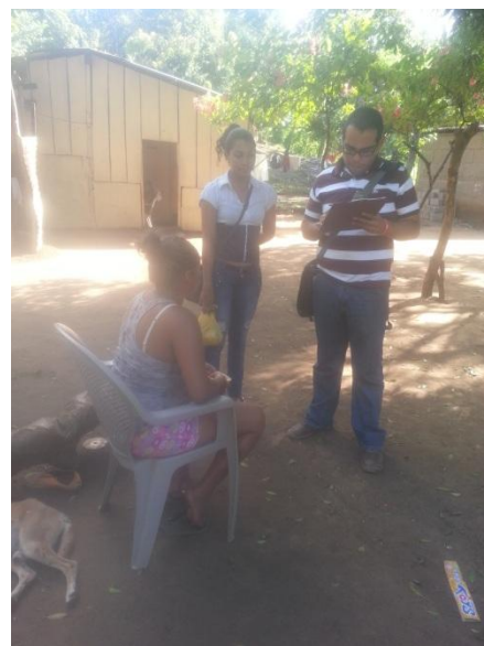
Entrevista con Madre de familia. 18/12/15.