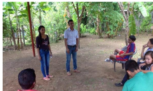
Grupo Focal con los jóvenes Voluntarios. 22/12/15.

Por falta de ciertas cualidades que no tenían los jóvenes voluntarios, se puede determinar porque se presentaba un escaso conocimiento de parte de los padres de familia, por tanto algunos padres no asimilaron bien el mensaje de sensibilización.