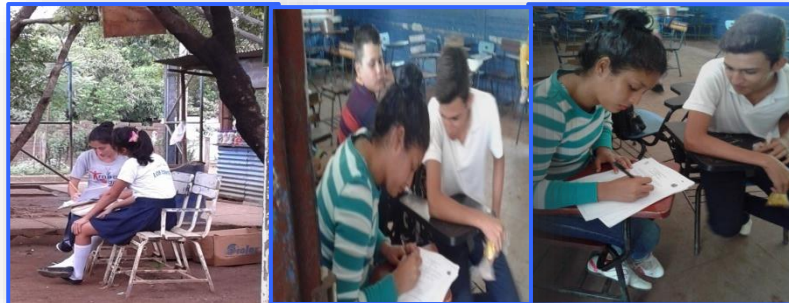
Ilustración 4. Collage de Aplicación de instrumento 1a población muestra (entrevista)