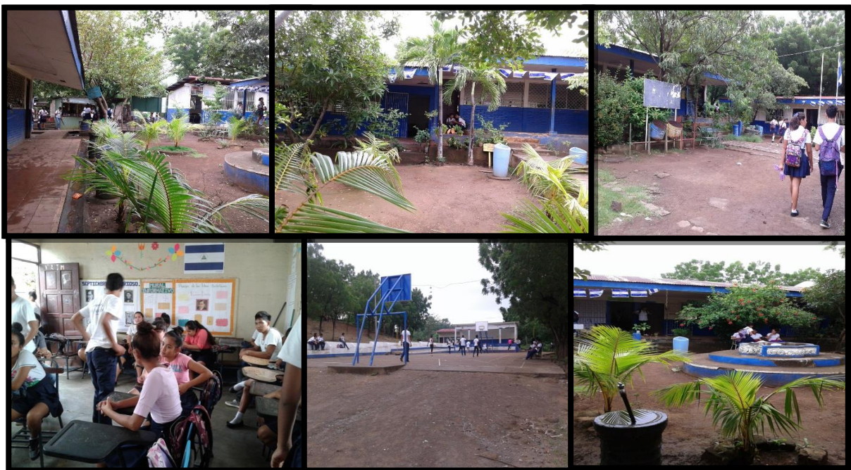
Ilustración 2. Collage Algunas áreas de la escuela

También cuenta con otros dos pabellones en uno de ellos se sitúa la biblioteca y el otro pabellón es llamado Ludoteca que lo definen como “un lugar que es utilizados por niños y niñas en edad preescolar para realizar actividades lúdicas con el uso de herramientas y objetos didácticos, con el fin de enseñar a través del juego” aunque también es utilizado por estudiantes del colegio como lugar de prácticas para actividades culturales.