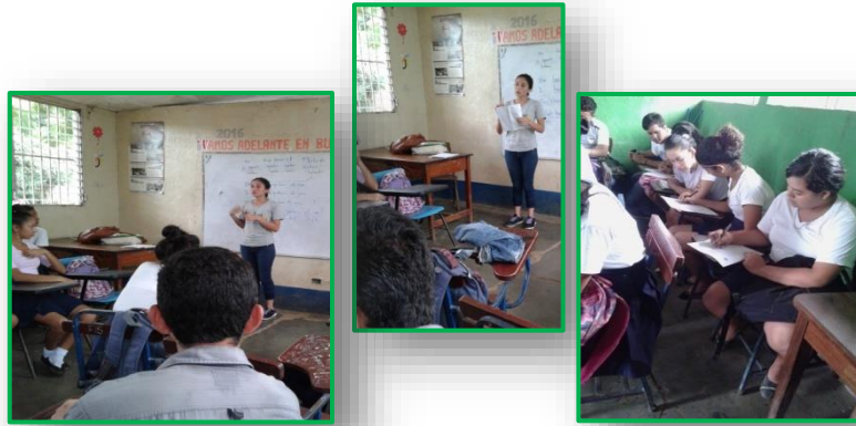
Ilustración 3. Collage de Aplicación de instrumento 3 a población muestra (encuesta)