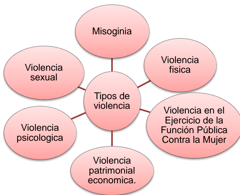
Gráfico N°1: Tipos de violencia