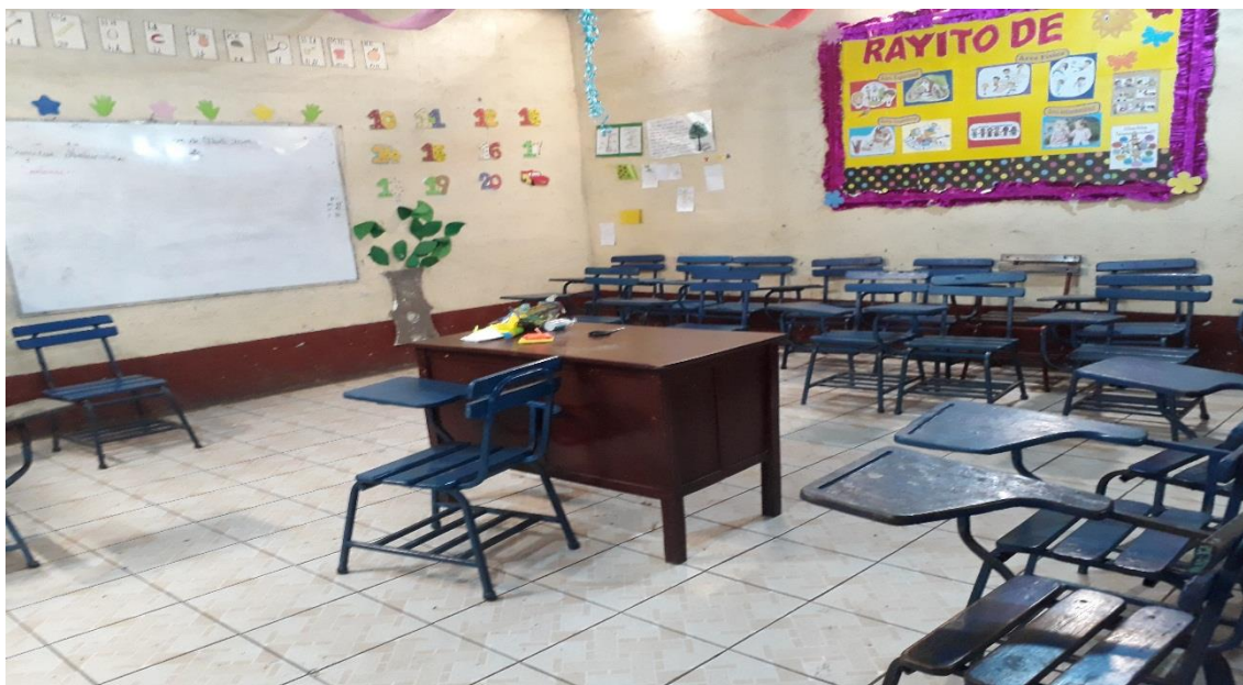
Ilustración 2 AULA DE SEGUNDO GRADO DEL CENTRO CRISTIANO EL BUEN PASTOR.