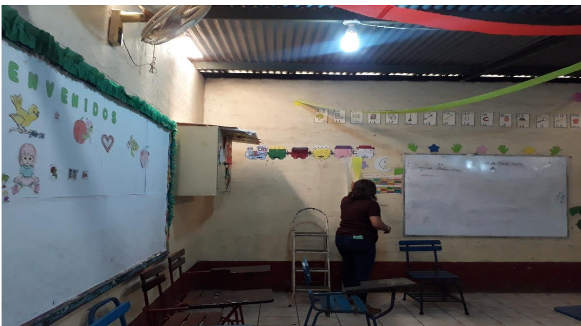
Ilustración 1 AULA DE SEGUNDO GRADO DEL CENTRO CRISTIANO EL BUEN PASTOR.