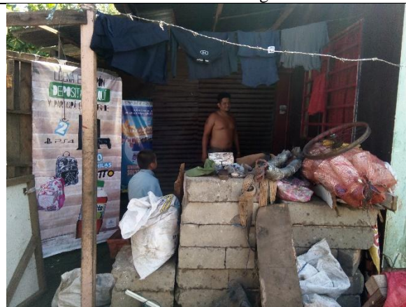
Casa de habitación del caso N° 2 -hogar típico-