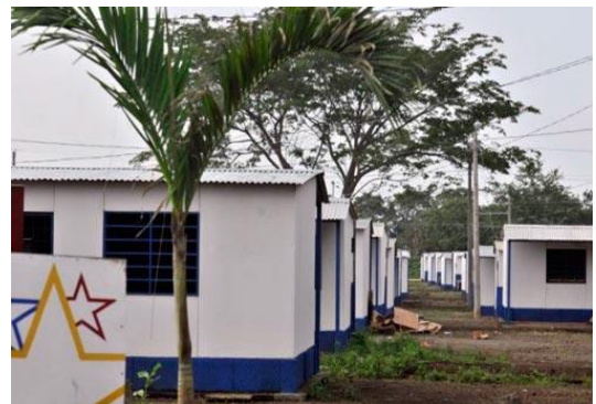
Ubicación entre las casas