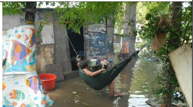
Incertidumbre y desolación