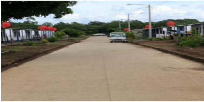
Calles de concreto hidráulico