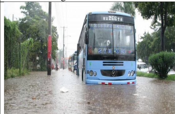
Principales vías de circulación vial de la ciudad