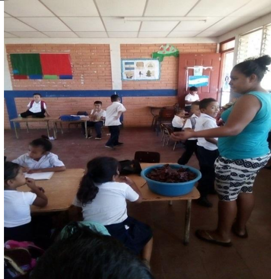
Merienda Escolar en la Escuela