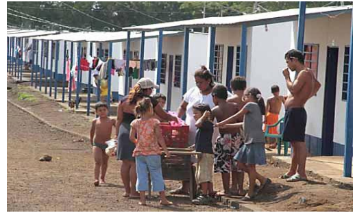
Ubicación de las casas