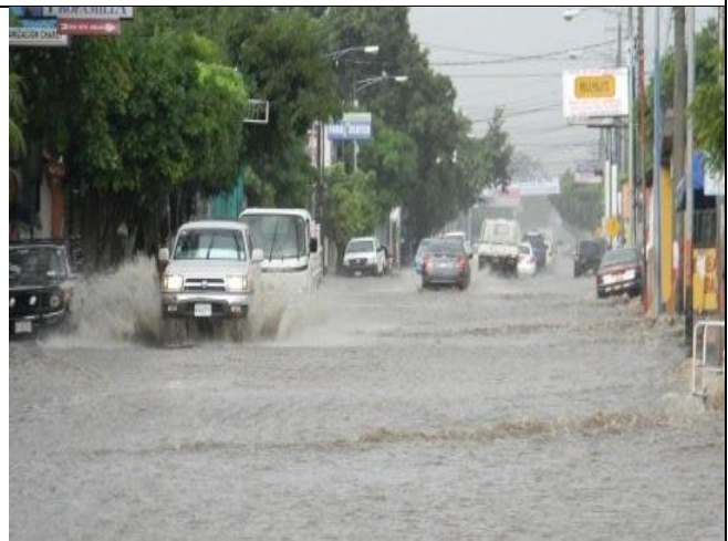
Principales vías de circulación vial de la ciudad