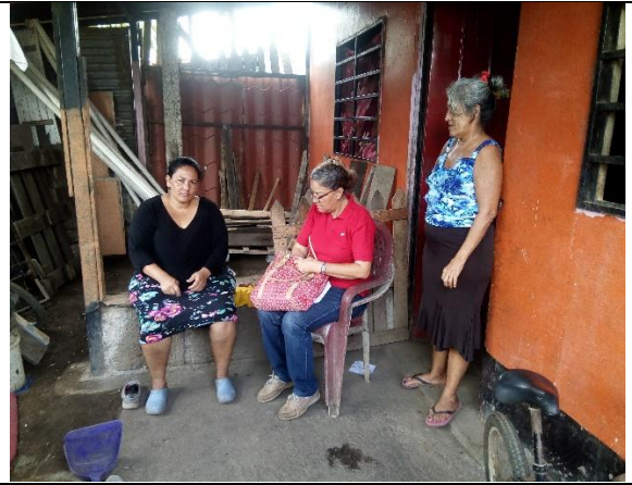
Aplicación del instrumento