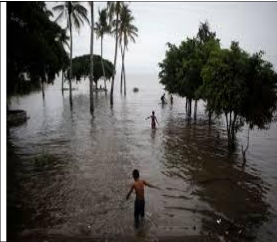
Zona de la costa del Xolotlán después de las lluvias.