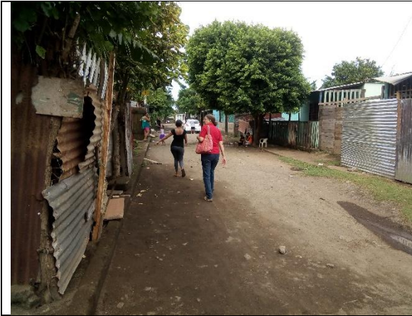
Calles en mal estado