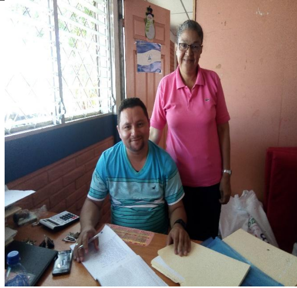
Director de la Escuela Tomás Borge Martínez