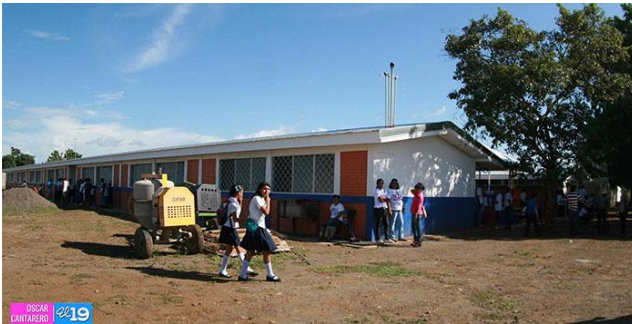
Escuela Tomás Borge Martínez