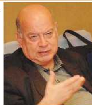
Insulza rendirá mañana un informe ante organismo regional.

Pendiente Secretario de OEA admitió anoche que aún no tiene respuesta a pedido tico sobre retiro de tropas nicas