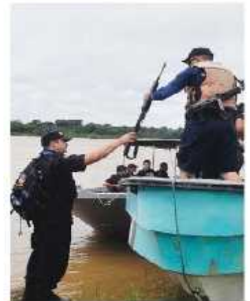
Policías ticos en puesto de Barra del Colorado. MARVIN CARAVACA

Ortega: diferendo se dirimirá en Corte Internacional de Justicia de La Haya