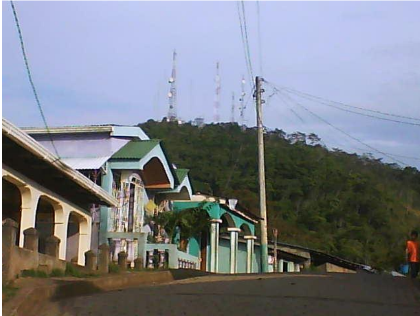
La calle 14 de Septiembre en la comunidad