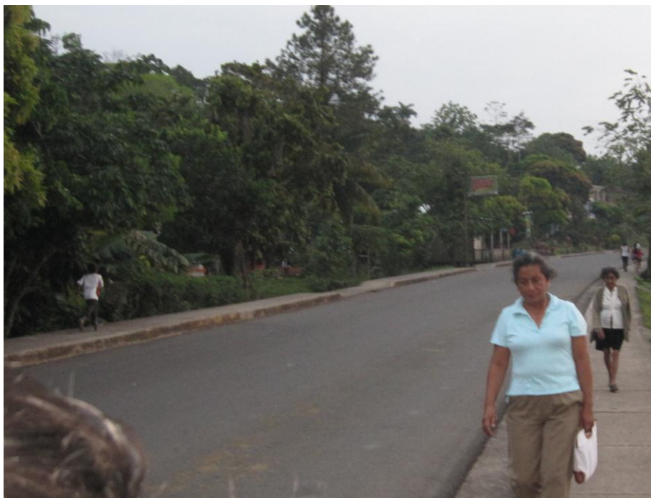
Mujeres regresando a sus hogares después de una jornada laboral Foto tomada por Swann 2013

Las mujeres día a día luchan por salir adelante, pensando principalmente en el bienestar de su familia nuclear trabajando en labores domésticas y con trabajos remunerados. Que son realizados en la misma comunidad como; empleadas domésticas, vendiendo derivados de la leche en la parada, costureras, profesoras y trabajando fuera de la comunidad.