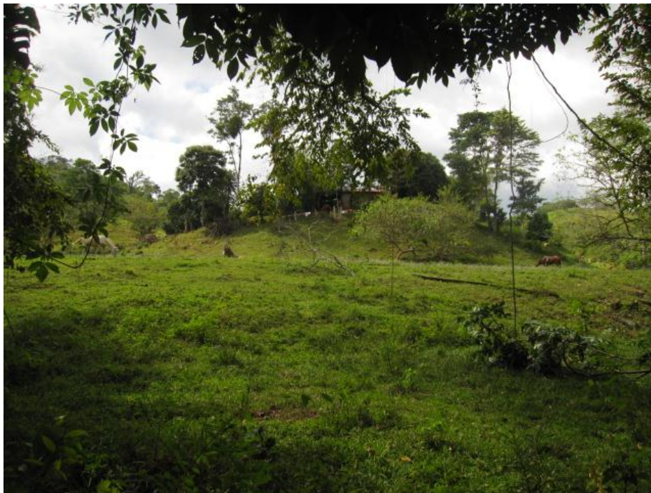
Una mirada a la finca la Blanquita

La siembra y cuidado de los productos son realizados por mujeres que no consideran que su trabajo se de importancia o relevancia, el dinero que se recolecta es para el sustento de la finca y algunas necesidades de la familia.