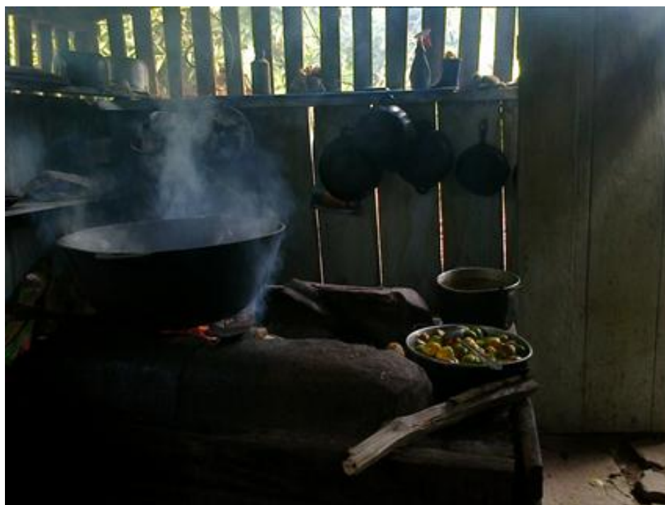
Preparando el fuego para poner las tortillas