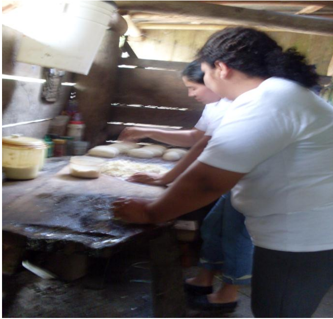
Mujeres en la elaboración de cuajadas

La mujer trabaja en la economía formal que de igual manera intenta cubrir las necesidades de la población entre las cuales están, la ganadería, la agricultura, las pulperías entre otras.