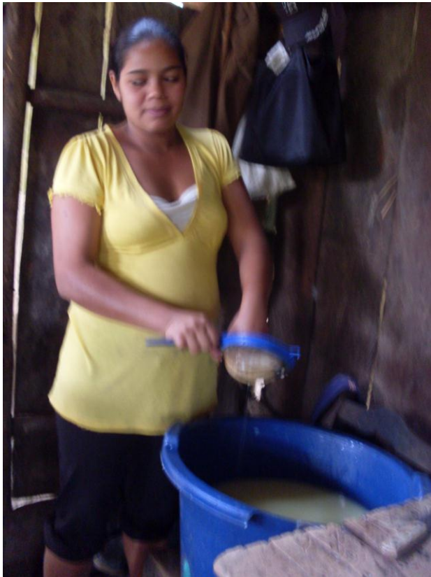
Mujer separando la cuaja del suero

Una vecina que ella hace más trabajo que un hombre, ya que ella se hace cargo de su finca y es que su papa le enseñó el trabajo del hogar. (Martínez, 2012).