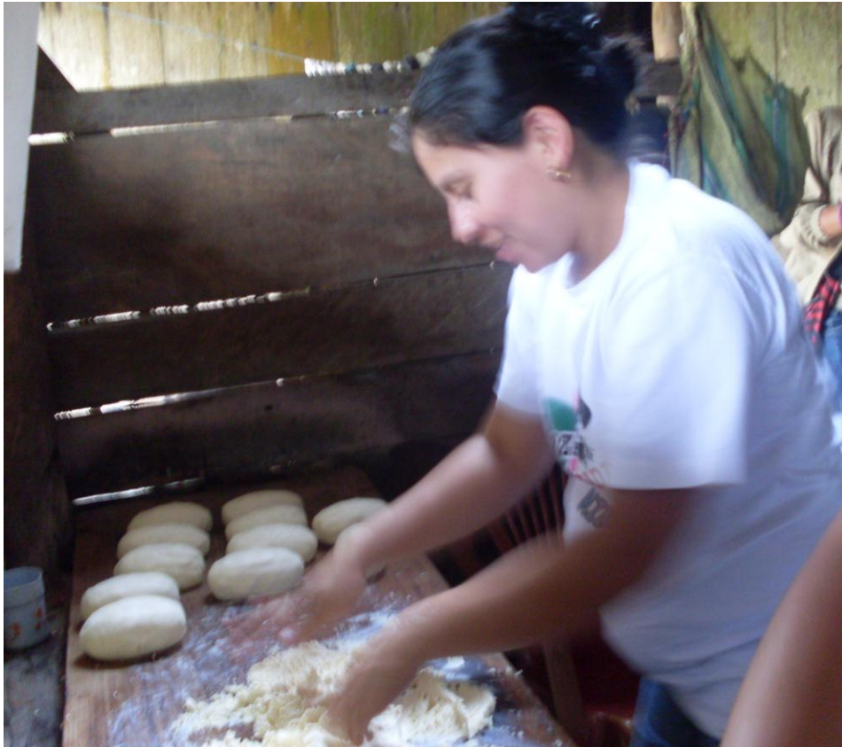
Mujeres en la elaboración de cuajadas

El primer recuerdo que conservan las mujeres de sus madres es el como les decían que debían de cuidar a sus compañeros y atenderlo, y es así como ellas al vivir con sus compañeros se someten.