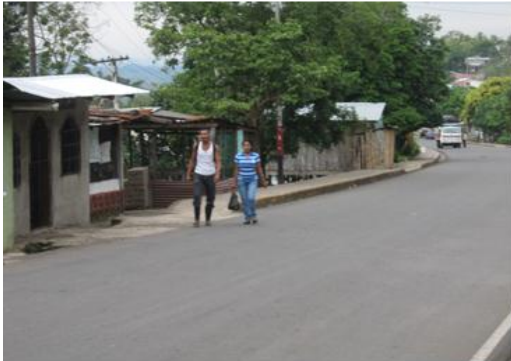
La vida cotidiana de la comunidad

“Yo me encargo solamente de cuidar a los hijos, el hogar, solamente cuidar los chanchos de lo demas lo hace mi marido y el patrón.”