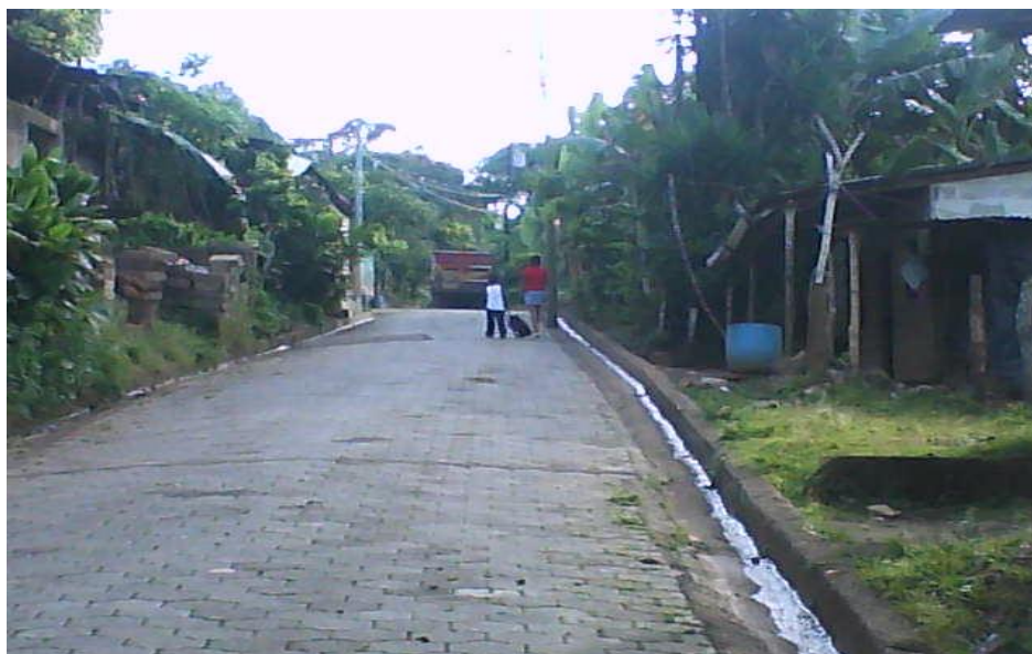
calle adoquinada 2014

Los proyectos de mejoramiento de las calles de la comunidad son notorias ya que en la primera visita eran caminos de tierra y actualmente han sido adoquinadas, estos cambios han mejorada los comercios y a la población. Se mira mejor la comunidad y este mejoramiento, se podrá ver en la distribución de los derivados de la leche.