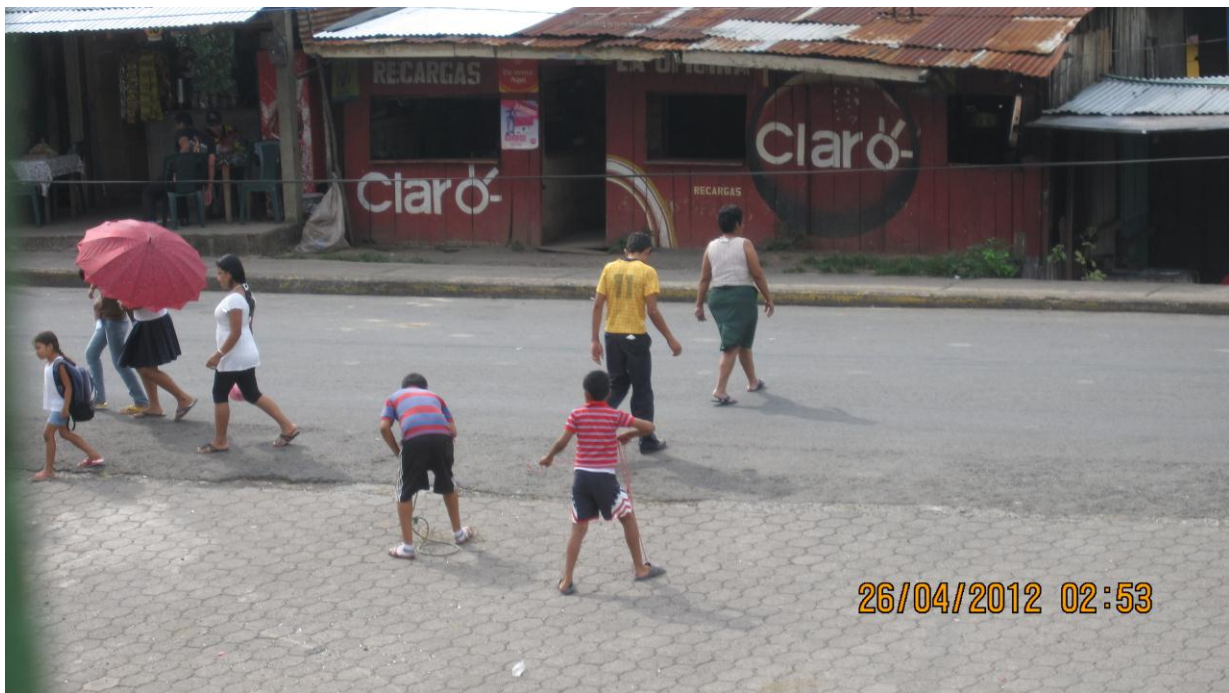
La recreación en la comunidad

Su papel como compañeras es apoyar en la economía que será de gran beneficio para toda la familia, de esta manera las educaron para ser mujeres de hogar para que no faltara nada tanto en casa como en la finca.