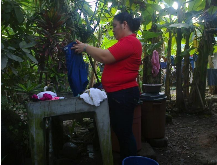
Mujer en las actividades domesticas

Las formas de trabajo que realiza la mujer como productora tienen relación con la inserción en diferentes ambientes. Desde el trabajo informal, el formal, el productivo hasta la cotidianidad.