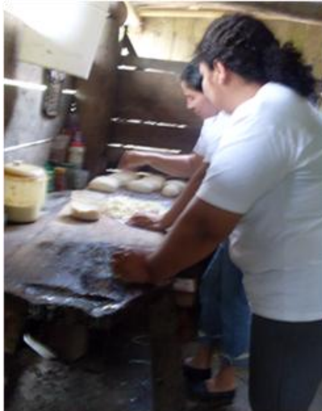
Mujere en la elaboracion de Cuajadas

Las mujeres que se dedican al trabajo domestico se ven forzadas por la penuria en las que viven, al ser madres solteras, y solo contar con el apoyo de sus padres y primos para el cuidaod de sus hijos.