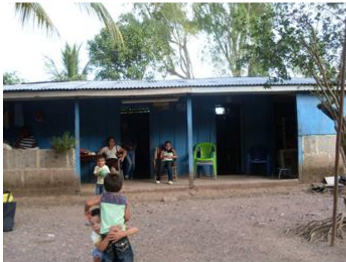
Recreación en las familias de la comunidad, foto tomada por Swann

Es así como la comunidad recibió ese nombre y otros seudónimos como la mayor importación de leche, la comunidad hoy en día cuenta con mucha infraestructura que se observa en lugares públicos como la iglesia, la escuela, el centro de salud, la caseta del alcalde y las casas de la comunidad.