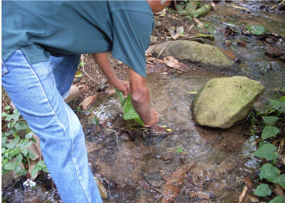
Flujo de agua natural que baja del cerro. Foto tomada por Swann 2011

“La alcaldía dono los árboles para reforestar, y ya vienen con tierrita y solamente los vamos a sembrar con los niños” (Lazo, 2010)