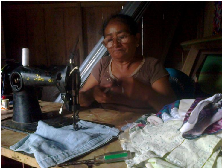
Mujer realizando costura, Foto tomada por Swann 2015

Las mujeres que trabajan fuera del hogar cumpliendo roles domésticos como medio de trabajo, también cumplen de igual manera con su trabajo doméstico en sus hogares, estos no son remunerados, ya que se les ha transmitido la cultura de cuidado del hogar.