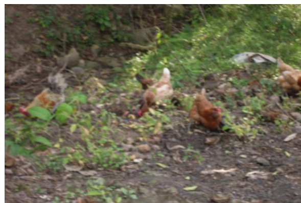
Cerdo y gallinas del programa usura Cero, por medio del gobierno municipal Gobierno