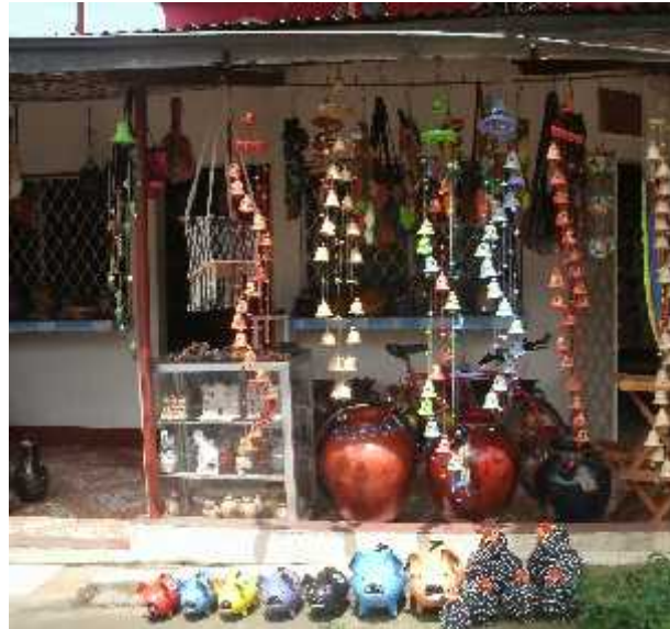
Ilustración 14 Exposición de las artesanías que se elaboran en San Juan de Oriente

San Juan de Oriente se ha convertido en el principal representante de artesanías nicaragüenses de barro que allí han venido a ser la base de la economía familiar y local. Es una actividad económica estratégica pues, ya que más del 80 a 90 por ciento de los artesanos se dedican a esta actividad su producción es comercializada localmente y al exterior estas últimas se efectúan mayormente a través de los intermediarios aunque los niveles al exterior son más altos se resalta su importancia en la absorción de mano de obra local lo que favorece al municipio y a sus pobladores