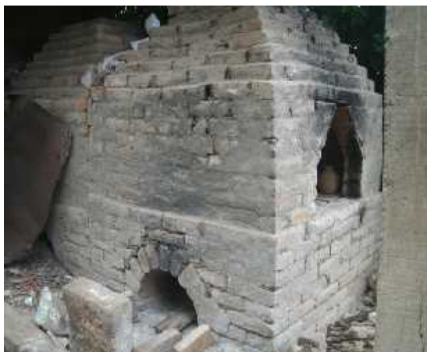
Ilustración 5: Horno artesanal con dos entrada la parte de abajo es para combustión de la leña y la parte de arriba para el quemado de la pieza.