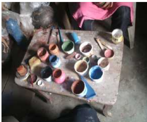
Ilustración 4: Pinturas de óxidos

El óxido de zinc de color blanco hueso que consiste en preparar la base para aplicar los colores sobre la misma cada pieza se seca en una bolsa plástica por dos horas dependiendo del clima en que se encuentre.