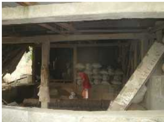
Ilustración 17: Taller de Roger Calero.