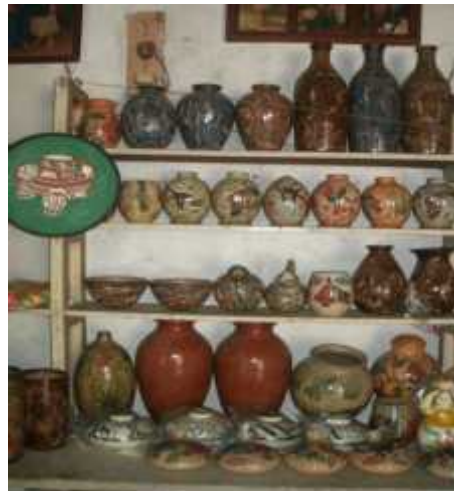
Ilustración 9: Artesanía creación libre