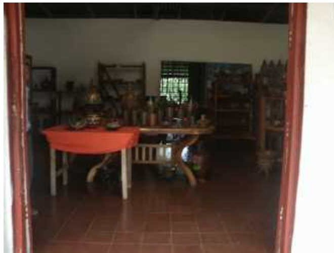
Ilustración 15: sala de la cooperativa quetzacoatl

Durante el año 1985 Roberto Potosme se dio a la tarea de visitar a numerosos artesanos para promover la idea de formar una organización de ellos y para ellos los artesanos que no estuviesen organizados se le haría más problemático el obtener la materia prima en particular por las características del régimen fue demasiado costoso y muy difícil para los individuales el obtener óxido de cobalto magnesio hierro zinc y el barro negro el cual viene del sauce del departamento de León