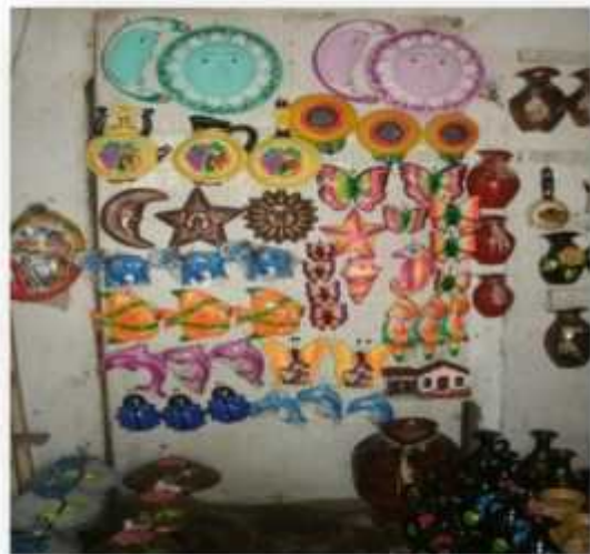
Ilustración 13: Artesanía en moldes