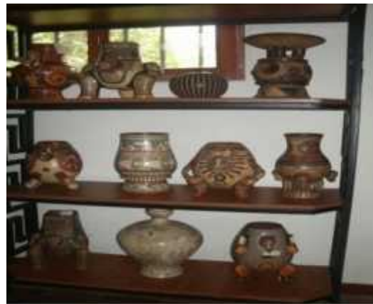
Ilustración 7: Artesanía precolombina