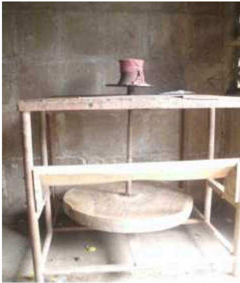
Ilustración 3: Torno artesanal es una herramienta para elabora las piezas, de artesanía donde solo se utilizan las manos y los pies para elaborar las piezas de barro ejerciendo una fuerza sobre la pieza.

Después que el barro está listo lo empacan en bolsas blancas transparentes listos para ser vendidos a otros artesanos