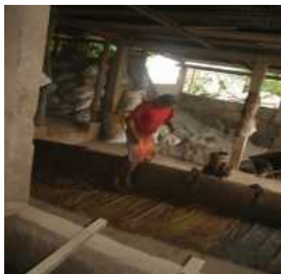
Ilustración 18: José Carballo 45 años se encontraba amasando el barro en el taller Roger Calero.