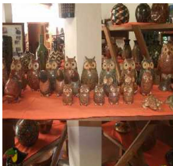
Ilustración 23. Piezas de barro con un toque ecológico cooperativa Quetzacoatl.