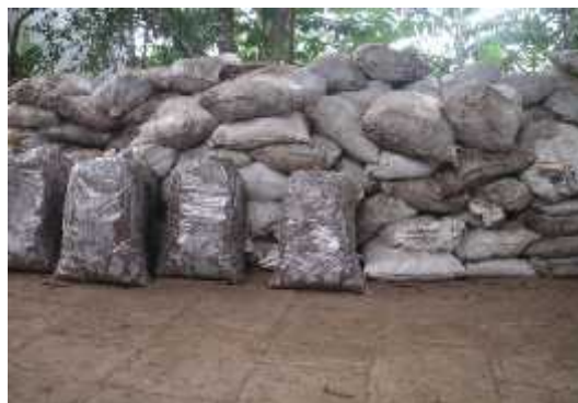
Ilustración 19: Sacos de barro sin procesar.