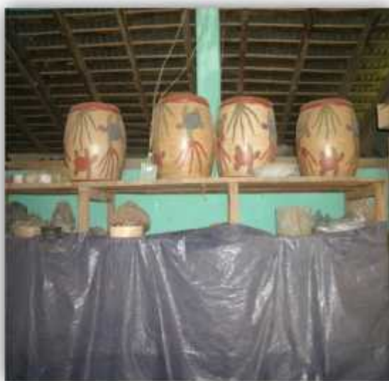
Ilustración 21: Bodega de almacenamiento del barro