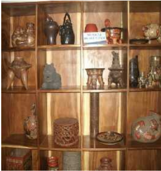
Ilustración 10: Artesanía precolombina