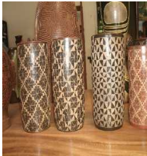
Ilustración 11: Artesanía geométrica