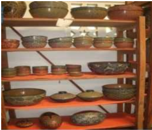
Ilustración 6: Artesanía utilitaria