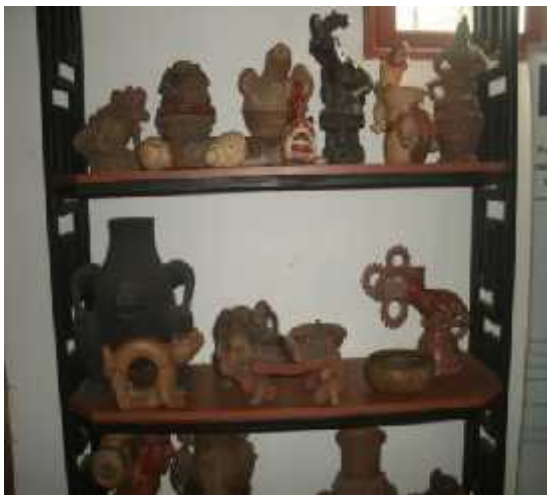
Ilustración 8: Artesanía precolombina