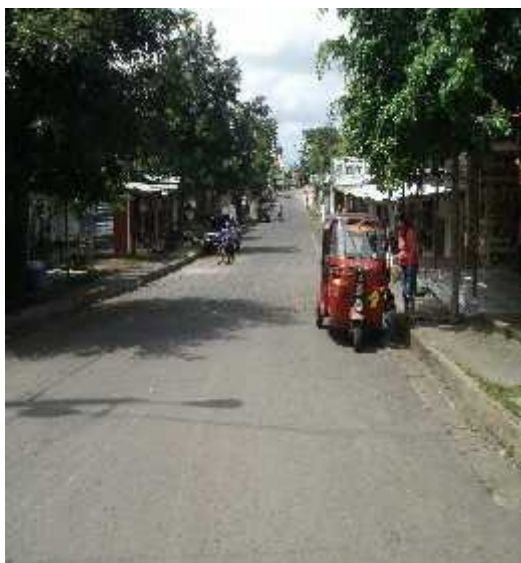
Ilustración 22. Municipio de San Juan de Oriente zona I