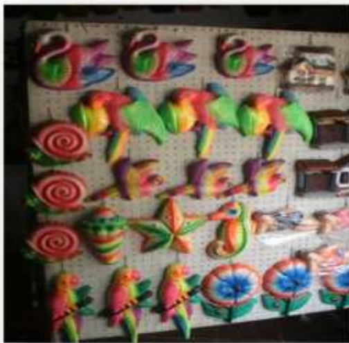
Ilustración 12: Artesanía en moldes