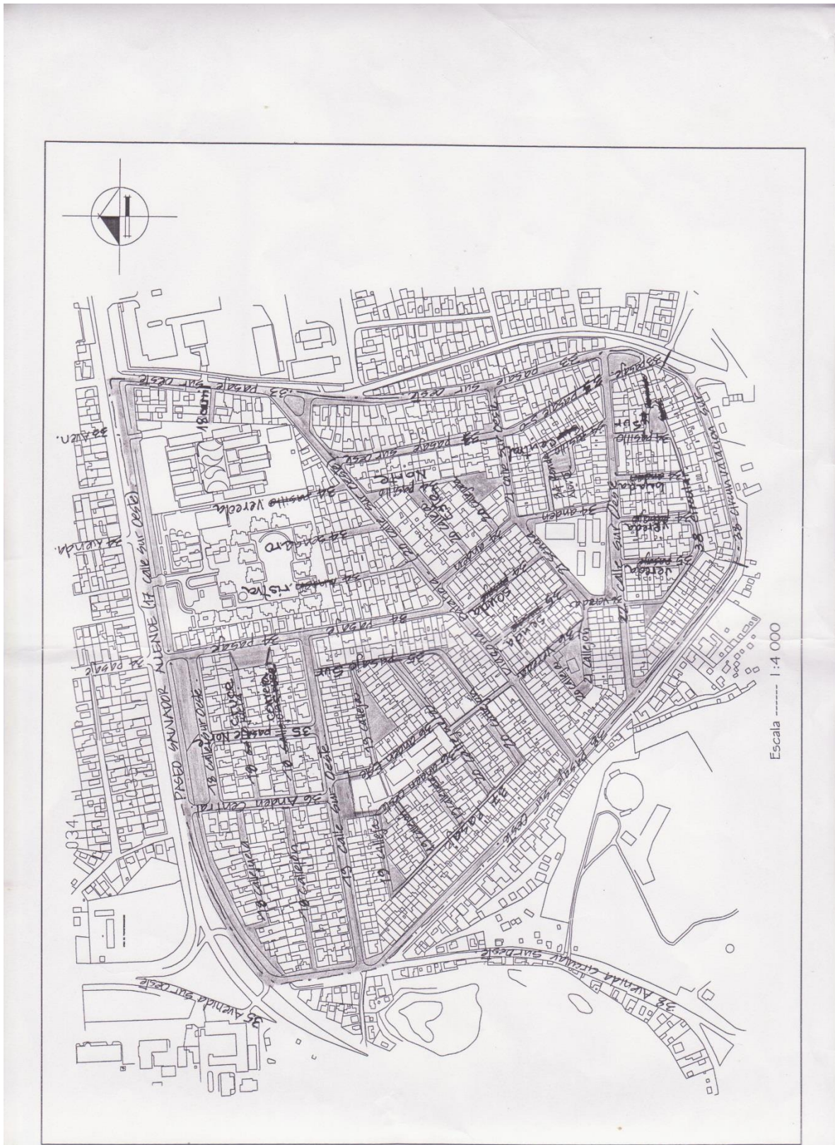
Ilustración 8 Plano del Barrio Batahola Sur.