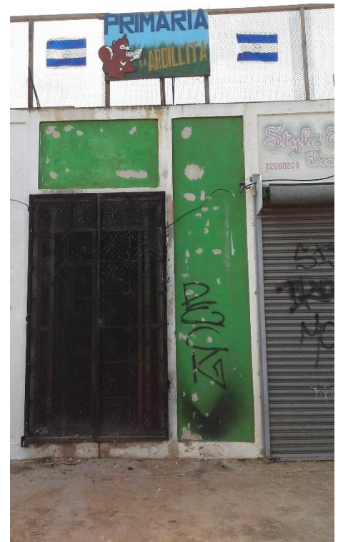
Ilustración 3 Preescolar la Ardillita.

Cerca de la zona también se encuentra lo que es la Primaria la Ardillita, pero únicamente brindan el servicio de Preescolar siendo este también de carácter privado, este era una casa en la que cada año al iniciar el período escolar las personas a las que les pertenecía la propiedad anteriormente pelean para que se les devuelva la propiedad. Este preescolar por la parte de afuera no se encuentra pintado ni nada que indique que es un preescolar, por dentro el piso es de cemento, con algunos azulejos quebrados, las aulas se encuentran divididas la mitad a la derecha y la otra mitad a la izquierda, al lado de la derecha encontrándose principalmente lo que es la dirección y la bodega y una sección desocupada y al lado izquierdo se encuentra lo que son los tres niveles donde los niños reciben clases y en el centro es el único lugar donde los niños pueden jugar y al no encontrarse ningún puesto de venta dentro del establecimiento los niños tienen que llevar sus meriendas.