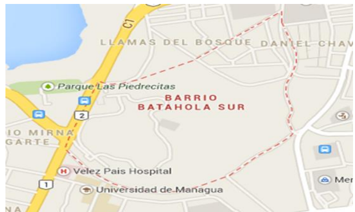
Ilustración 1 Mapa del Barrio Batahola Sur.

El Barrio Batahola Sur se encuentra ubicado y forma parte del Distrito II. Los Límites del barrio son: al Norte con el barrio Batahola Norte, al Sur con el Plantel de la Alcaldía, al Este con la antigua Embajada Norte Americana y al Oeste con el Plantel de Enacal.