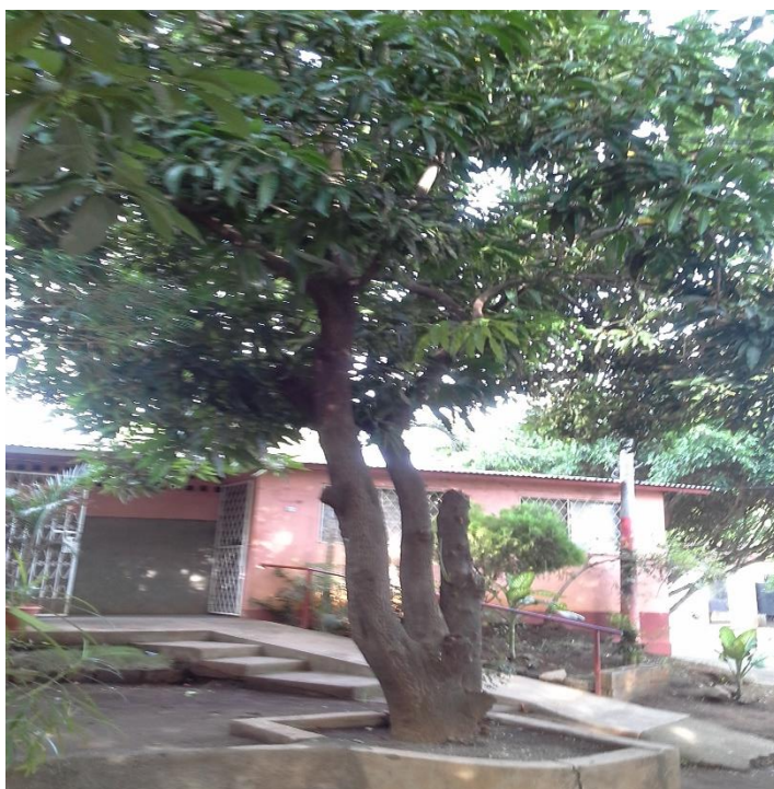
Ilustración 10 Palo de Mango