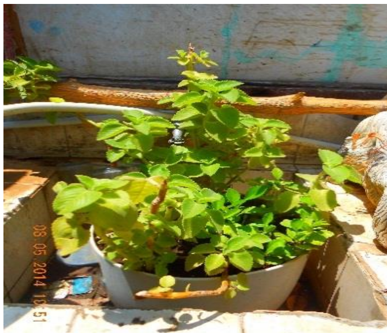
Ilustración 9 Oregano Planta Medicinal