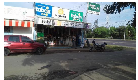
Ilustración 4 La Colmena. Pulpería.

El comercio formal más importante del barrio son las ventas debido a que son las que más se encuentran dentro del mismo casi en cada callejón del barrio, se encuentra al menos una venta en la que se puede encontrar golosinas, embutidos, pollos, carnes, arroz, frijoles aunque la principal de las ventas tiene el nombre “la Colmena” es la venta más grande que existe dentro de estas además que los productos anteriormente mencionado se puede