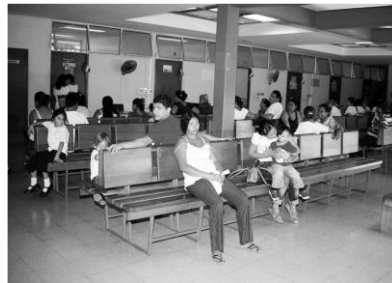
Foto 16 Entrada principal del moderno Centro de Salud de la colonia Morazán, que además atiende a la población de los barrios aledaños y Sala de espera del Centro de Salud de la Colonia Morazán