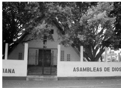
Foto 17 Fachada de la actual Iglesia católica Santa Gema y Vista de la Iglesia Cristiana Asambleas de Dios, ubicada en el costado Norte de la Colonia Morazán.