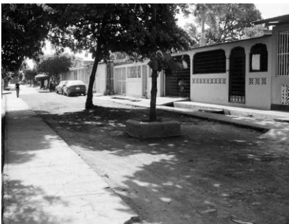
Foto 14 Panorámica de uno de los callejones típicos de los proyectos habitacionales que el INVI realizó en los diferentes sectores de la capital. Este es del callejón del grupo A de la Colonia Francisco Morazán