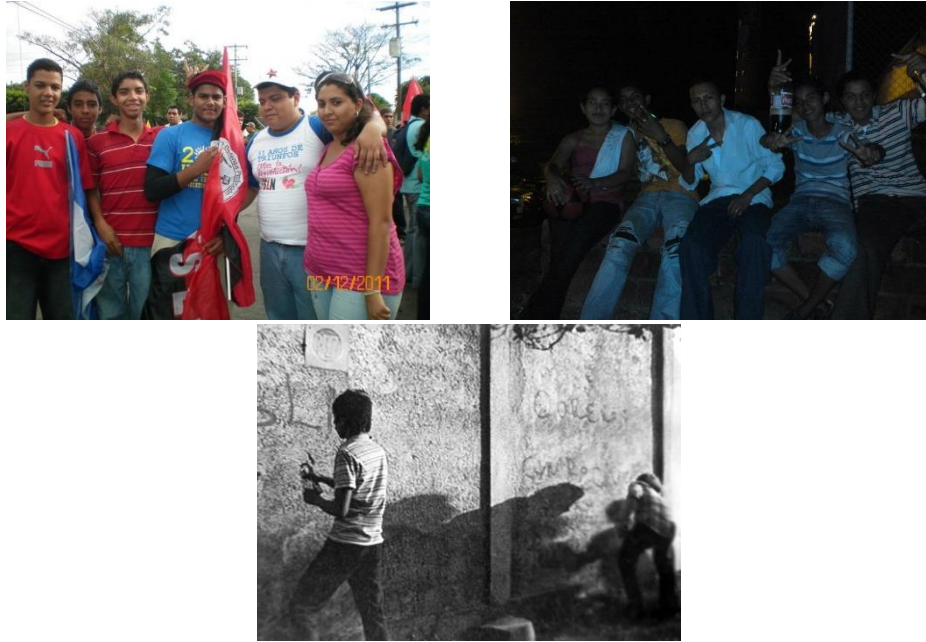
Foto 4 Jóvenes organizados en la JS de la colonia , Jóvenes que participan en momentos esporádicos en las actividades de la colonia Francisco Morazán periodo 2011- 2014 y jóvenes que realizando pintas revolucionarias 1979

Al estar organizados los jóvenes de la colonia se espera que se les permita formarse como personas profesionales y útiles para la colonia, así mismo que él está dentro de la juventud realizar más actividad para que se recreen estos jóvenes, los niños y niñas de la colonia. Pues es de ellos el futuro del desarrollo de la colonia.