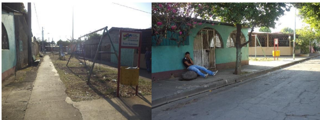
Foto 8 Parque ubicado en el grupo B y el cyber a su costado