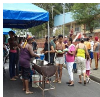
Foto 3 Como agua de mayo venta de frijoles solidarios, ferias solidarias y acto de inauguración de la avenida principal actividades realizadas en los periodos 2013-2014-2015

Las organizaciones no excluyen, quienes lo hacen son las personas esto no es saludable en la medida de las posibilidades las actitudes de los dirigentes debe de ser de involucrar y promover el compañerismo, solidaridad y respeto hacia los demás que a pesar de la existencia de algún resentimiento que se expresan en algunas personas ya sea por algo hecho o dicho en determinado momento se puede confiar una tarea a esta persona y de esta manera este se sentirá involucrado, no marginado pues todos y todas tenemos derecho a integrarnos en la búsqueda de la solución del barrio o la comunidad, pues no todos somos de agrado, ni causamos simpatía en los demás, el que no actúa no se equivoca y así no aprenderá a mejorar.