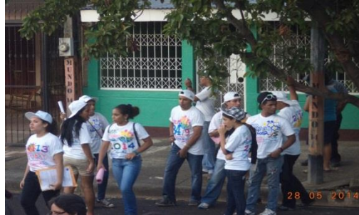
Foto 6 Participación de la JS19J en la entrega de carnet de militancia

pequeña participación en las actividades realizadas por los Gabinetes de la familia, comunidad y vida.