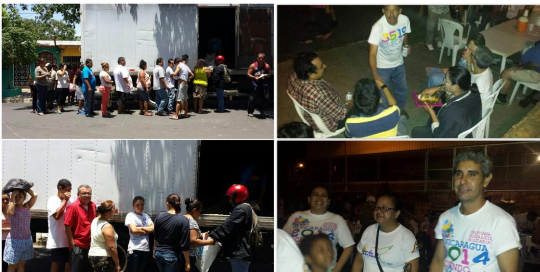
Foto 11 venta de los frijoles solidarios y festividad del 19 de junio del 2014