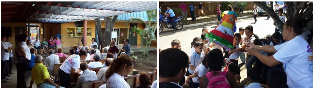
Foto 10 celebración del Adulto mayor y del día del niño