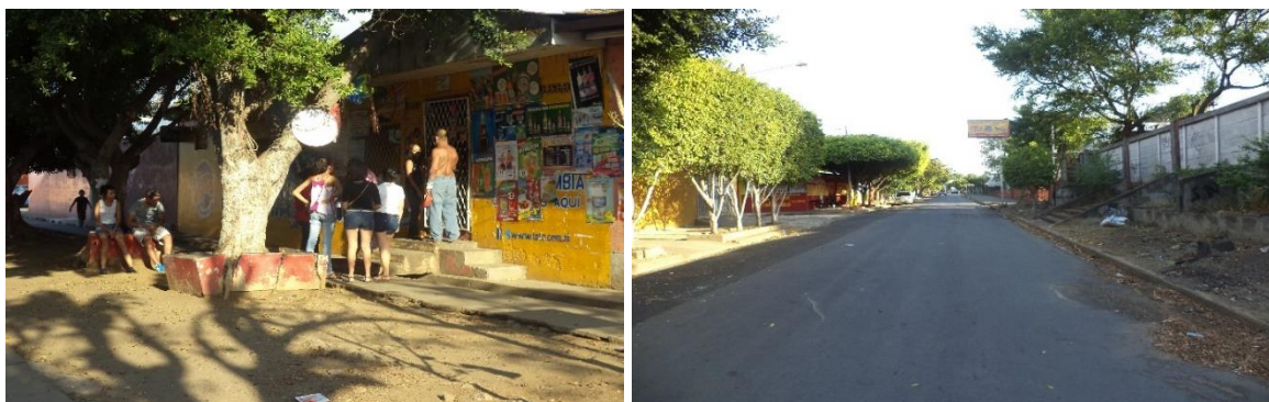
Foto 9 Pulpería Delia Y Avenida Thelma López