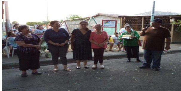
Foto 2 El GFCV Organización Social de la colonia Francisco Morazán periodo 2013-2014