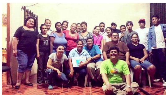
Foto 5 Miembros del equipo del GFCV, Manzana Cuadra y Js19J de la colonia Francisco Morazán del periodo 2014

Hay que destacar el trabajo de las mujeres empoderadas en los roles de líderes en estas organizaciones, que nacen de la comunidad para la comunidad y cada uno de sus pobladores haciendo uso del protagonismo complementario de cada ciudadano y ciudadana, de manera que fortalezcan todos los mecanismos de organización que lleven a alcanzar más rápidamente las metas que se proponen, para ir adelante, para garantizar el presente y el porvenir mejor.