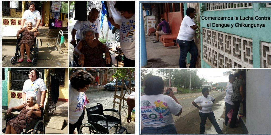
Foto 12 Entrega de sillas de rueda y campaña casa a casa en contra de los criaderos de zancudo.