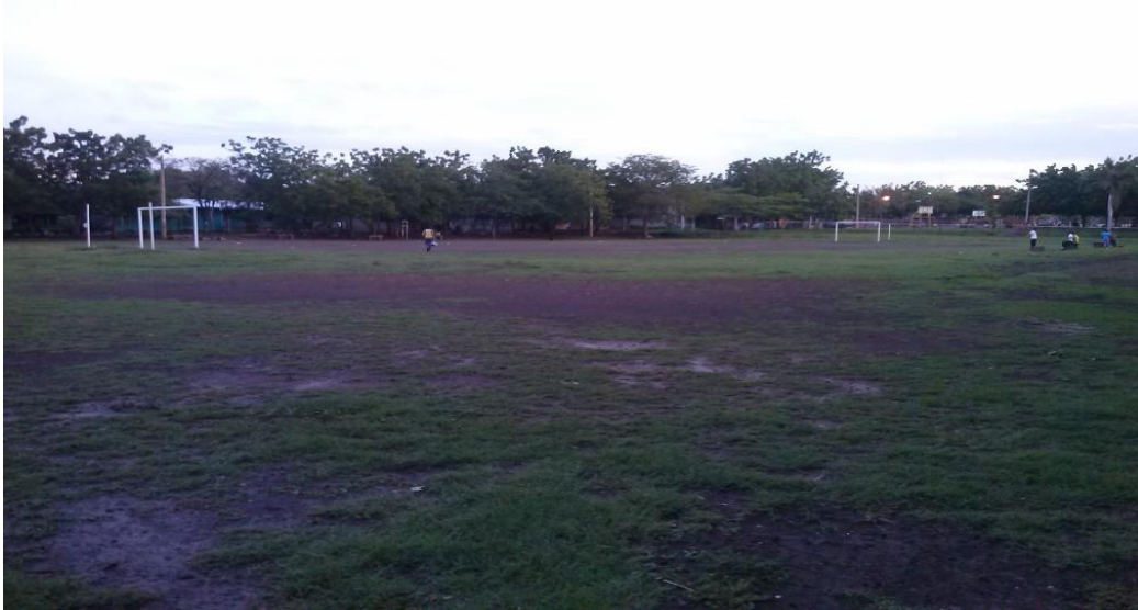
Foto 9 Parque central de Batahola Norte, donde se agrupan los jóvenes provocando violencia en el espacio público.