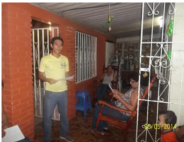
Foto 16 Exposición de los datos encontrados en prácticas de campo II.