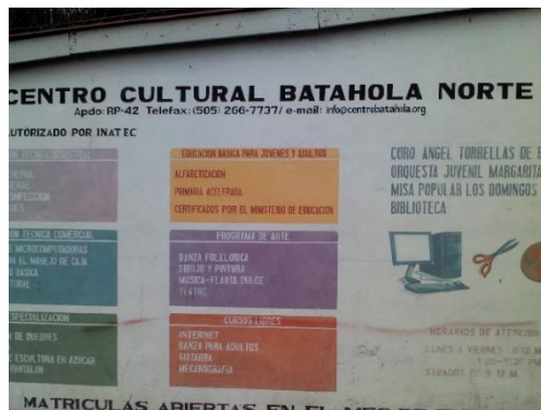
Foto 5 Cursos que ofrece el centro Cultural Batahola Norte.

El Centro Cultural Batahola Norte en el cual llegan muchos pobladores a estudiar los diferentes cursos que ofrecen de formación técnica, es el de más aporte a la comunidad, en los cuales se les brinda becas internas. Se entiende que son becas para estudiar los cursos que se ofrecen y las becas externas a los jóvenes estudiantes con buen rendimiento académico desde primaria hasta la educación superior, esta beca es monetaria y los jóvenes laboran en los servicios sociales del centro cultural en ayudar a los niños con sus tareas escolares, atender la biblioteca y limpieza del inmueble.