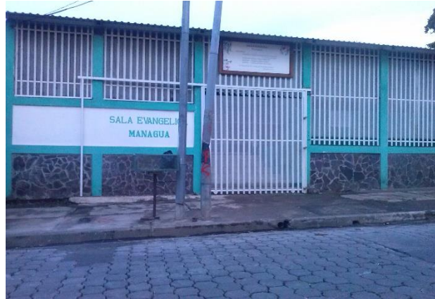
Foto 6 Sala Evangélica Managua ubicada al Norte en Batahola Norte.

En el recorrido por el barrio, se encontraron dos iglesia evangélica que se encuentran en las inmediaciones de la calle norte con el barrio Miraflores, las iglesias de nombre Sala Evangélica Managua y la iglesia cristiana Ejército de Salvación; estas abren sus puertas los días martes, jueves, sábado y domingo.