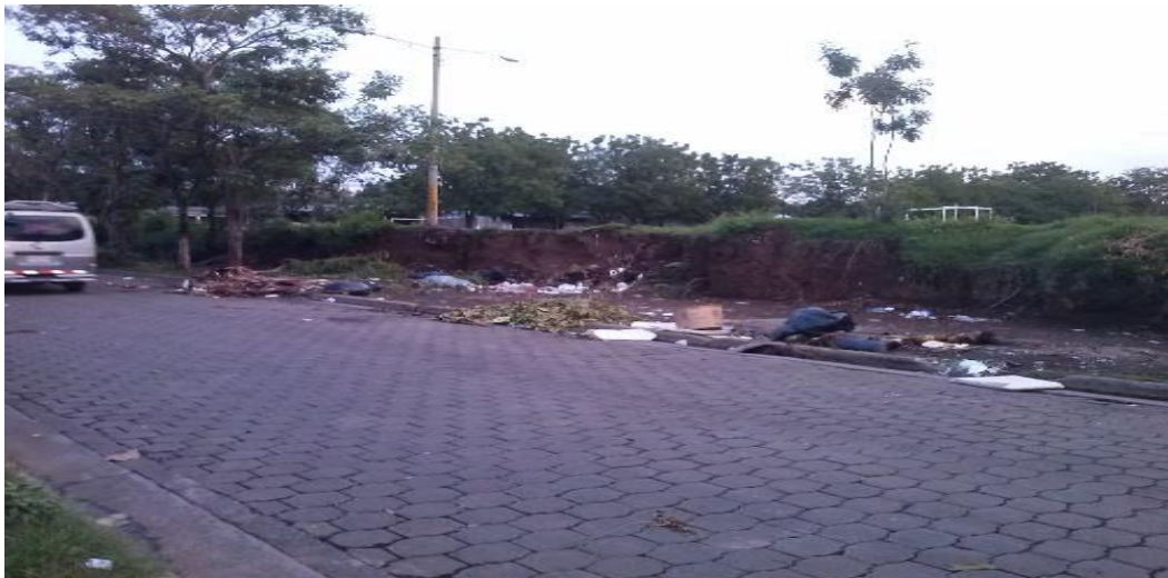
Foto 2 Botadero Clandestino en el costado norte del parque central de Batahola Norte.

Las personas del barrio Batahola Norte enfatizan en la manera y forma en que se ha venido haciendo cambios en lo interno del barrio con respecto a las problemáticas más notorias como la delincuencia. Es una situación que vienen enfrentando hace tiempo en todo el barrio, ya que los delincuentes hacen de las suyas a toda hora del día y estos actos delictivos tienen asustados y alarmados a los habitantes de la zona. Esta problemática se aborda en el capítulo dos de manera general con las demás problemáticas que afectan el barrio. Una de ellas es el problema de la basura, en la que se forman botaderos clandestinos en la parte de atrás del parque central del barrio.