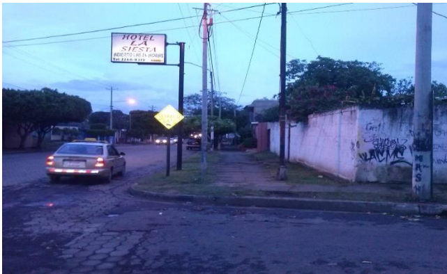
Foto 8 Hotel la siesta Ubicado en el costado Norte de Batahola Norte.

Contiguo se ubica la pista de baile “El Gran Lago” ubicado en la parte superior en un edificio de dos pisos y los módulos de abajo se encuentran ocupados en negocios de ferretería y un salón de belleza.