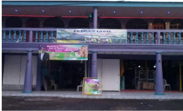
Foto 7 Pista de baile El Gran Lago en el costado oeste de Batahola Norte.

Siguiendo la ruta de la calle oeste en la entrada principal de ENACAL se encuentran varios lugares de esparcimiento en donde las personas llegan a divertirse. Entre ellos se encuentran Bar Restaurante “Copa Cabana” de un aspecto muy veraneante con un techo de palmeras de coco y mesas de madera.