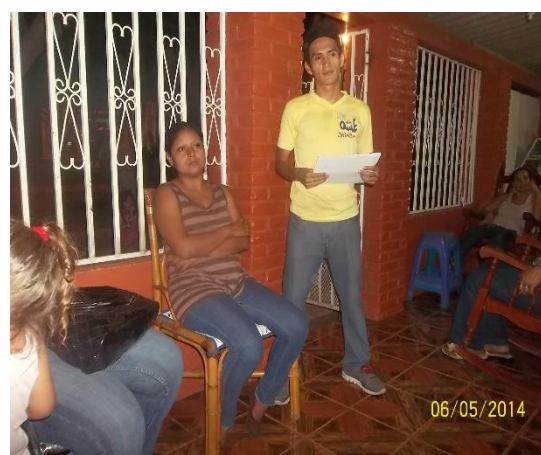
Foto 17 Escuchando las intervenciones de los asistentes.