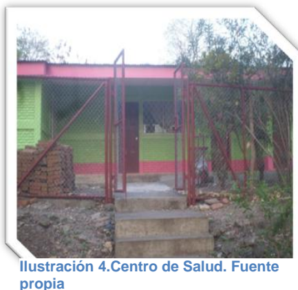
Ilustración 4. Centro de Salud.

Existe un centro de salud que está ubicado en Susulí Central, este atiende a toda la población de la comunidad y las comunidades vecinas, cuenta con los servicios de: consulta externa, farmacia, laboratorio, control a embarazadas; en este centro atiende 1 doctor y 2 enfermeras. También en la comunidad se encuentran parteras y curanderos los cuales son visitados por algunos