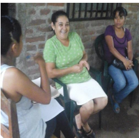
Ilustración 14. Aplicándoseles la guía de entrevista.