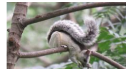
Ilustración 2. Ardilla.

El Origen del nombre Susulí proviene de la lengua Matagalpa; que significa “río de ardillas”, susu- ardillas; lí- río. (Incer Barquero, 1986, pág. 337) Y resulta ser que Susulí es atravesado por el río Calicó, y en el bosque circunvecino es posible encontrar ardillas.