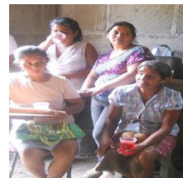
Ilustración 6. Mujeres beneficiarias del bono productivo. Fuente propia

La mayoría de los pobladores tienen moto, camionetas que ocupan para movilizarse. Una de las problemáticas que se