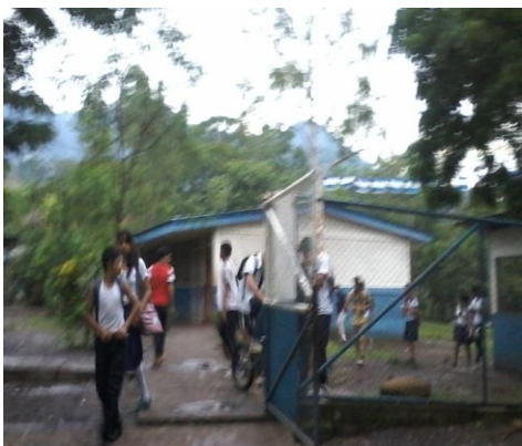
Ilustración 13. Alumnos del Colegio Rubén Darío.