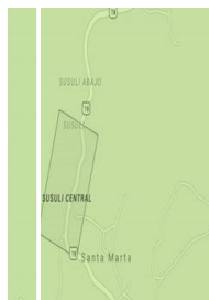
Ilustración 1. Mapa del departamento de Matagalpa.