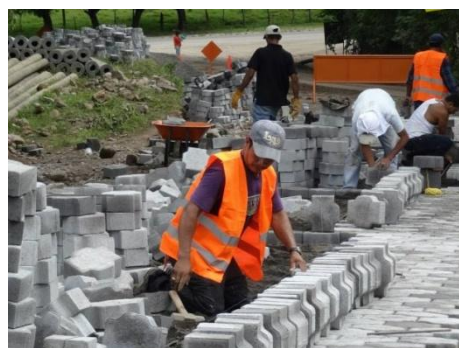
Ilustración 7. Adoquinamiento de la carretera, San Dionisio-Esquipulas.

En la actualidad se está trabajando en el proyecto de adoquinado de La Planta-San Dionisio, esto permitirá un mejor acceso a la comunidad y sus comunidades vecinas como también cambiarán los medio de transporte reemplazando el caballo con las motocicletas que ya la mayoría de los pobladores la utilizan a pesar de la incomodidad de los caminos; también el uso de camionetas que muchos de los pobladores tienen pero que no eran utilizados por el mal estado de los caminos.