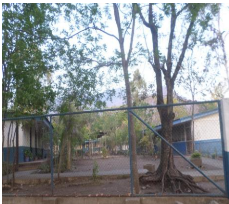
Ilustración 5. Escuela Rubén Darío, Susulí Central.

Se construyó una pequeña escuela, sus paredes con ladrillos de barro, piso de