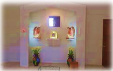
Capilla de la iglesia Juan Pablo II

La iglesia católica está actualmente estructurada por sus diferentes pastorales, como pastoral familiar, pastoral de jóvenes, pastoral de la niñez, pastoral educativa, pastoral social, pastoral pía popular, el cuadro del legado de la palabra, grupos de lectores, catequistas, hay más de 15