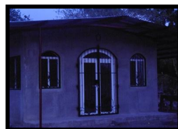
Iglesia Arca de Noé

Su esposo y su hijo la han apoyado en esta construcción de la iglesias por sus propios medios han logrado ese objetivo y meta que se propusieron, logrando obtener todo lo necesario para acondicionar su iglesia para que los miembros se sientan bien, cuenta con un grupo de coristas, y jóvenes que tocan los instrumentos musicales como: Guitarra, Batería, Teclado, entre otros instrumentos.