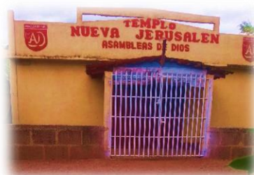
Iglesia nueva Jerusalén tomada en el 2013 aún no ha tenido ningún cambio

La cuarta iglesias es la Nueva Jerusalén , fundada en los años ochenta en la época en que los Sandinistas, estaban en el poder la iglesia, se fundó poco después de las iglesias Luz y Vida, comenzó primeramente en una casa donde se realizaban los cultos, unos de los miembros de la iglesia, donó un terreno para la construcción de la pequeña iglesia, con el tiempo han venido reconstruyendo ya que algunos miembros son de escasos recursos y no tienen la posibilidades para apoyar en la construcción de dicha iglesia, poco a poco han ido comprando instrumentos musicales.