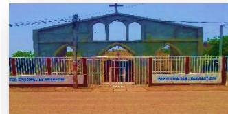
Iglesia Juan pablo II tomada en el año 2015 iglesia actual

la población se ha incrementado anteriormente mencionada y la iglesias ya no da abasto para que la población entre se siente en las bancas cómodamente, en la actualidad realizando nuevas remodelaciones, está haciendo más grande para que los miembros de la iglesia se incorpore y se sientan a gusto y cómodos para escuchar la misa que se realizan los días jueves a las 6:00 pm y termina a las 7:00 pm, y los días domingos de 6:00 am a 7:00am y en la tarde de 6:00 pm a 7:00 pm.