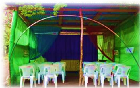
Primera iglesia Arca de Noé restauración de la familia tomada en mayo del 2013