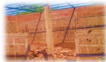
tomada en el momento que estaba construyendo las aulas de clases en la iglesia nueva Jerusalén

Actualmente la iglesia ha hecho grandes cambios unas de ellas es que están reconstruyendo pequeñas aulas de clases para los niños más pequeños de tres años en adelante uno del objetivo principal del miembro de la iglesia y de los jóvenes es que el aula de clases donde asistirán los niños sean muy dinámicos y recreativas para que los niños no se desanimen y asistan siempre a la iglesia.