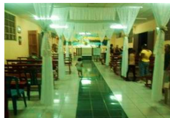
Iglesia católica Anglicana Protestante