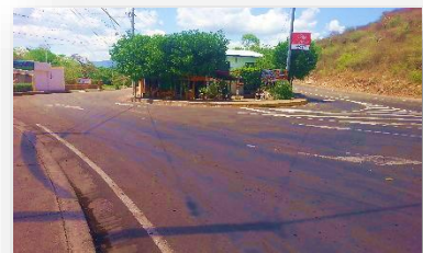
tomada en el 2015, entrada de villa-Chagüitillo.

Para poder llegar a Villa Chagüitillo es posible venir en vehículo de cualquier tipo e incluso, los autobuses que salen de Managua a los departamentos de Matagalpa, Jinotega, Estelí, Nueva Segovia o Madriz, pasan indispensablemente por Sébaco donde se le facilita a la persona tomar un taxi o los microbuses, que vienen a Villa Chagüitillo, situada aproximadamente, en el kilómetro 107 de Managua, 3 km. De Sébaco y 22 km. De la ciudad de Matagalpa. Villa Chagüitillo es una comunidad legítimamente constituida como villa, parte del municipio de Sébaco en el departamento de Matagalpa, la topografía es de planicies o valles a una altura promedio de 475 msnm. El clima es de tipo trópico seco con temperaturas de 25° C. y en las temporadas más calurosas hasta los 37°C. Con respecto a la población se estima un aproximado a 3500 habitantes. (ASDENIC, 2009).