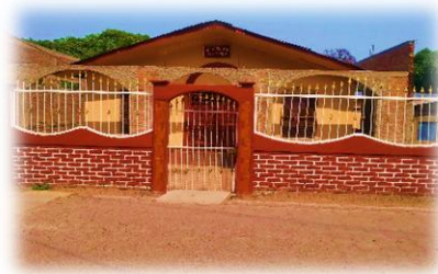
Iglesia luz y Vida 2016 foto actual.

Jóvenes tomando la iniciativa de realizar diferentes actividades para que los jóvenes se incorporen a la religión bautista de la iglesia Luz y Vida, actualmente en la iglesia hay más mujeres que hombres y niños pequeños, cada miembro juega un papel importante en la iglesia que ha hecho que la iglesia vaya creciendo y se incorpore a la sociedad con una perspectiva positiva.