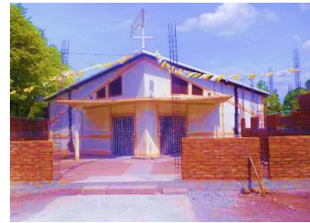
Iglesia Juan pablo segundo tomada en el 2013

Era una pequeña capilla, con el paso del tiempo se ha hecho un poco más grande ya que han venido incorporando más personas, el diseño años atrás tenía forma de un arca, pero a la vez tenía una forma de una estrella de cinco puntos, en la que se puede apreciar en los cinco esquinas, le daba una forma diferente como una estrella, los miembros de la iglesia decía que parecía una pequeña barca por el diseño y es el modelo que la hace ver diferentes y únicos pero aún no saben el origen de ese diseño que anteriormente tenía.