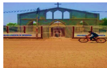
Iglesia católica Anglicana Protestante foto tomada por: Francis Díaz 2016.

Este año 2016 se han puesto como uno de los retos es promover charlas que ayuden a jóvenes a mejorar su calidad de vida en darle charlas con determinados temas unas de ellas es, las drogas, el licor igual y las consecuencias de su uso.