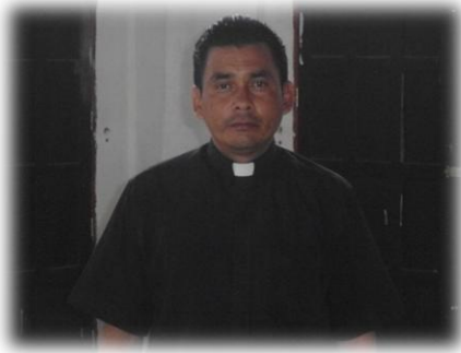
Padre Oscar de la iglesia Católica roma San Juan de Dios