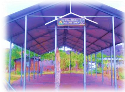
Iglesia Adventista del séptimo día foto tomada por Francis Díaz, tomada en el 2013 primera construcción de la fachada de la iglesia

Definitivamente, los miembros de la iglesia son lo que ayudan en la construcción de dicha iglesia el propósito de la construcción es que tengan un lugar más o gusto y cómodos para que los feligreses y miembros se sientan más seguros y tengan todo lo necesario aunque, aún les hace falta elementos para concluir, algunos materiales para la construcción de la iglesia no tienen los recursos necesario ya que los miembros igual que las demás son de escasos recursos y los instrumentos musicales no tiene ya que apenas se está construyendo el templo.