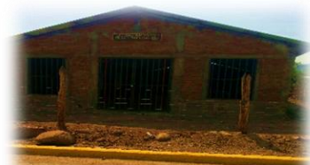
Iglesia Adventista del séptimo día

En la actualidad de este año electivo 2016, se encontró un nuevo cambio en la iglesia adventista se han venido creciendo actualmente, aunque son pocos jóvenes siempre asisten los sábados de 8:00 am hasta las 12:00 am a veces salen más temprano de sus cultos ya que ello opina que es lo que Dios designo para descansar y que el día Domingo esta erróneo para adorarlo.