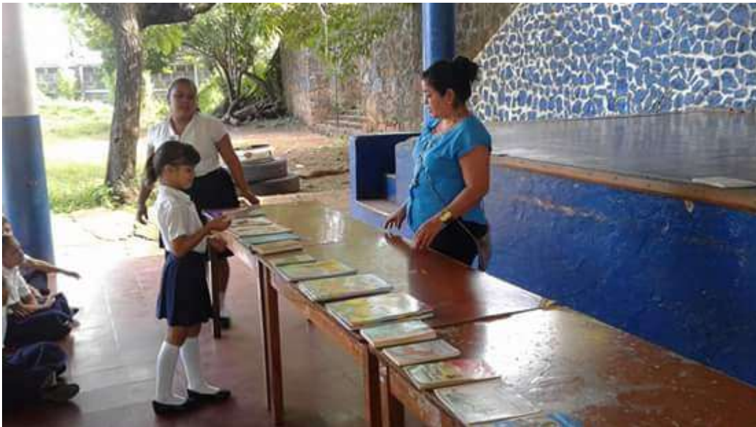
Niña participando en el maratón de lectura, en donde selecciona el libro que ella desea leer sin ser impuesto por la docente.