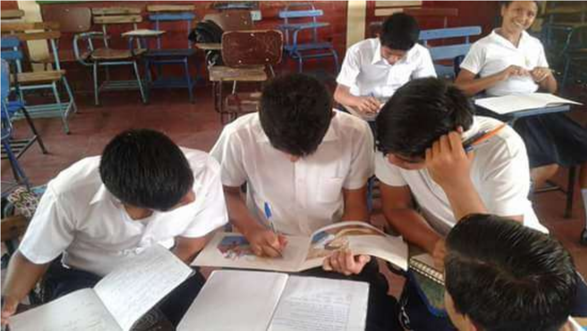
Proceso de lectura (estudiantes del 7 a "A" del Instituto de Santo Tomas)