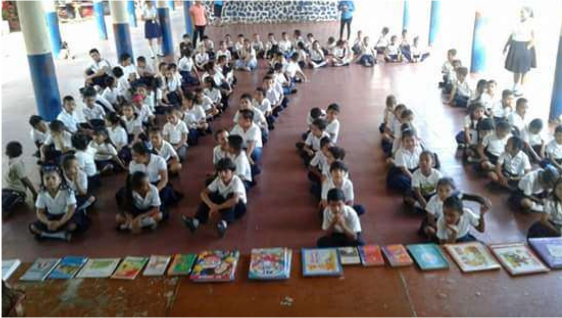
Desarrollo de la habilidad de leer a través del maratón de lectura