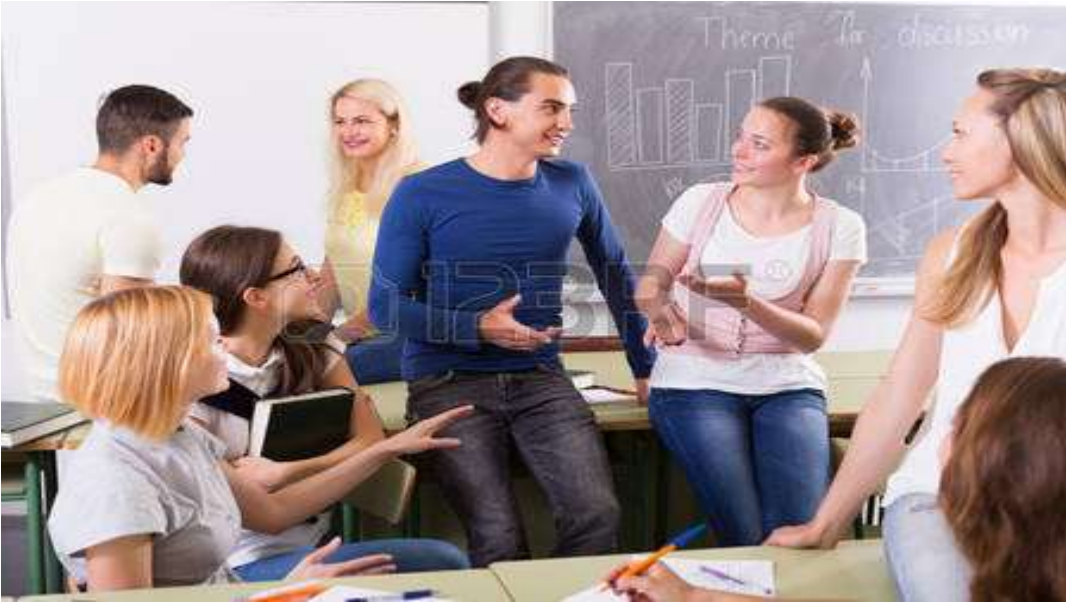
Jóvenes desarrollando la habilidad del habla.