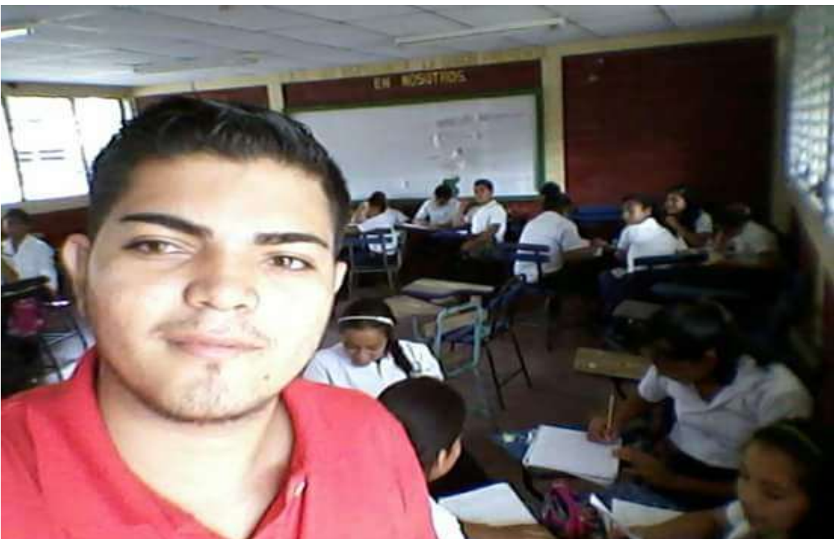
Desarrollo de la habilidad de la escritura