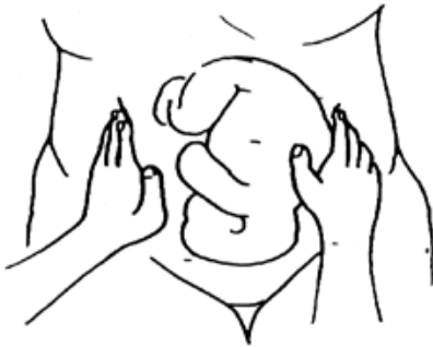
Figura 28. Segunda maniobra de Leopold.