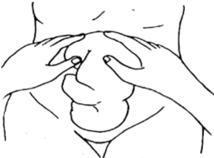
Figura 27. Primera maniobra de Leopold.