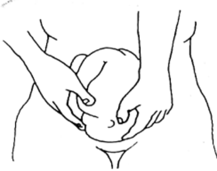
Figura 30. Cuarta maniobra de Leopold.