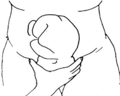
Figura 29. Tercera maniobra de Leopold.