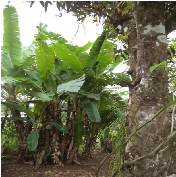
Alimentos cultivados en los huertos familiares o patios de los hogares.