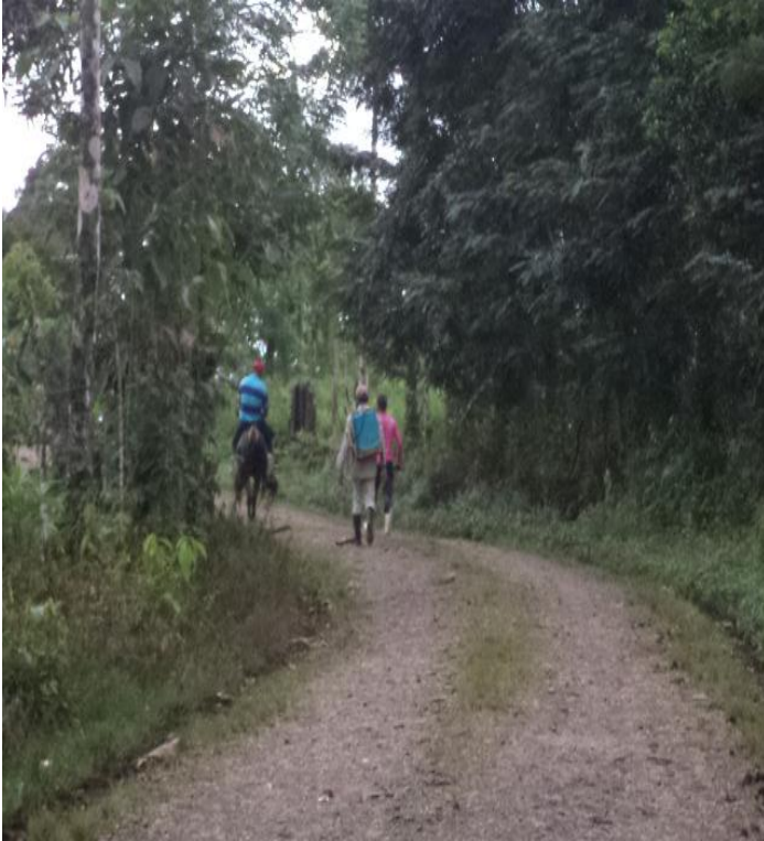
Agricultores de regreso a casa luego de sus jornadas de trabajo en el campo.