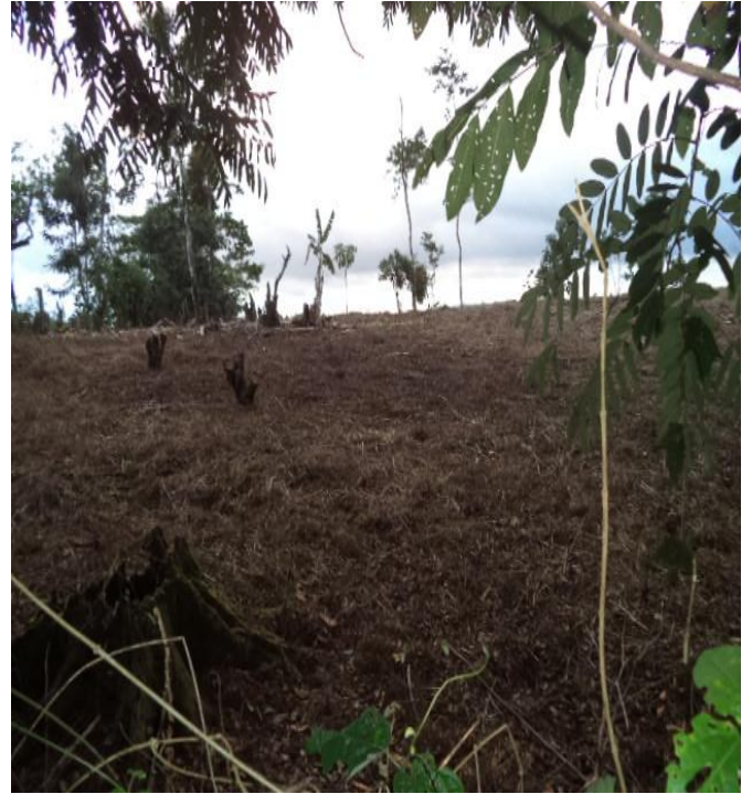
Despale como forma de preparar la tierra antes de cultivar.