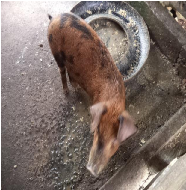
Crianza de especies menores en el hogar y agricultor laborando en el campo.