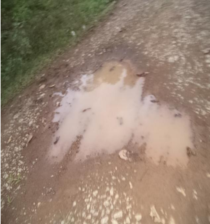
Vías de acceso de la comunidad en mal estado.