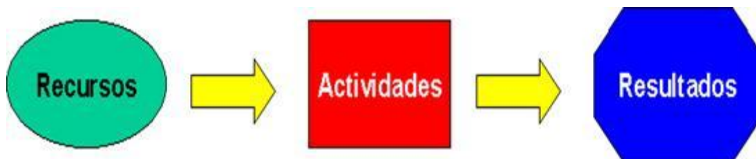
Imagen N° 5: Diseño de la metodología de costeo ABC