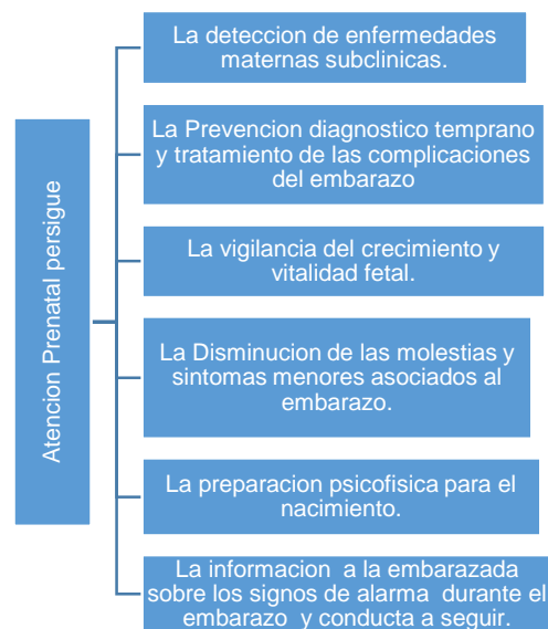
Figura 1: Objetivos de la prevención prenatal

El modelo de atención prenatal de la Organización Mundial de la Salud (OMS) clasifica a las mujeres embarazadas en dos grupos: