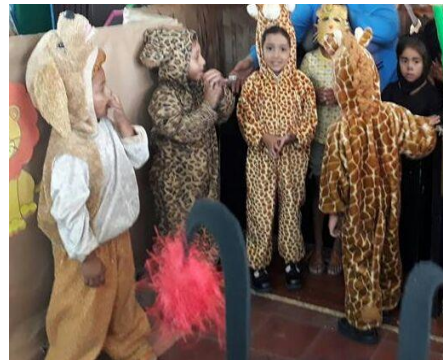
La Jirafa Presumida