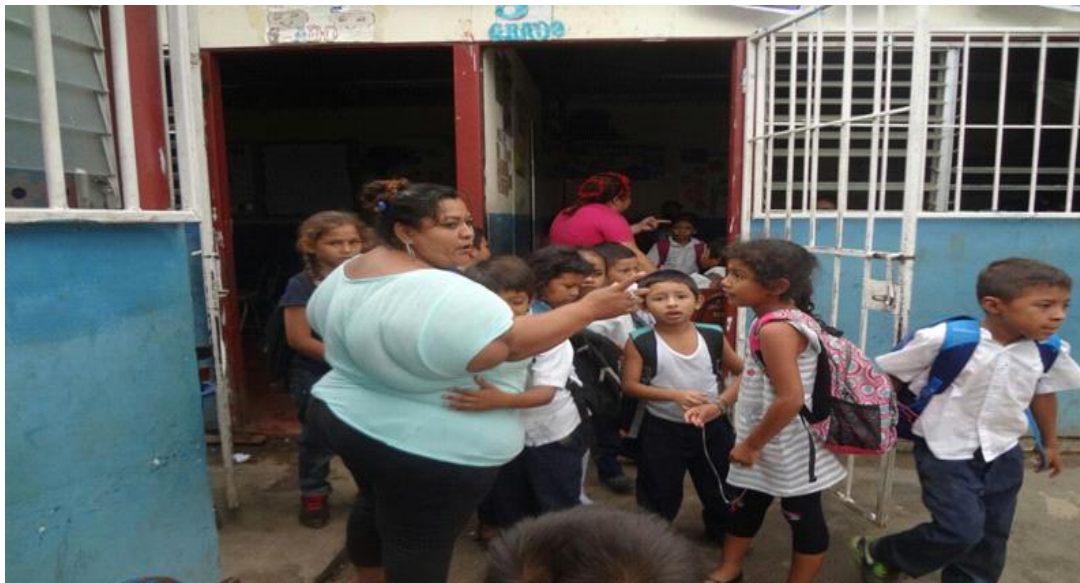
Docente del grado con niños que reciben reforzamiento en lectoescritura