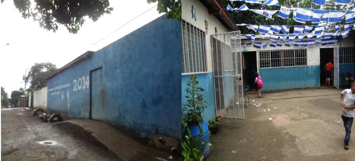
Entrada de la escuela