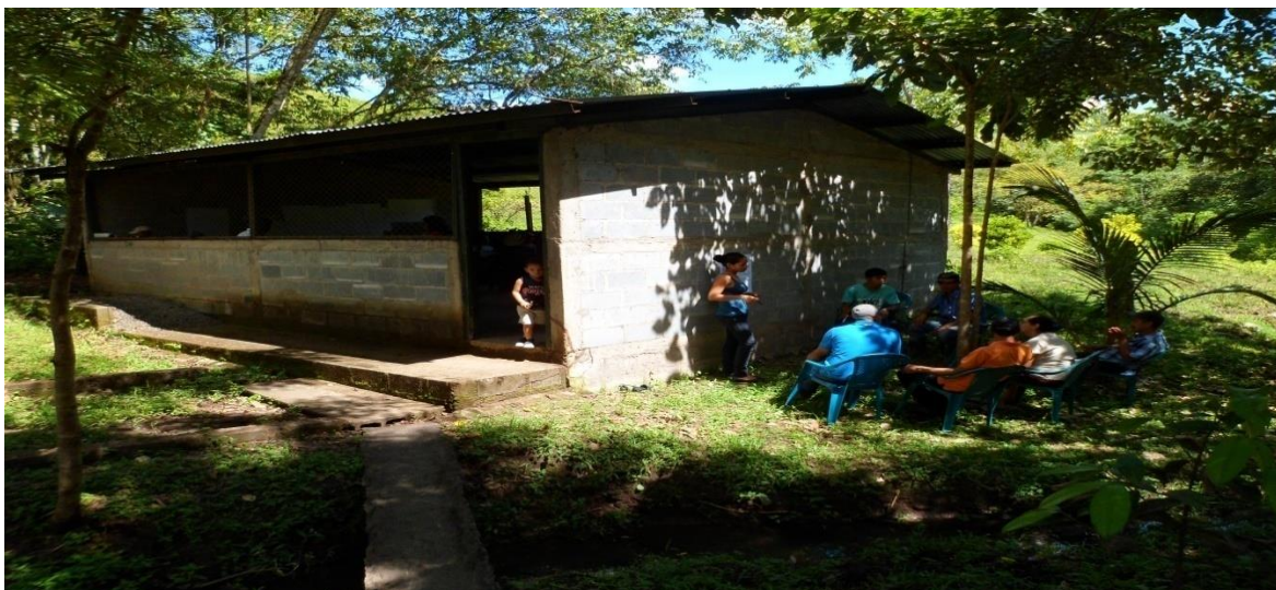
Foto N. 4.Casa comunal de Yahoska