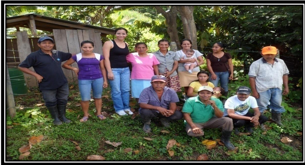
Foto N° 3. Socios y socias del fondo revolvente de la comunidad de Achiote Arriba