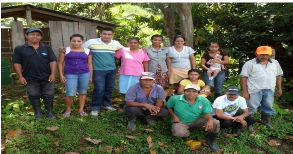
Foto N° 6. Socios del fondo revolvente de la Comunidad de Achiote Arriba