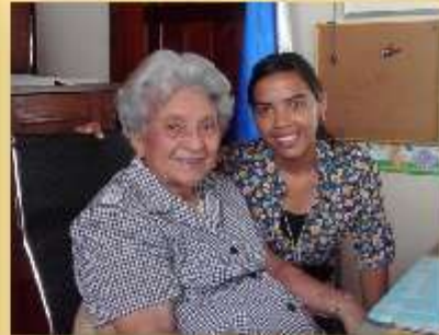
Con la Directora del Preescolar