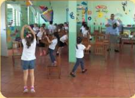
Dejando en orden el Salón de Clases.