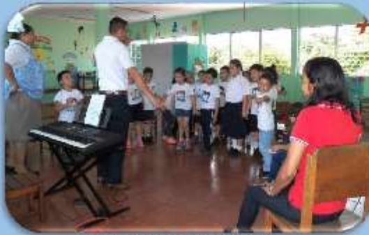
Ejercicio de imitación rítmica