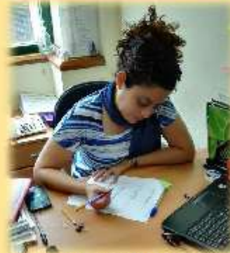
Obteniendo opinión del Padre de Familia.