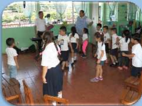
Ejercicios de desplazamiento