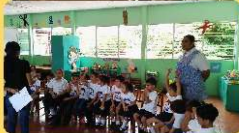
Conversatorio con los niños y niñas.