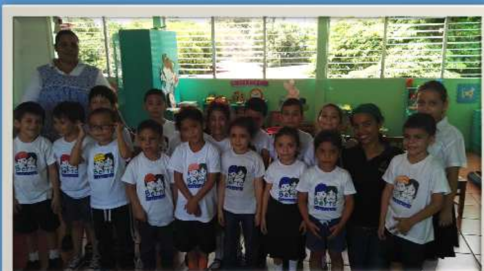
Niños y Niñas del III Nivel Berta Preescolar.