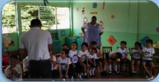
Mostrando como usar los instrumentos de percusión menor