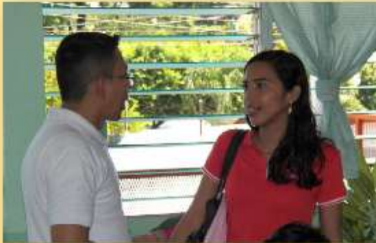
Con el Docente de Música.