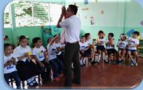
Usando la Rítmica.