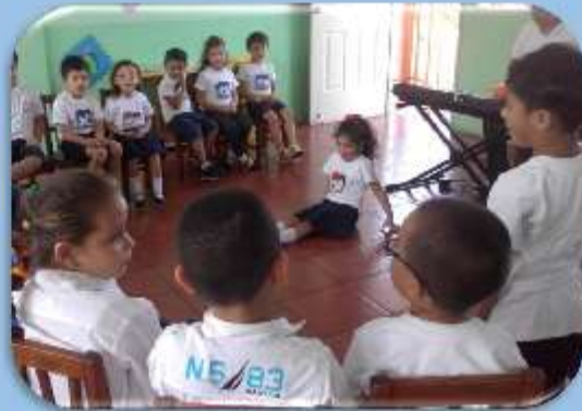
Ejercicio de identificación de los sonidos graves y agudos