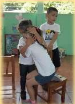
Expresión de Compañerismo.