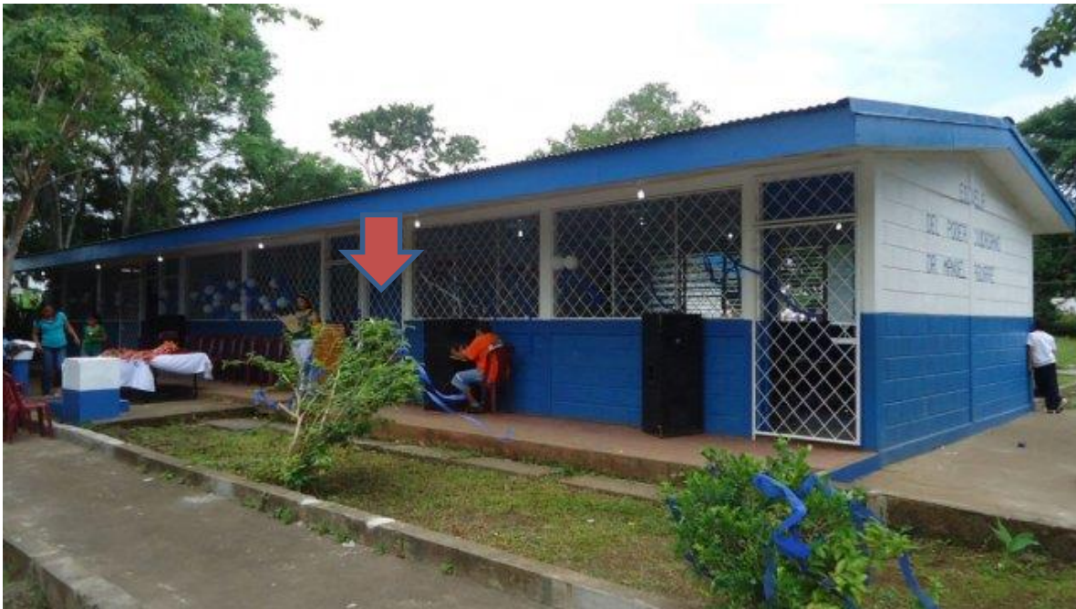
Escuela "San Vicente"

La escuela San Vicente limita al norte con la comunidad de Jerusalén, al sur con la comunidad de La Argentina, al este con la comunidad de Loma Quemada y al oeste con la comunidad de Morrillo.